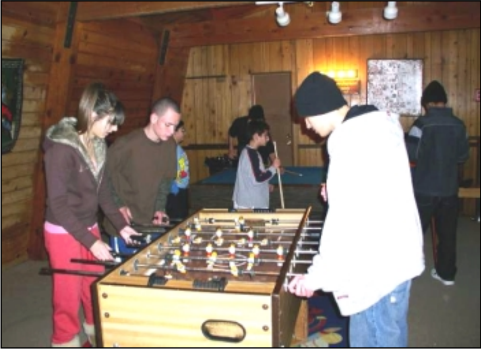
Պատանի-պարմանուհիները խաղի պահուն

Շաբաթ իրիկուն յայտագիրը շատ ճոխ էր, ուր հայկական