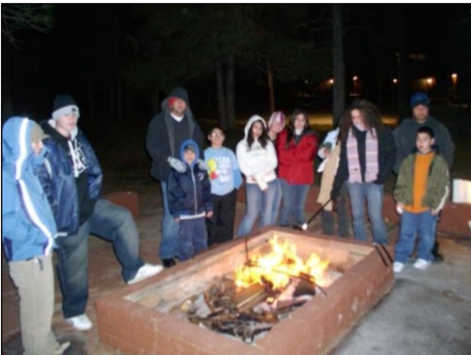
Homenmen members keeping warm in front of fireplace

At night, the participants of the retreat were treated to traditional Armenian cuisine, accompanied by singing of contemporary and traditional Armenian songs, followed by patriotic songs. These events