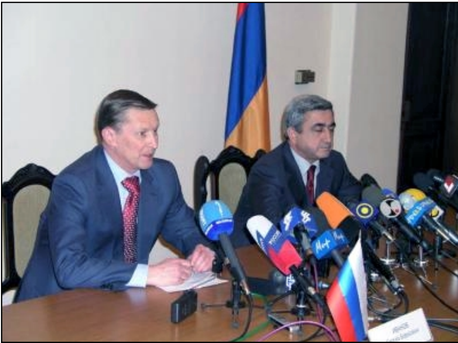
Ռուսաստանի պաշտպանության նախարար Սերգեյ Իվանով (ձախից) եւ Հայաստանի իր պաշտօնակից Սերժ Սարգսյանը Երևանի մէջ կայացած մամուլային ընթացքին

ԵՐԵՒԱՆ, «ԱՅԲ-ՖԷ»: «Ռուսական գազի գինը առնչութիւն չունի մեր ռազմական համագործակցութեան հետ. ռուսական ռազմական շահերը մեր խնդրանքով են տեղակայուել Հայաստանում եւ հանդիսանում են մեր անվտանգութեան բաղադրիչ մասը», - յայտարարեց ՀՀ պաշտպանութեան նախարար Սերժ Սարգսյանը, եւ նկատելով, որ ամէն ինչի մասին բաց ու թափանցիկ չեն խօսում, ասաց. «Հաւատացէք, մենք դրանից շատ աւելի շահում ենք, քան կորցնում, շատ աւելի ստանում ենք, քան տալիս»: