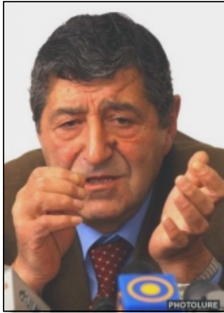
ԱժԳ նախագահ Արշակ Սաղոյեան

ԵՐԵՒԱՆ, «ԱՅԲ-ՖԷ»: Ընդդիմութիւնն ապրում է քաղաքական յտակեցման փուլ եւ այսօր ընթացում են քննարկումներ «Քաղաքացիական Հայաստան» կոմիտէ ստեղծելու ուղղութեամբ: Կ'ստեղծուի մի փաստաթուղթ, որի տակ կ'ստորագրեն անհատներն ու կուսակցութիւնները, եւ որում գրուած կը լինի. «Ես պարտաւորուած եմ ակտիւօրէն մասնակցել առաջիկայ գործընթացներին»: Այսպիսի պարզաբանում տուեց այսօր «Ա1+»-ի հարցադրմանը «17+1» ֆորմատի ներկայացուցիչ, ԱժԳ նախագահ Արշակ Սաղոյեանը: