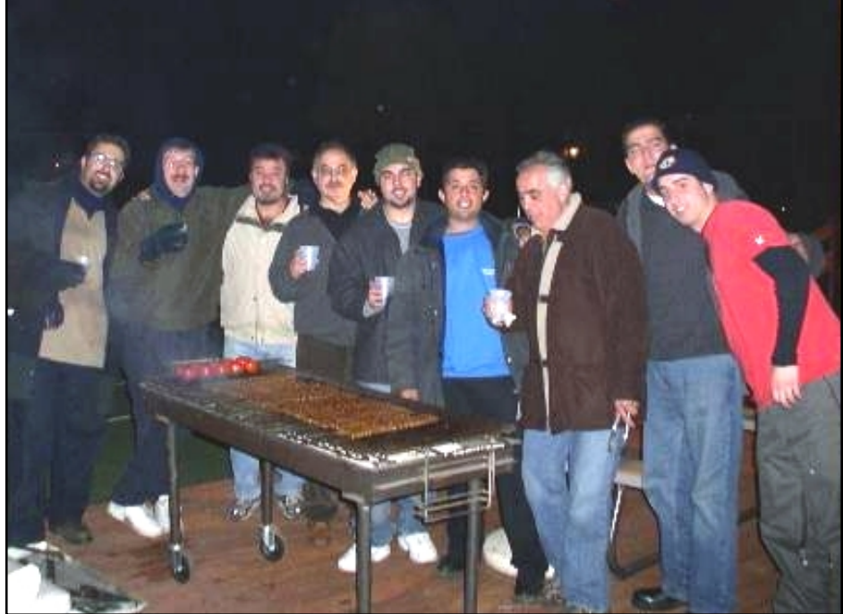
Հ.Մ.Մ.ի պատասխանատուները կրակարանին առջեւ

նաբերեցին թէ հայ լեզուն իսկապէս յատուկ է, եւ գաջն պէտք չէ կորսնցնել: Իսկ այդ մէկը ընելու լաւագոյն ձեւը հայերէն խօսիլն է: Հ.Մ.Մ.ի հիմնադրութենէն ի վեր, միութեանս նպատակներէն եղած է հայ պատանիները դաստիարակել այնպիսին որ անոնք դասնան պատուաբեր հայ երիտասարդ-երիտասարդուհիներ, ինչպէս նաեւ իրենց ապրած երկրին տիպար քաղաքացիները: Պտոյտին եզրափակիչ հանդիպումին պատանիներուն ցուցաբերած կամքը, պահելու մայր լեզուն, ցոյց տուաւ որ Հ.Մ.Մ.ի եւ նման քոյր կազմակերպութիւններու աշխատանքը ապարդիւն չէ: Վարձքերնիդ կատար: