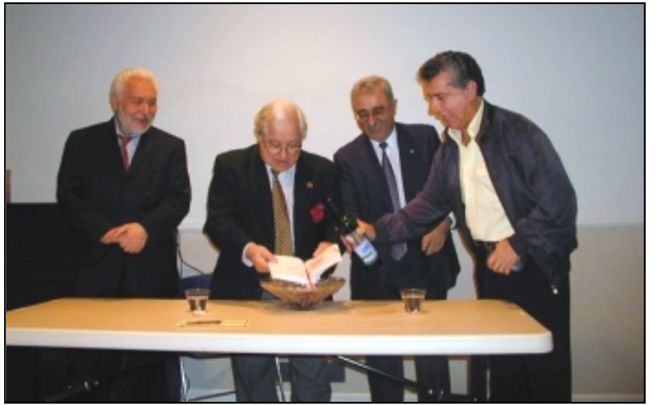
«Դեռ չեմ սպառել» գրքի գինեձօնի արարողութեան պահ մը