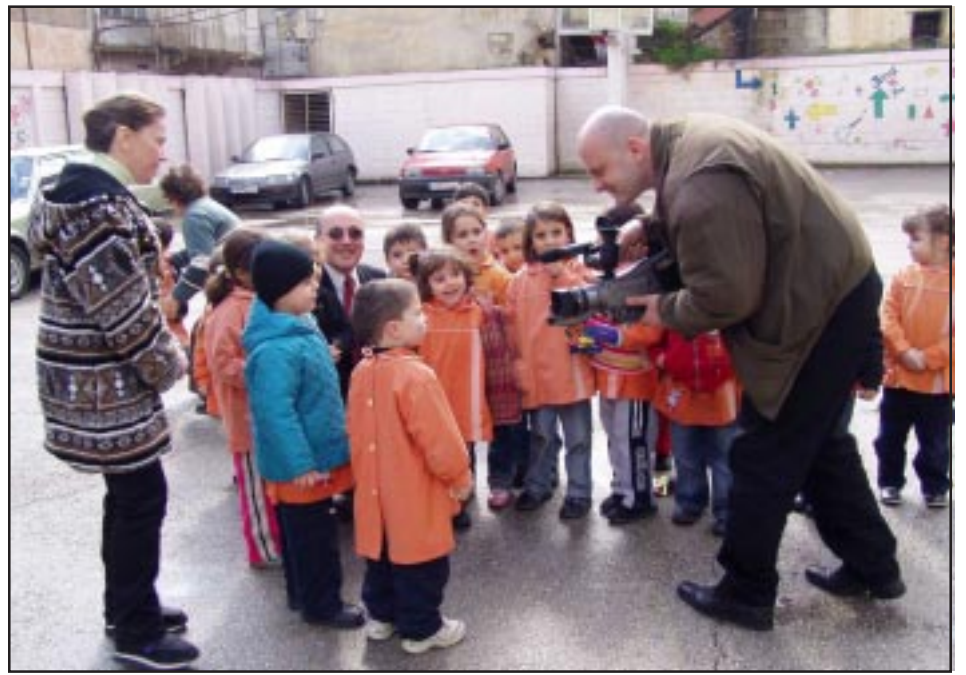
Children of the Armenian Evangelical School of Trad enjoy standing in front of the Camera

During the visits to each school, it was evident that even though the schools were hit hard financially, their academic achievements were excellent. All four high schools ranked high with almost all students passing the Baccalaureate exams. The schools provide a continuous supply to Haigazian University, which is the only Armenian institution of higher edu-