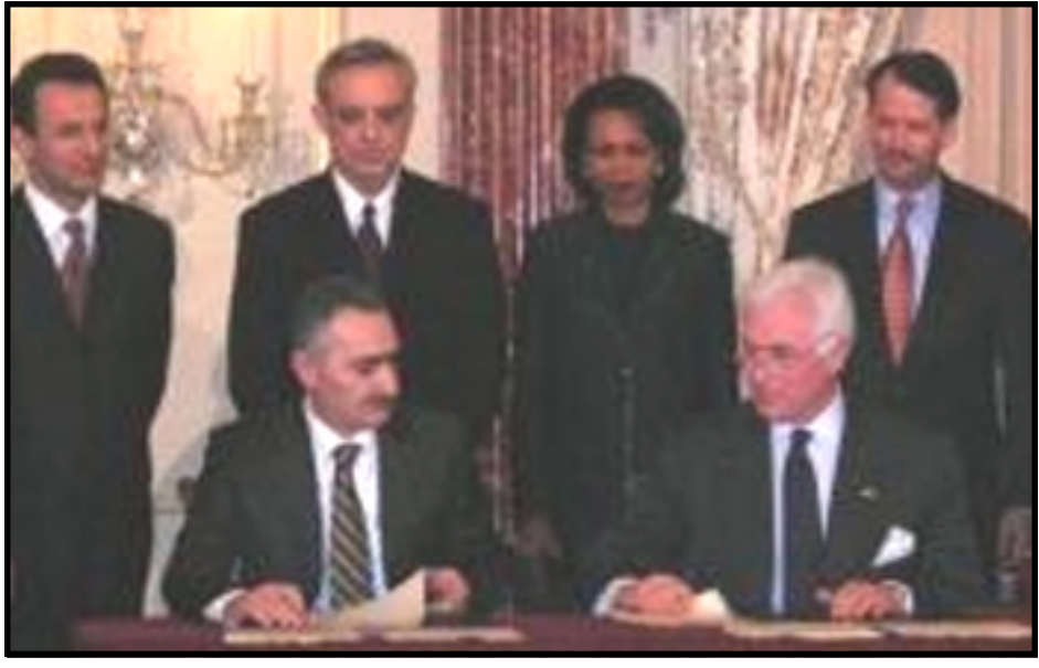
Պաշտօնական արարողութեան ընթացքին նախարար Վարդան Խաչատրեան ու «Հազարամեակի մարտահրաւէր» ընկերակցութեան գործադիր տնօրէն Ճոն Դանիլովիչ կը ստորագրեն համաձայնագիրը. Ռոմի կեցած են Քոնտալիզա Ռայս, Վարդան Օսկանեան դեսպան Էվընգ եւ ուրիշներ:

Հայաստանի Արտաքին գործոց նախարար Վարդան Օսկանեան, իր հերթին, ընդունեց, որ արդէն իսկ Հայաստանի իշխանութիւնները քայլեր կը ձեռնարկեն միջազգային չափանիշներուն հար-