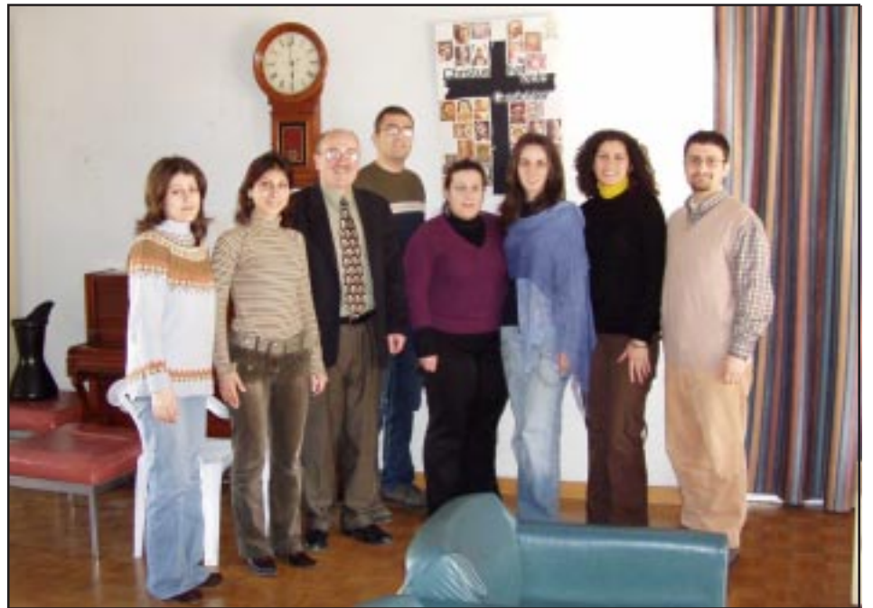
AMAA Field Director with seminarians at the Near East School of Theology