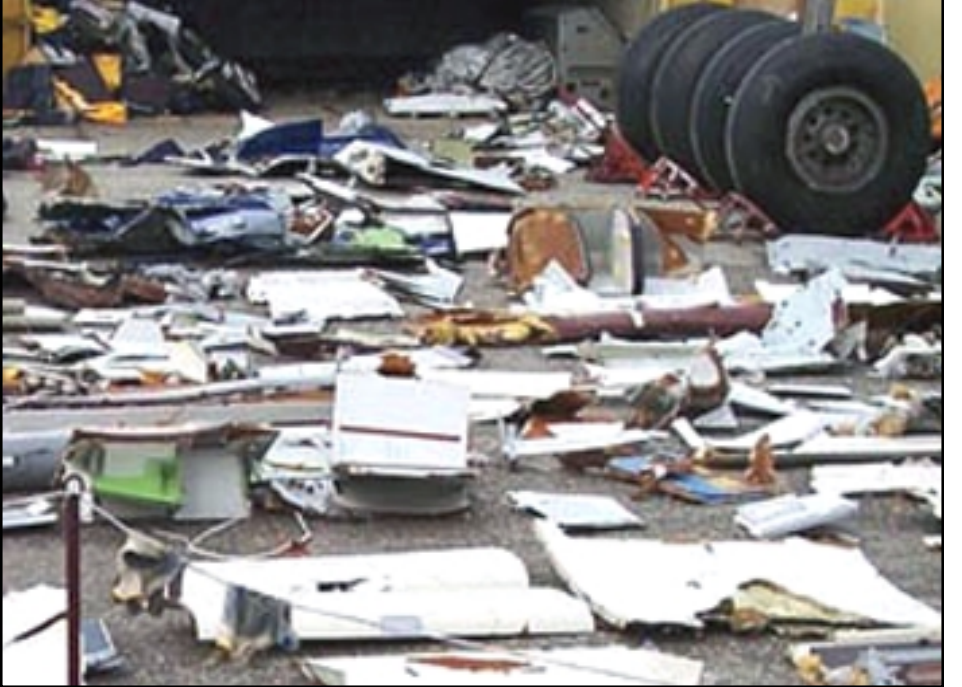
Մայիս 3-ին կործանուած հայկական օդանաւի ծովէն հանուած բեկորները

«ԱԶԱՏՈՒԹԻՒՆ ՌԱՏԻՈՅ»: Մայիս 16-ին Սոչիում սկսուել են A320 հայկական կործանուած օդանաւի «սեւ արկղեր»-ի բարձրացման աշխատանքները. վաղ առաւօտից ծով է դուրս եկել ժամանակակից սարքաւորումներով զինուած «Նաւիգատոր» նաւը: