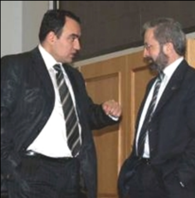
ՀՀ Ազգային Ժողովի նախագահ Արթուր Բաղդասարեան (ձախիմ) կը գրուի իր հաւանական յաջորդ՝ Տիգրան Թորոսեանի հետ

«Արդարութիւն» խորհրդարանական խմբակցութեան ղեկավար Ստեփան Դեմիրճեան «Օրինաց Երկիր» կուսակցութեան համախոհական իշխանութեան կազմէն դուրս գալու կապակցութեամբ «Ազատութիւն» ռատիոկայանին յայտարարեց «Կարող ենք արձանագրել, որ կողմնակից լինելու գոյութիւն չունի»: