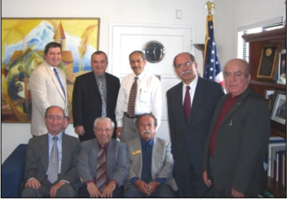
Հնչակեան Կուսակցութեան եւ Հայ Աւետարանական Համայնքի ղեկավարները հանդիպման աւարտին