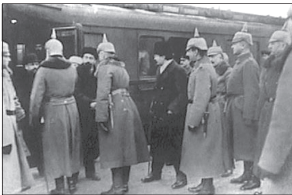
Գերմանացի զինուորականները կը դիմաւորեն Թրոցկին Պրեսթ Լիթովակի վայրից մէջ

Խորհրդային պատուիրակութիւնը Սոքոլեւիկովի գլխավորութեամբ Պրեսթ-Լիթովակ ժամանեց բանակցութիւնների երրորդ փուլը վարելու եւ հաշտութիւն կնքելու համար: Ըստ գերմանական վերջնագրի պայմանների, հաշտութեան բանակցութիւնները վարելու եւ աւարտելու համար նա ունէր ընդամենը յոգնակութիւն է ձեռք բերում իր կորսուած հայրենիքի նկատմամբ: Նախորդ գիշերները չէին բաւարարում թալաւաթին: Նա պահանջեց նաեւ Արեւելեան Հայաստանի շրջանները՝ Կարսը, Արտասանը, վրացական Պաթում նաւահանգիստը, գործողութիւնների ազատութիւն Անդրկովկասում: Հետագային է, որ թալաւաթը, իոֆֆէի վկայութեամբ, յաճախ էր թրոցկուն յիշեցնում, որ ինքը «նոյնպէս յեղափոխական է»: