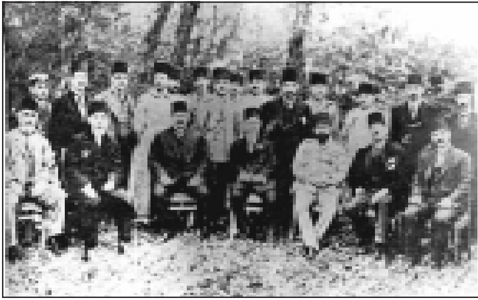
Երիտ Թուրքերու ղեկավարութիւնը

Այսպիսով, Թրոցկու-Թաւաթի ծրագիրը ստացաւ իր վերջնական եւ, այսպէս ասած, նիւթական մարմնակոտորումը՝ այդ երեք մարզերը թուրքիային յանձնելու Սոքոլնիկովի համաձայնութեամբ: Հաշտութեան պայմանագիրը Պրեսթ-Լիթովսկուում ստորագրուեց հենց նոյն օրը՝ 1918 թ. Մարտի 3ին: