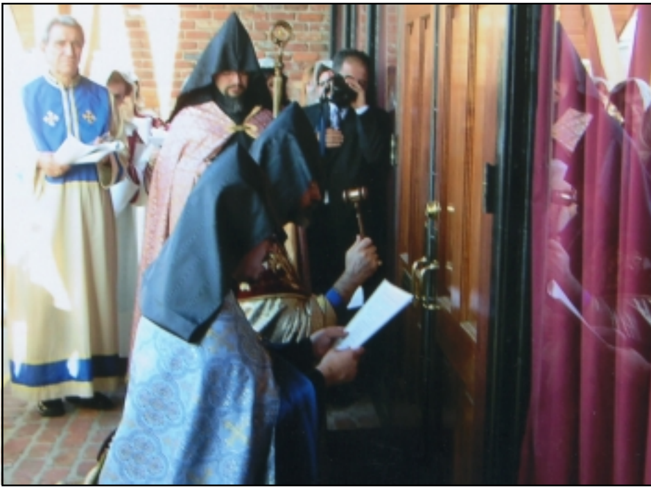
Տեսարան մը Դոմրացէֆի արարողութենէն

ՕԾՈՒՄ ՊԱԹՈՆ ՈՒԹԻ Ս. ԿԱՐԱՊԵՏ ԵԿԵՂԵՑԻՈՅ Նախքան Ս. Կարապետ եկեղեցւոյ պաշտօնական օծման արարողութեան՝ Շաբաթ, Մայիսի 13ին, երեկոյեան տեղի ունեցաւ դռնբացէքի արարողութիւն եւ նոր եկեղեցւոյ միտոսութեան աւագանի օծում: Կիրակի, Մայիսի 14ին, 2006, տեղի ունեցաւ Պաթոն Ռուժի Ս.