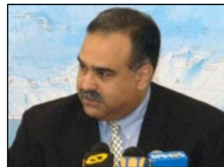
Leader of Zharangutyun party Raffi Hovannisian

But they returned to the scene several hours later, claiming that the party leaders were only supposed to briefly in-