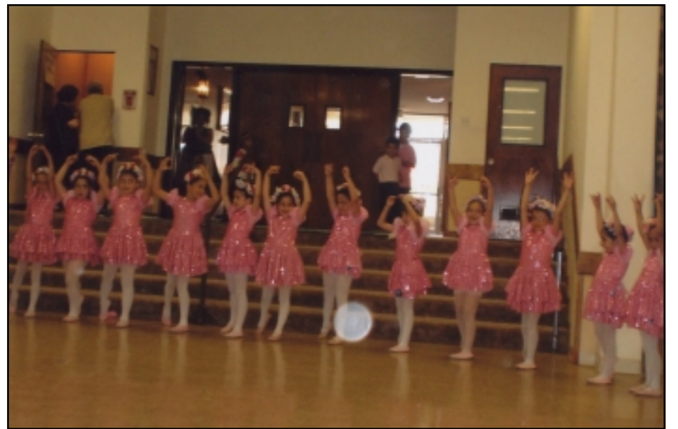
Դպրոցի մանուկներու պարախումբը ելոյթի պահուն

Յովսէփեան վարժարանի Մուղա-ուսուցչական կազմին Մայրերուն Օրուան առթիւ կազմակերպած Թէյաճառքը, որ տեղի ունեցաւ Շաբաթ, Մայիս 13, 2006ին, հաճելի ժամանց մը եղաւ ներկայ եղող ծնողներուն, ուսուցիչներուն եւ բարեկամ-բարեկամուհիներուն