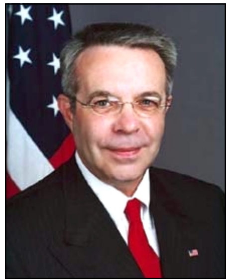
Նորանշանակ դեսպան Ռիչըրտ Հոգլընտ

Ամերիկեան Գոնկրէսի Ներկայացուցիչներու Տան 60 անդամներու ստորագրութեամբ նամակ մը յղուած է պետական քարտուղար Քոնդոլիզա Ռայսին՝ պարզելու համար, թէ ի՞նչու պաշտօնանկ եղած է Հայաստանի մօտ Միացեալ Նահանգներու դեսպան Ջոն Էլլընդ, որ