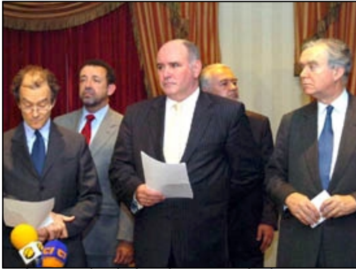
Մինսկի խումբի միջնորդները Երեւանի մէջ կը ներկայացնեն իրենց յայտարարութիւնը

Ժաք Շիրակ եւ Իլհամ Ալիեւ կարծիքներ փոխանակած են նաեւ տարածաշրջանէն ներս՝ մասնաւոր-