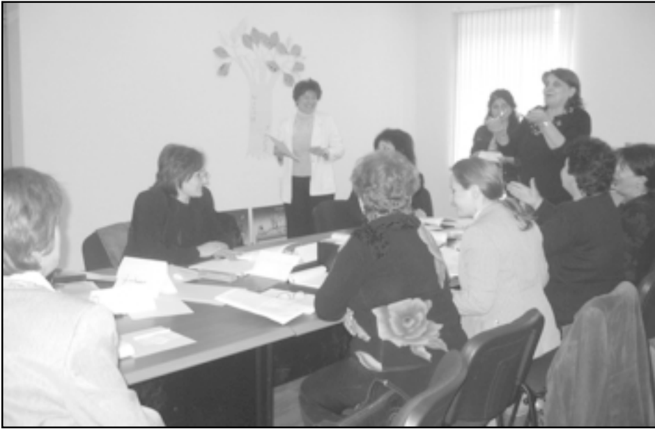
Training course for teachers from Syunik, Lori, Kotayk, and Yerevan