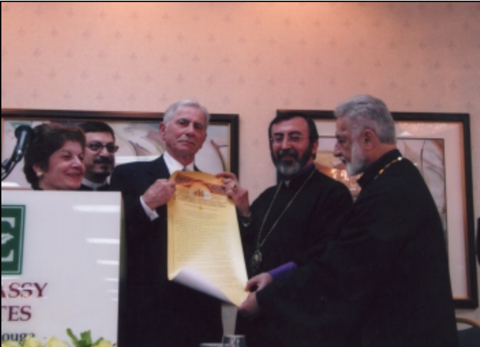
Պօղոս Մութաֆեանի կը յաճնուի Ամենայն Հայոց Կաթողիկոս Գարեգին Բ.ի Հայրապետական կոնդակը

րինա» մըրիկէն աւերուած աղիտալի շրջանները: Նշենք նաեւ որ իր ատենին Խաժակ Սրբազանի նախաձեռնութեամբ յատուկ նուիրահաւաք կազմակերպուեցաւ «Քաթրինա»ի աղէտէն տուժած հայ եւ տեղացի բնակիչներուն: Կէսօրին՝ Խաժակ Սրբազան եւ իր շքախումբի անդամները հիւրընկալուեցան Գրիգոր Տաքէսեանի կողմէ, Գրէսէնթ Սիթի Պրու Հաուզ ճաշարանին մէջ: Այստեղ