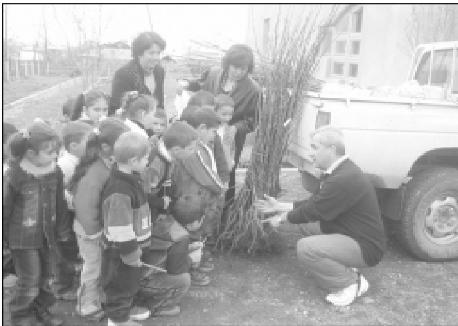
Training and tree planting with the kindergarten class at Kurtan village

"It would be an honor for me to continue collaborating with the ATP Environmental Education Program, as I feel this gives me an overall understanding of a new methodology along with practical advice which I will definitely apply in my teaching activity," wrote one teacher in the evaluation. Another teacher believed the program should be expanded to the