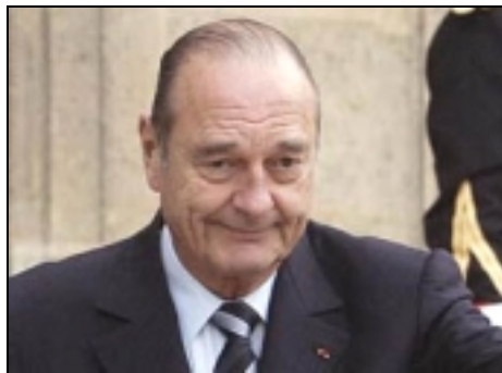
French President Jacques Chirac

President Chirac indicated that, "there was no alternative to peace talks and reminded of importance of peace for Azerbaijan, Armenia and the region as a whole."