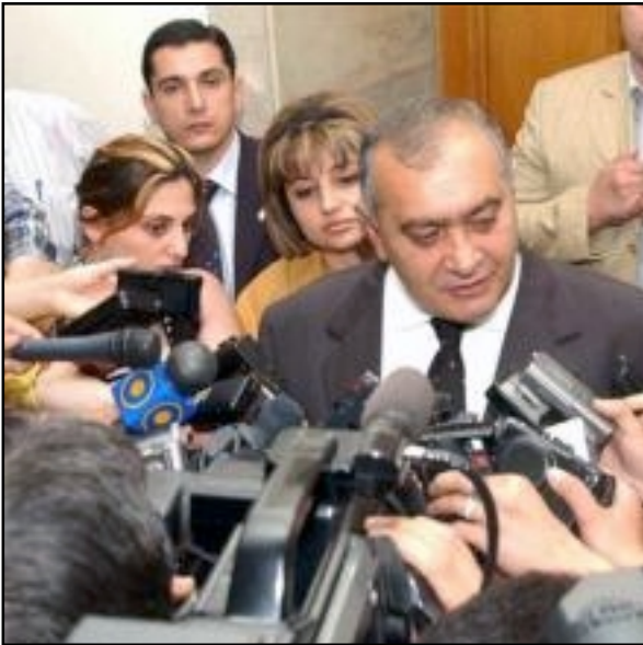
Անդրանիկ Մարգարեան կը պատասխանէ լրագրողներու հարցերուն

ԵՐԵՒԱՆ, «ԱՅՔ-ՖԷ»: ՀՀ վարչապետ Անդրանիկ Մարգարեանն առաջիկա չի շտապում տեղեկացնել, թե Սերժ Սարգսյանը ՀՀ-ի համամասնական ցուցակում տեղ կ'ունենայ, թե՞ ոչ՝ «ժամանակը կգայ՝ կ'իմանաք»,- Յունիս 5-ին լրագրողների հետ ճեպագրույցի ժամանակ ասել է Անդրանիկ Մարգարեանը: