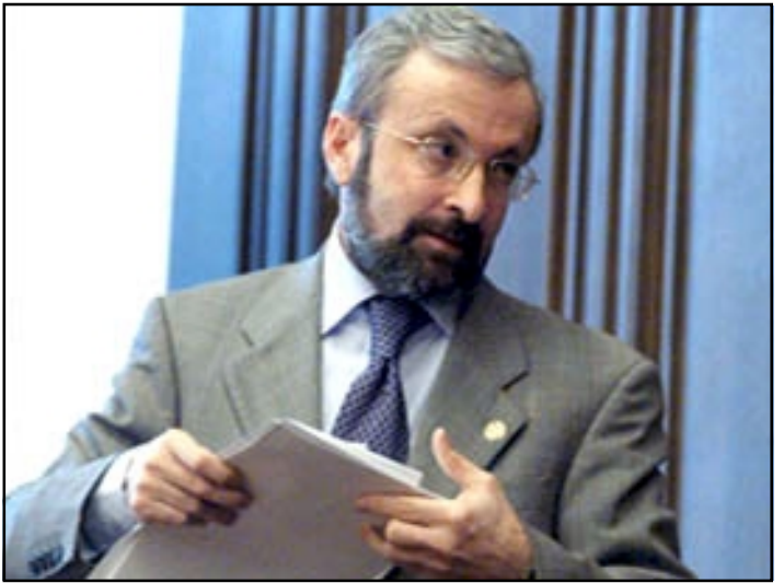
Հայաստանի Ազգային ժողովի նոր նախագահ Տիգրան Թորոսեանի օգտին 97 պատգամաւորներ

Հինգշաբթի, Մայիս 1-ին Հայաստանի Ազգային ժողովի նոր նախագահ ընտրուեց Տիգրան Թորոսեանը, որը մինչ այդ խորհրդարանի փոխսօսնակն էր: Նա առաջադրուած միակ թեկնածուն էր: