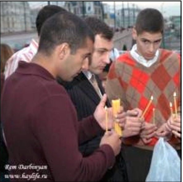
Հայ երիտասարդներ Մոսկուայի մէջ մոմաւարութեամբ ցայց կը կատարեն

ԵՐԵՒԱՆ, «ԱՅԲ-ՖԷ»: Մոսկուայի հայ համայնքը սկսել է ակցիաների շարք՝ ի յիշատակ սափրագլուխների ձեռքերից զոհուածների: Այդպիսի ակցիաներից մէկի կազմակերպչը երիտասարդներն էին, որոնք ներկայացնում էին Մոսկուայի եւ դրա շրջակայքի բնակավայրերի հայ համայնքը: