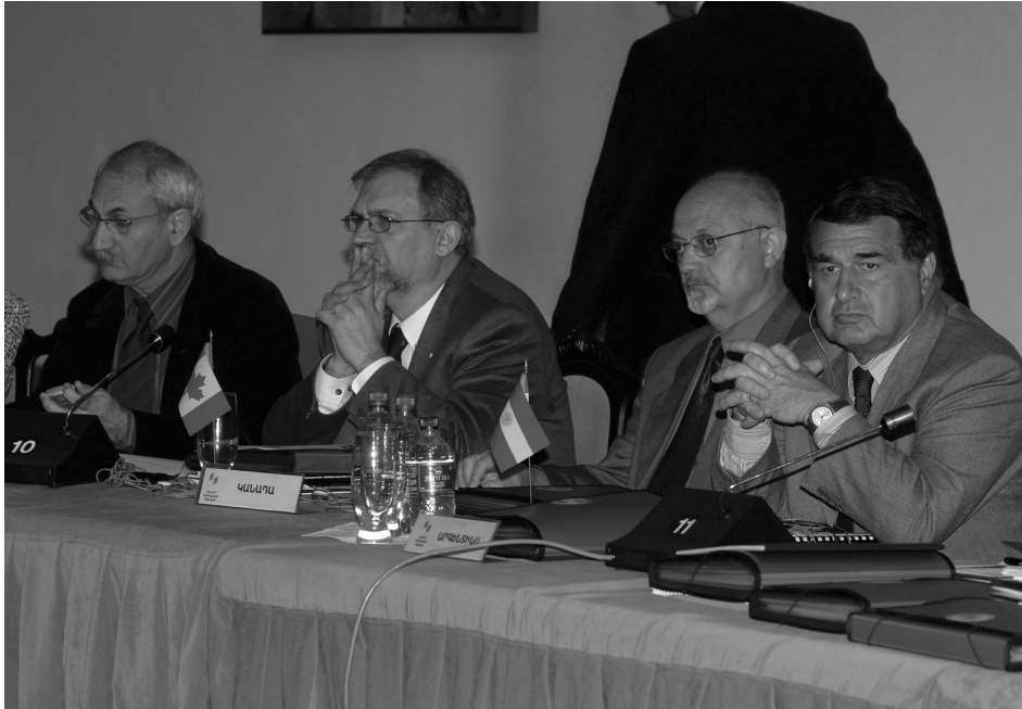
«Հայաստան» Համահայկական Հիմնադրամի Կանադայի, Ֆրանսիայի եւ Արգենտինայի տեղական մարմինները