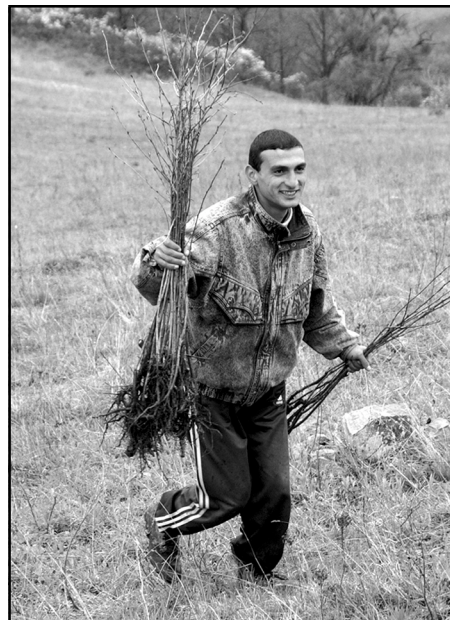
Over 343,750 seedlings purchased from 118 families or grown in ATP's reforestation nursery in Lori were planted in the Getik Valley of the Gegharkounik region north of Lake Sevan

Eighty workers—all residents of the villages of Aghavnavank, Dzoravank, Dprabak, and Aygut—were employed by ATP to implement the tree-planting activity on the neighboring hillsides. Seedlings were purchased from backyard nurseries owned by 118 families in these rural communities, which are mainly in