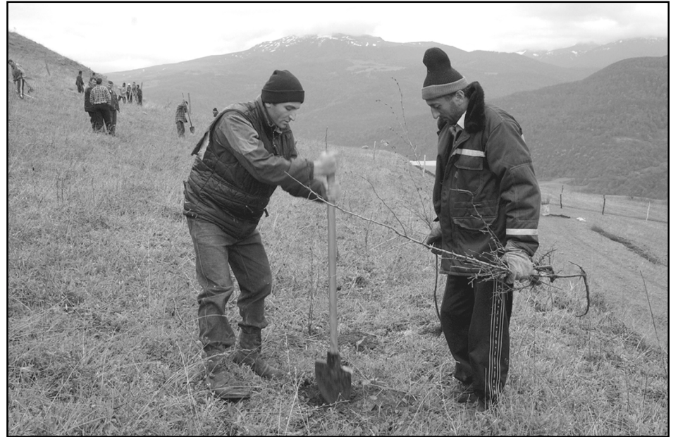
Eighty workers from the villages of Aghavnavank, Dzoravank, Dprabak, and Aygut were employed by ATP to assist in the reforestation of 400 acres of land in the Getik River Valley this spring

YEREVAN -- Armenia Tree Project (ATP) expanded its reforestation program by planting 343,750 trees in the Getik River Valley of the Gegharkounik region north of Lake Sevan in April-May 2006. Plantings on two massive forest plots covered a total of 400 acres with indigenous species of trees, including chestnut, maple, ash, oak, walnut, wild apple, and wild pear.