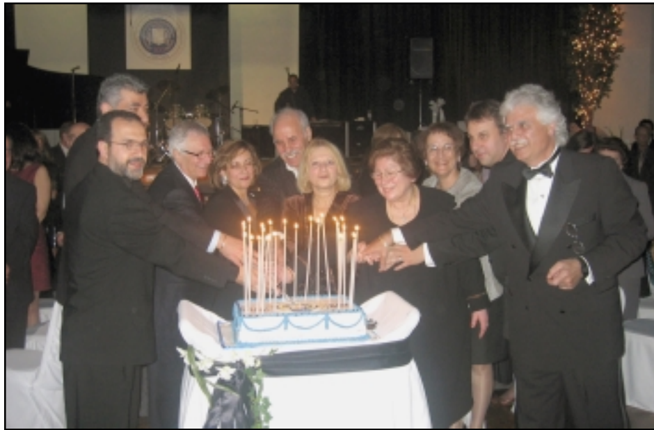
Հ.Բ.Լ.Մ. - ի 100-րդ Տարեդարձի կարկանդակի արարողութիւնը

Մայիս 13, 2006 թուականին պատշաճօրէն նշուեցաւ Հայկական բարեգործական Ընդհանուր Միութեան 100 ամեակը Թորոնթոյի մէջ: