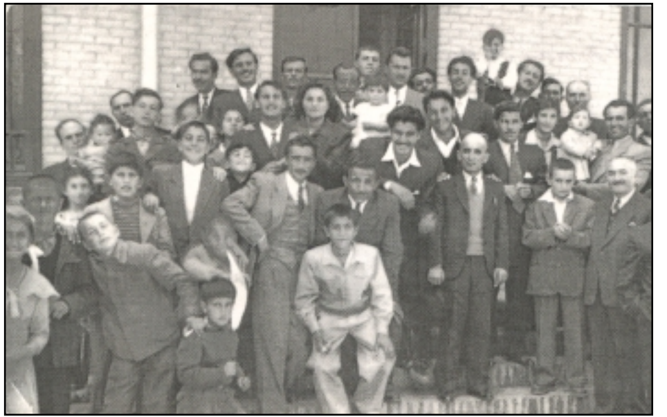
1950 թ. Մաշհադի Ս. Մեսրոպ եկեղեցւոյ մուտքին Ս. Զատկուայ տօնին

Այսպիսի նահանգում եւ այսպիսի քաղաքում տարբեր ազգեր են բնակուել որոնց մէջ եղել են մի բուռ հայեր, որոնք 19րդ դարու վերջին Ղազարների թագաւորութեան շրջանում վաճառականական եւ արհեստի բնագաւառում գործնական դեր են ունեցել եւ հնարաւորին չափ ծառայել այս երկրին: Այս գաղթողները՝ գաղթել են Երեւանից, Արցախից, Նախիջեւանից, Ազուխից կամ Ռուսաստանից էին, մի որոշ տոկոսով եկել էին իրանի Ատրպատականից եւ Իսֆահանից եւ գբադում էին վաճառականութեամբ եւ տարբեր արհեստներով: Ատրպատականից կալի է յիշել թումանեան եղբայրներին որ ունեցել են վաճառական աչքառու գործունէութիւն՝ որի մա-