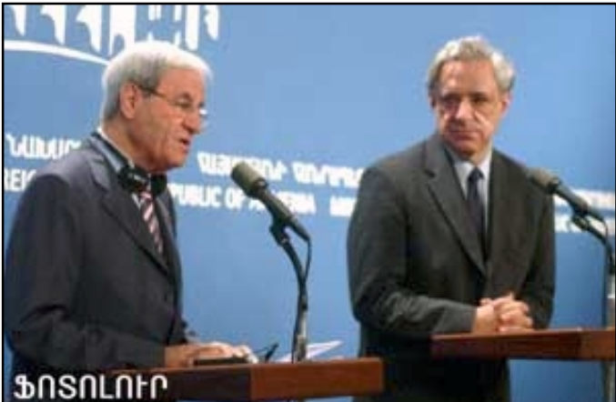
Լիբանանի եւ Հայաստանի Արտաքին Գործոց նախարարները կը պատասխանեն լրագրողներու հարցերուն

Ե Ր Ե Ի Ա Ն , «ԼՐԱԳԻՐ»: Յուլիսի 11-ին Հայաստանի արտգործնախարար Վարդան Օսկանեանի եւ Լիբանանի արտգործ եւ սփւււքի նախարար Ֆաուզի Սալուսիի համատեղ ասուլիսի ժամանակ փաստուեց, որ երկու երկրների յարաբերութիւնները բարձր մակարդակի վրայ են, որ սակայն մի քիչ սառել էին Լիբանանում Ռաֆիկ Հարիրիի սպանութեան եւ դրան յաջորդած զարգացումների պատճառով: ՀՀ արտգործնախարար Վարդան Օսկանեանը յոյս յայտնեց, որ Սալուսիի այցով «կը կարողանանք ամէն ինչ ետ դնել իրենց նորմալ հունի մէջ եւ փորձել հնարաւորինս շուտ կազմակերպել միջկառավարական յանձնաժողովի հանդիպումը»: Վարդան Օսկանեանը Լիբանանի արտգործնախարարին պատմել է զարաբաղեան հակամարտութեան ներկայի վերջին զարգացումների եւ տարածաշրջանային խնդիրների մասին: Սալուսիին էլ իր հերթին Հայաստանի արտգործնախարարին է պատմել Լիբանանում ընթացող