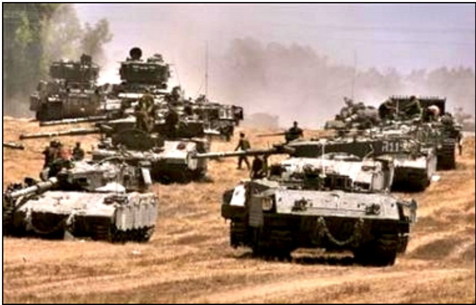
Իսրայէլեան բանակի հրասայերը կը մերիտու ժէն դէպի Կազա

Միջագոյնի ահաբեկչութեան դէմ պայքարի այս թէժ օրերուն, ո՞վ կրնայ կամ պէտք է միջամտէ արաբ-իսրայէլեան այս նոր գարգացումը գապելու համար: Ուսամա Պըն Լատընի մարդիկը դարանակալ կը սպասեն աշխարհի գրեթէ բոլոր անկիւններուն մէջ, իրենց ահաբեկչական գործողութիւնները կատարելու: Ինտոնզիան, Անգլիան, Սպանիան, թերեւս նոյնիսկ Ռուսաստան, ահաբեկչական գործողութիւնները բոլորին մտքերուն մէջ են: Պալիի, Լոնտոնի, Մատրիտի ահաբեկչական գործողութիւններու շարքին կարելի է թուել նաեւ, Իրաքի մէջ պատահած, ուսու հինգ դիւանագէտներու սպանութիւնը, որուն, իբրեւ արդիւնք, Փութինի Ռուսաստանն ալ պարտադրաբար կը մտնէ ահաբեկչութեան թատերաբեմէն ներս: Ուրեմն, հարցումը կը մնայ: Պաղ պատերազմի տարիներուն, երկու գերտէրութիւնները կրնային իրենց ենթակալ ուժերու վրայ ազդեցութիւն բանեցնել: Ներկայիս, հրապարակի վրայ գոյութիւն ունի մէկ գերգոր պետութիւն, Ամերիկայի Միացեալ Նահանգները, որ կարող է միջնորդի