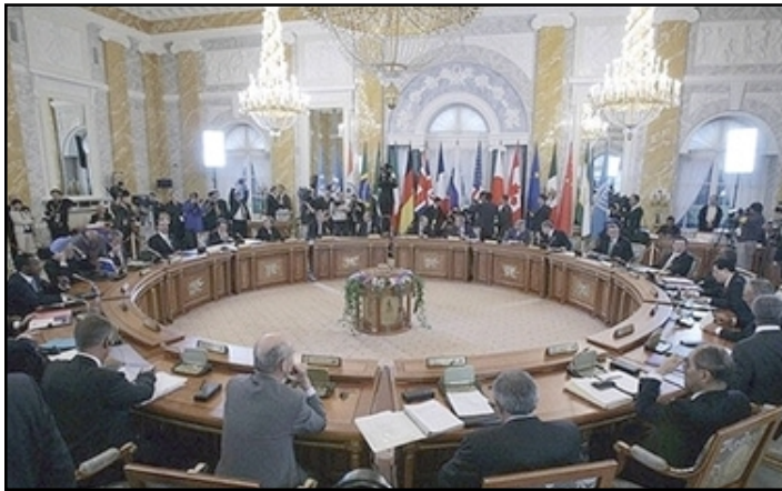
Closing Meeting of G8 Summit

ST. PETERSBURG -- The leaders of the Group of Eight (G8) wealthiest nations on Monday threw their weight behind international efforts to resolve the Nagorno-Karabakh conflict and urged Armenia and Azerbaijan to cut a framework peace deal this year.