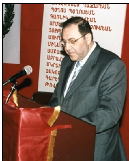
Ընկ. Տօքթ. Թորոս Թուխմանեան

Կախաղան բարձրացուած Քսան Յեղափոխականները միայն իրենց պատկանած կուսակցութեան համար չէ որ նահատակուեցան, այլ համայն հայութեան ազգային ու ընկերային ազատագրութեան ի խնդիր: Ժիշդ է որ 1915 Յունիս 15ի վաղ առաւօտեան կախաղանի ցողափայտերուն վրայ մարտիրոկսացողները բացառապէս Հնչակեան կուսակցութեան առաջնորդներ էին, սակայն Օսմանեան զինուորական գերագոյն դատարանի կողմէ անոնց դէմ արձակուած վճիռի բովանդակութիւնը «Անկախ Հայաստանի մը ստեղծման համար գործողութիւն տանին էր», եւ սա մեծագոյն փաստերէն մէկն է որ անոնք Հայոց ազգային ազատագրական պայքարի պատմութեան մէջ նուիրուեցան ամբողջ ժողովուրդին: Քսանները տոկական մարդիկ չէին անոնք Ազգային Հերոսներ կոչուելու արժանաւորներ են որովհետեւ միայն Հնչակեանութեան յաղթանակին համար չմարտնչեցան, այլ զոհուեցան Հայրենիքի ազատութեան համար, գոհուեցան հայ ժողովուրդի ազատ անկախ ինքնիշխան սպրելու իրաւունքի պաշտպանութեան ի խնդիր, անոնք ժողովուրդը չառաջնորդեցին հատուածական նեղ