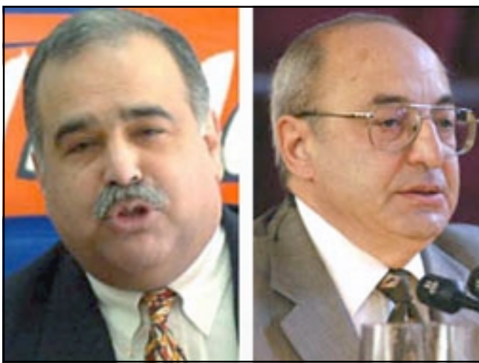
Raffi Hovannisian and Vazgen Manukian

Khachatrian said the purpose of the movement is to "form and reinforce a civic base" that will allow for the protection of human and civil rights, judicial independence, freedom of speech and other ingredients of democracy. "The idea is to make courts as independent as possible by means of public pressure, to