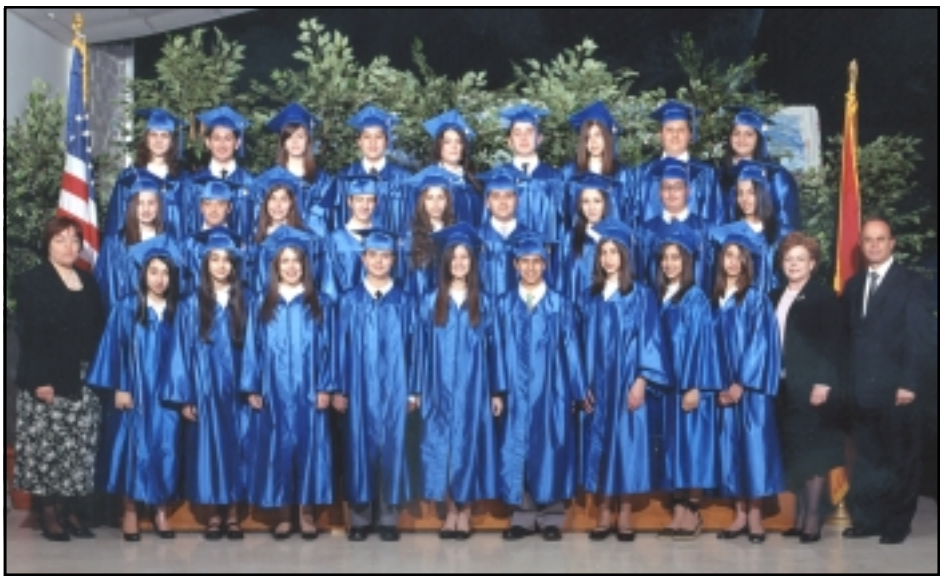
Միջնակարգի 8-րդ կարգի շրջանաւարտները

Մանկապարտէզի հանդէսը տեղի ունեցաւ Յունիս 17ին, դպրոցի սրահին մէջ: Ոսկեղէն համարներով ու երգերով ելոյթ ունեցան շրջանաւարտ 30 փոքրիկները: Տնօրին հակիրճ խօսքէն ետք, կարմիր բա-