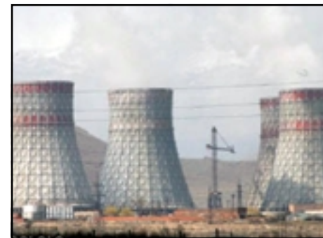
Metsamor nuclear power station

Markosian also downplayed the accident's implications for the plant's safety, saying that it is the first emergency of its kind registered in the last three years. Metsamor's Soviet-designed light-water reactor was most recently brought to a halt and promptly reactivated