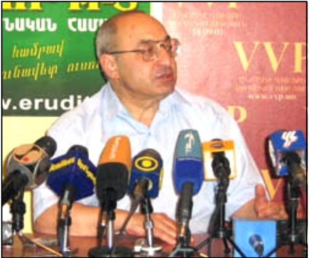
Վազգէն Մանուկեան ասուլիսի ընթացքին

ԵՐԵՒԱՆ, «ԼՐԱ-ԳԻՐ»: Խնդիրը բոլորովին այն է, թէ պաշտպանութեան նախարարը պէտք է լինի կուսակցական, թէ ոչ: Եւ ոչ էլ խնդիրն այն է, թէ ինչպէս պէտք է քուէարկի բանակը: Բանակը միշտ էլ քուէարկել է վերելի հրահանգով: Յուլիսի 18-ին Փաստարկ ակումբում անդրադառնալով Սերժ Սարգսեանի հանրապետականացմանը այդ տեսակէտները հնչեցրեց ԱժՄ նախագահ Վազգէն Մանուկեանը: Նրա կարծիքով, խնդիրը պետութեան ապագայի համար շատ աւելի խորն է ու ընդգրկուն: