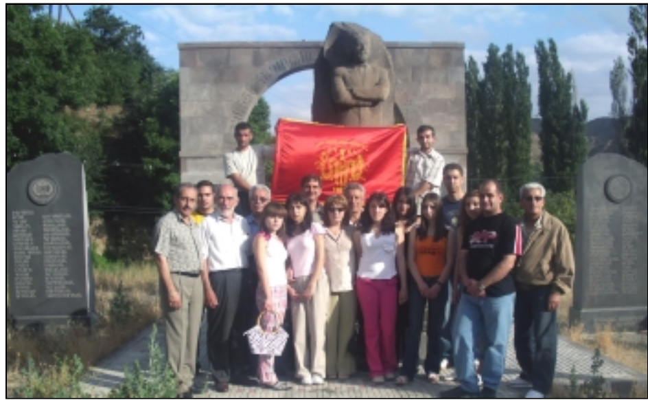
Խումբ մը ճնշակեաններ Մեղրիի Փարամագի յուշարձանի շուրջ

Քսանները մեզի թողուցին նաեւ հիանալի աւանդ մը: Երբ ակնարկ մը կը նետենք անոնց ծննդավայրերուն վրայ, կը տեսնենք որ անոնք կու գային Մեղրիէն, Մուշէն, Սամսոնէն, Պիթիւսէն, Արաբկիրէն, Քիլիսիէն, Պոլիսէն, Ակնէն, Խարբերդէն, Չմշկածագէն, Տենիզիլիէն, Կեսարիայէն, Պարտիզակէն, Վանէն, Շապին Գարահիսարէն եւ նոյնիսկ Աղեքսանդրիայէն: Իրենց հայրենիքի ազատագրութեան ու իրենց ազգակիցներուն բարօր կեանքի պայմաններ ապահովելու վեհ գաղափարն էր, որ քով քովի կը բերէր ու կը միացնէր զանազան շրջաններու ծնունդ այս հայրողիները, յանուն այդ միասնական ընդհանուր նպատակի: Հայու