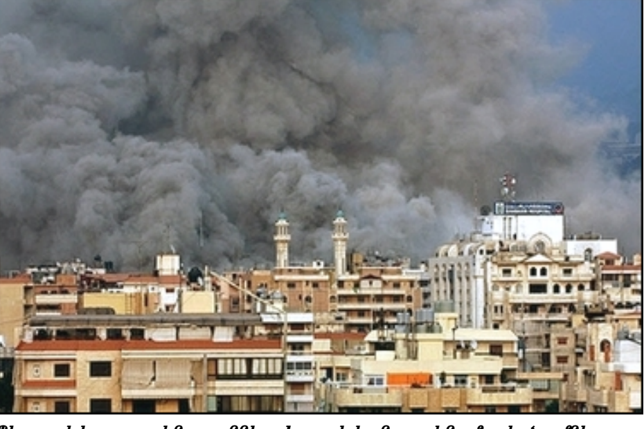
Պէյրութի հարաւային շրջանները Իսրայէլեան օդային ուժերու կողմէն բռնաբարձուած են:

Յուլիս 12-էն սկսեալ Իսրայէլի բանակին կողմէ Լիբանանի դէմ շղթայազերծուած պատերազմին պատճառաւ մեծ դժուարութիւններ կը դիմագրաւեն նաեւ Լիբանան բնակող եւ կամ հոն գտնուող հայու- թիւնը: