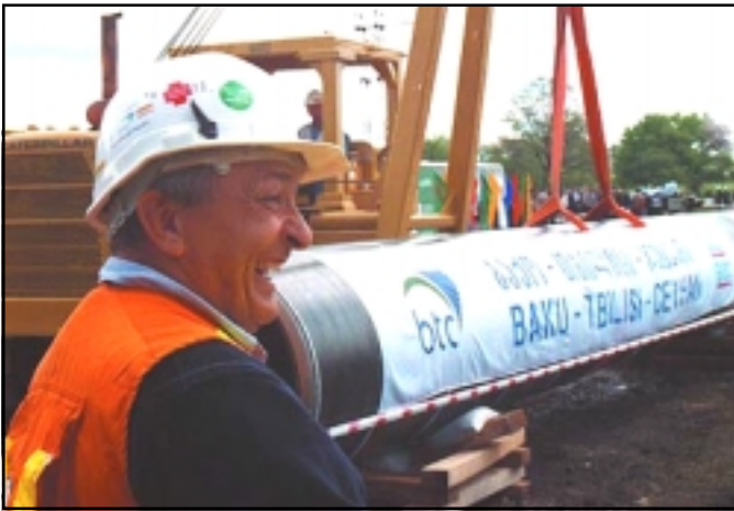
Տեսարան մը Պաքու - Թբիլիսի - Ջէյհան նաւթատարի բացման արարողութեան:

«ԱԶԱՏՈՒ-ԹԻՒՆ ՌԱՏԻՈՅ»: Թուրքիայի Ջէյհան նաւահանգստում տեղի ունեցաւ Պաքու - Թբիլիսի - Ջէյհան նաւթատարի բացման հանդիսաւոր արարողութիւնը, որին ներկայ էին Թուրքիայի, Ատրպէյճանի եւ Վրաստանի բարձրագոյն ղեկավարները, ինչպէս նաեւ նախարարներ 30 երկրներէ: