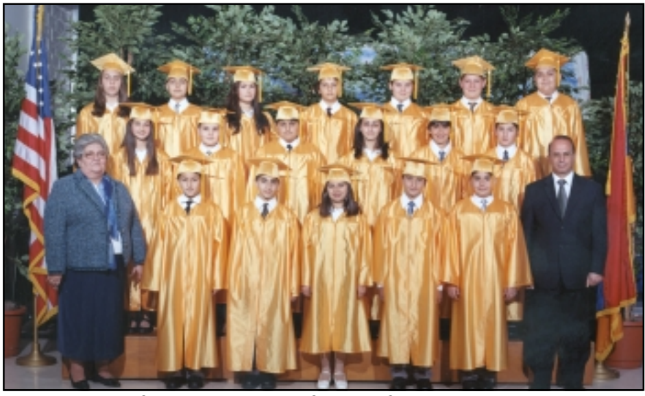
Նախակրթարանի 6-րդ կարգի շրջանաւարտները