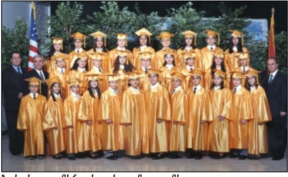
Նախակրթարանի 5-րդ կարգի շրջանաւարտները