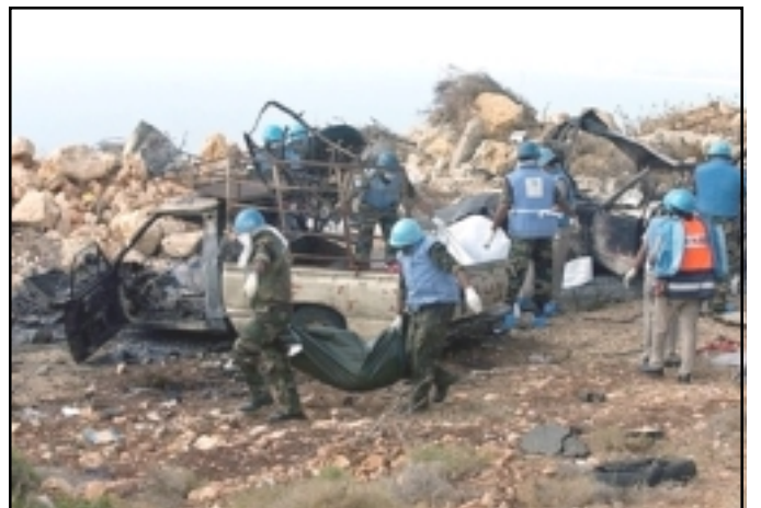
UN Peacekeepers in South Lebanon removing mutilated bodies of innocent civilian victims of Israeli air assault

"The Armenian consulate in Aleppo was directly involved in the effort, accompanying this group of people from the Lebanese border to