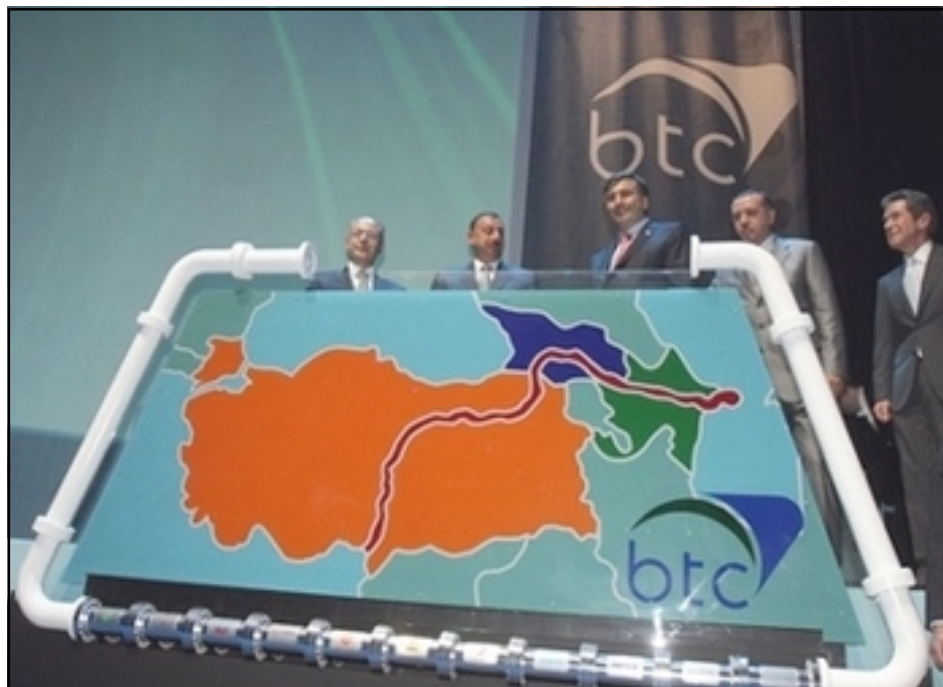
The leaders of Turkey, Azerbaijan, Georgia and British Petroleum Chairman inaugurating the new oil pipeline in front of a map depicting its route. Careful study of the map shows that Armenia's Meghri region is attached to Azerbaijan.

oil through the Caspian Sea in tankers and pouring it into the BTC pipeline. At the initial stage, it is planned to transport 7.5 million tons of Kazakh oil, eventually increasing the volume to 25 million tons. Washington has welcomed the decision of Kazakhstan to join the BTC project.