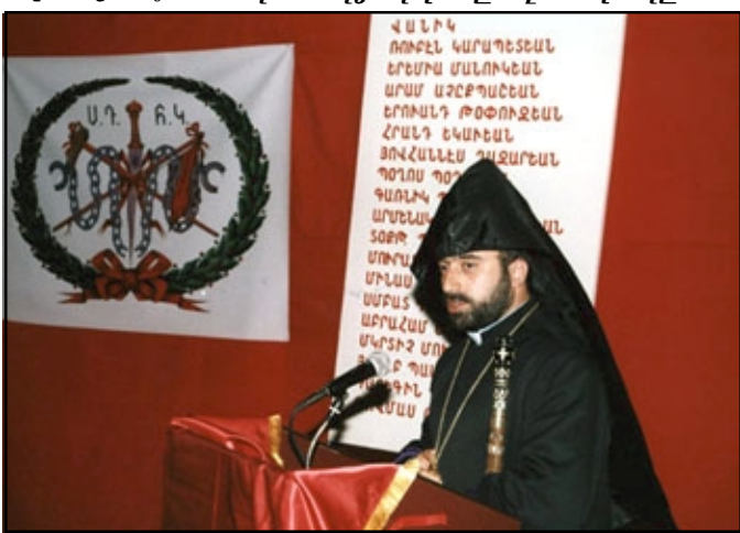
Առաջնորդ՝ Գերշ. Տ. Արմաշ Եպս. Նալպանտեան Եղեռքի պահուի

Յետ հոգեհանգստեան արարողութեան, Հ.Մ.Մ. ակումբէն ներս տեղի ունեցաւ երգման արարողութիւն, որու ընթացքին խումբ մը նորագիրներ ներգրաւուեցան Հնչակեան շարքերէն ներս: