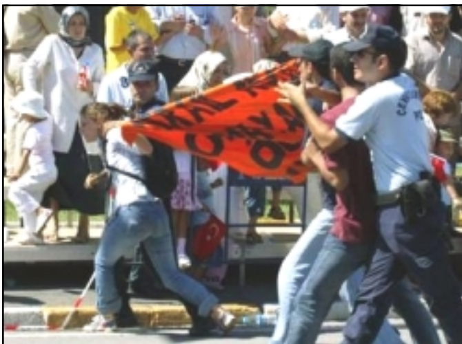
Riot police officers detain protesters holding a banner against Turkey's possible deployment of troops to Lebanon during a military parade marking the 84th anniversary of Victory Day in Istanbul

Turkey ruled Lebanon for about 400 years during the Ottoman Empire and many Turkish officials are keen for their country to have a say in an area that they regard as Turkey's back yard.