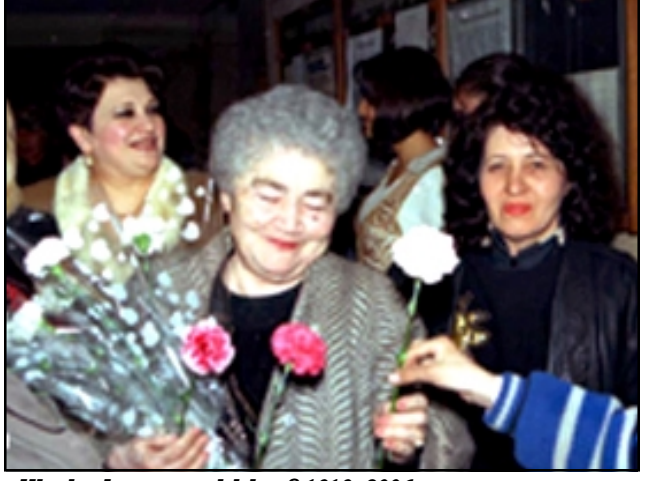
Սիլվա Կապուտիկեան 1919-2006

Երեքշաբթի, Օգոստոս 29-ին հայ հասարակութիւնը վեր- ջին հրաժեշտը տուաւ մեծանուն հայ բա- նաստեղծուհի Սիլվա Կապուտիկեանին, որ վախճանեցաւ Օգոստոս 24-ին Երեւանի մէջ, 87 տարեկան հասակին: