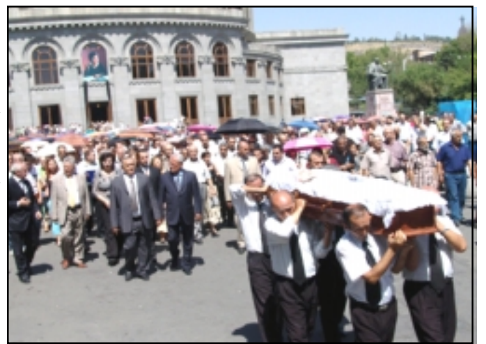
Silva Kaputikian's funeral procession leaving the Opera House

Following the events of April 13, 2004, when Kocharian regime used violence against peaceful protestors in Baghramian Avenue, Kaputikian returned the Mesrop Mashtots Order she