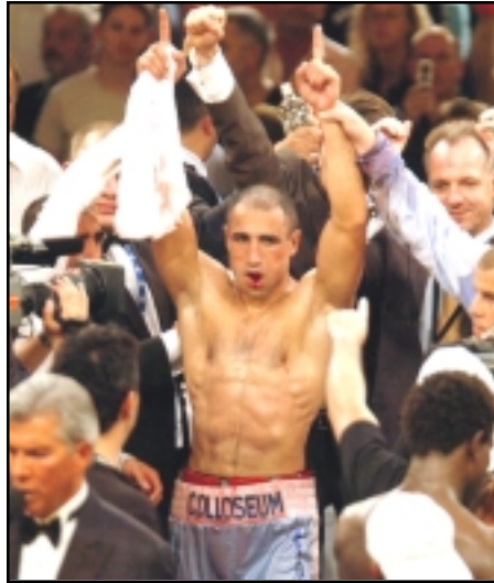
Արթուր Աբրահամը երբեք չէր հիշուր յաղթանակը

Հայ պրոֆեսիոնալ բռնցքամարտիկ Արթուր Աբրահամը 2006թ. ընթացքին 3-րդ անգամ ըլլալով պահպանեց IBF-ի վարկածով միջին քաշային կարգի մէջ աշխարհի ախոյ՛եանի կոչումը: Այս անգամ Արթուրը պարտութեան մասին Գոլոմպի-իցի Միլանդային: