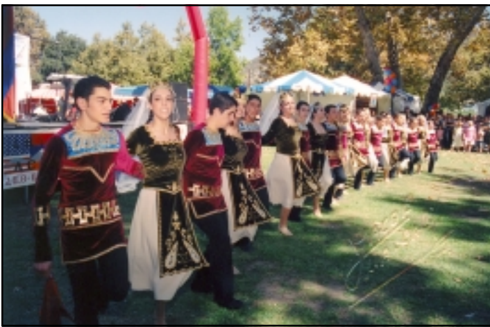
«Լիլիա» պարային համոյթը