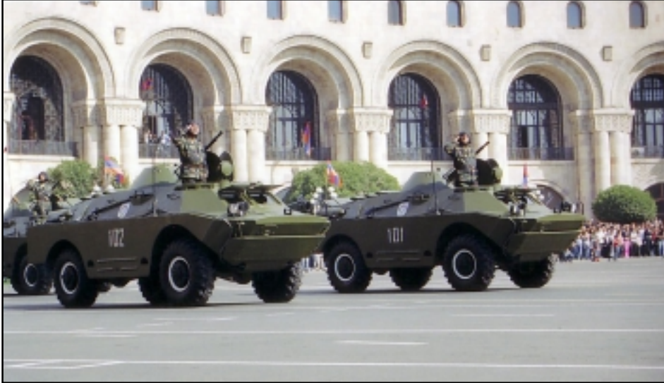
Armenian army displaying its military might during Independence Day parade

YEREVAN -- Armenia put on the biggest show of its military might in seven years Thursday as it marked the 15th anniversary of its declaration of independence from the Soviet Union and received congratulations from U.S. President George W. Bush and other world leaders.