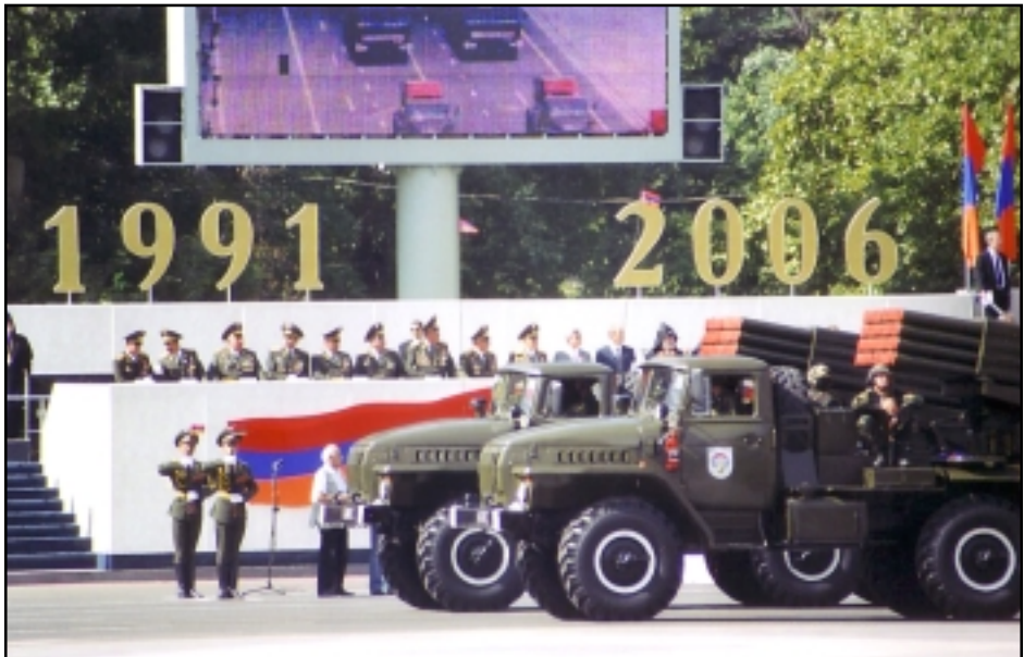
Լուսինի Մարգարեանի եւ Գալիք ԵՃՖԵՆՃԵԱՆԻ

Հայաստանի բանակի զրահամեքենաները կը տողանցեն Հանրապետութեան հրապարակի վրայ