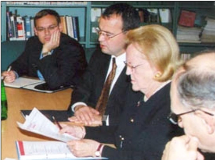
ԵԱՀԿ-ի մօտ Միացեալ Նահանգներու դեսպան Ճուլիա Ֆինլի ելոյթ կ'ունենայ Երեւանի մէջ

Դեսպան Ֆինլիի կարծիքով, շատ կարեւոր է թէ կարճաժամկէտ, թէ երկարաժամկէտ դիտորդական առաքելութեան իրականացումը Հայաստանի խորհրդարանական ընտրութիւններու ամբողջ ընթացքին: «Մենք կը քաջալերենք կառավարութեան, որպէսզի հրաւիրեն ԵԱՀԿ-ի դիտորդներուն եւ երկարաժամկէտ, եւ կարճաժամկէտ առաքելութիւն իրականացնելու համար», - ըսաւ ան, աւելցնելով, որ ատոր համար անհրա-