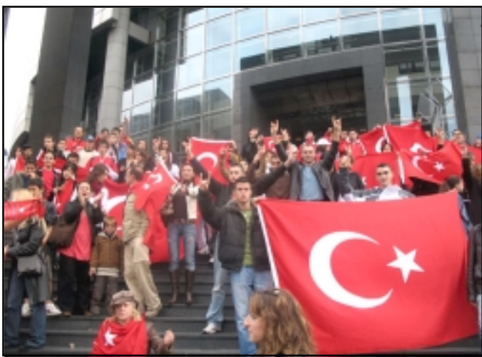
Turkish demonstrators on the “Place de la Bastille”