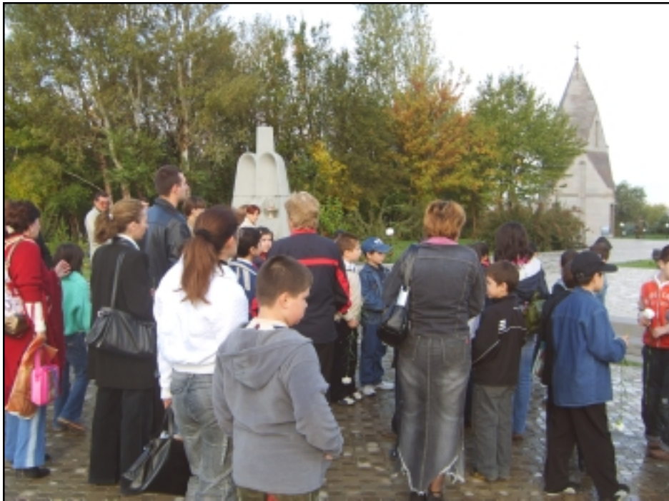
Հնչակեան երիտասարդներու ընկերակցութեամբ պատանի ուսանողները կ'այցելեն Երեւանը

Ա.Դ. Հնչակեան կուսակցութեան Երեւանի նորակազմ «Սարգիս Տերունի» ուսանողական-երիտասարդական միութիւնը կը շարունակէ ծաւալել աշխուժ գործունէութիւն: Երիտասարդական հարցերու նուիրուած սեմինար, երախտագիտութեան ցոյց Ֆրանսայի դեսպանատան առջեւ, թրքական արտադրութեան ապրանքները պոչթոթելու կոչ, Պատմութեան թանգարանի տարածքի մաքրութեան աշխատանքներ, անցնող մէկ ամսուայ ընթացքին հայաստանեան մամուլը լայնօրէն անդրադարձաւ այս բոլորին: Միութիւնը այժմ լծուած է