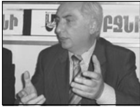
Հայաստանի դեմկրատի դեկավար Արամ Գասպարի Սարգսեան

ԵՐԵՎԱՆ, «ԼՐԱԳԻՐ»։ «Ընդ- դիմութիւնը չի կարող միատարր լինել, ինչպէս եւ իշխանութիւնը: Ձեր աչքի առաջ իշխանութեան ներսում կատարուում են եւ կատարուեցին շատ լուրջ վերադասաւորումներ, մեղմ ասած: Ու դեռ շարունակուելու են», կարծում է Հայաստանի դեմկրատի դեկավար Արամ Գասպարի Սարգսեանը, ով Հոկտեմբերի 21-ին եղել է Ազգակալութեան անմիատարրութեան խորացման շարունակականութեան մասին կանխատեսումով հանդերձ, Արամ Սարգսեանն առաւելապէս խօսել է ընդդիմութեան դաշտում հնարաւոր գարգացումների մասին: