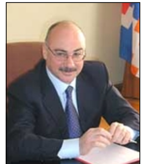
NKR President Arkady Ghoukasian