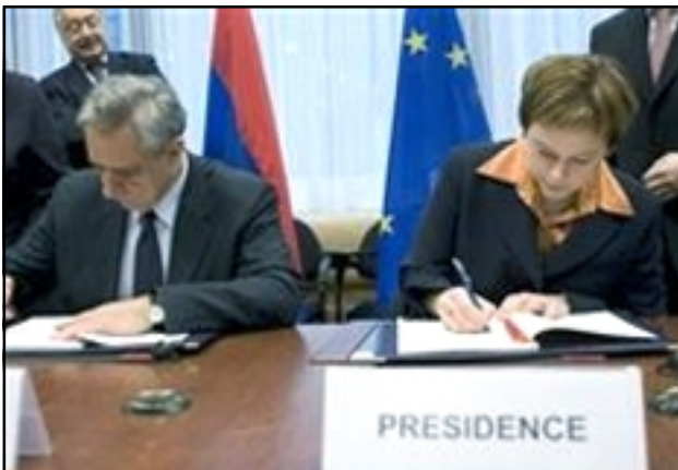
Armenian Foreign Minister Vartan Oskanian (left) and Finnish Development Minister Paula Lehtomaki sign the EU-Armenia cooperation agreement

Under the agreements, the EU offers economic help and help in reforming the justice, energy, education, health and other sectors.