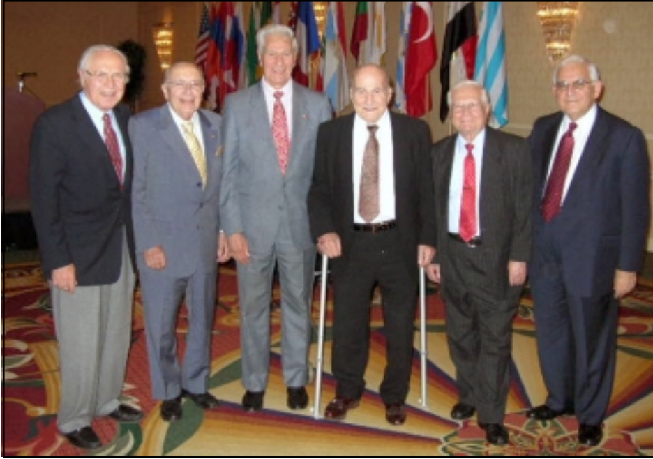
AMAA honored six living past presidents

The Armenian Missionary Association of America (AMAA) held its 87th Annual Meeting this year at its headquarters in Paramus, NJ. Over 100 delegates, members, and friends from around the world gathered in New Jersey October 13-15, 2006 to participate in the meeting and related activities. This year's events coincided with the 160th anniversary of the Armenian Evangelical church.