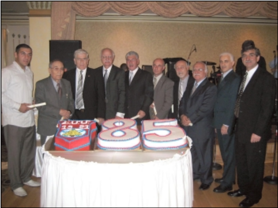
85-ամեակի կարկանդակի հատու մէն պահ մը

Որ ան, իրեն վստահուած նորահաս սերունդները դաստիարակած էր ֆիզիքապէս, բարոյապէս եւ գաղափարապէս, անոնց մէջ մշակելով «առողջ մարմին», ու-