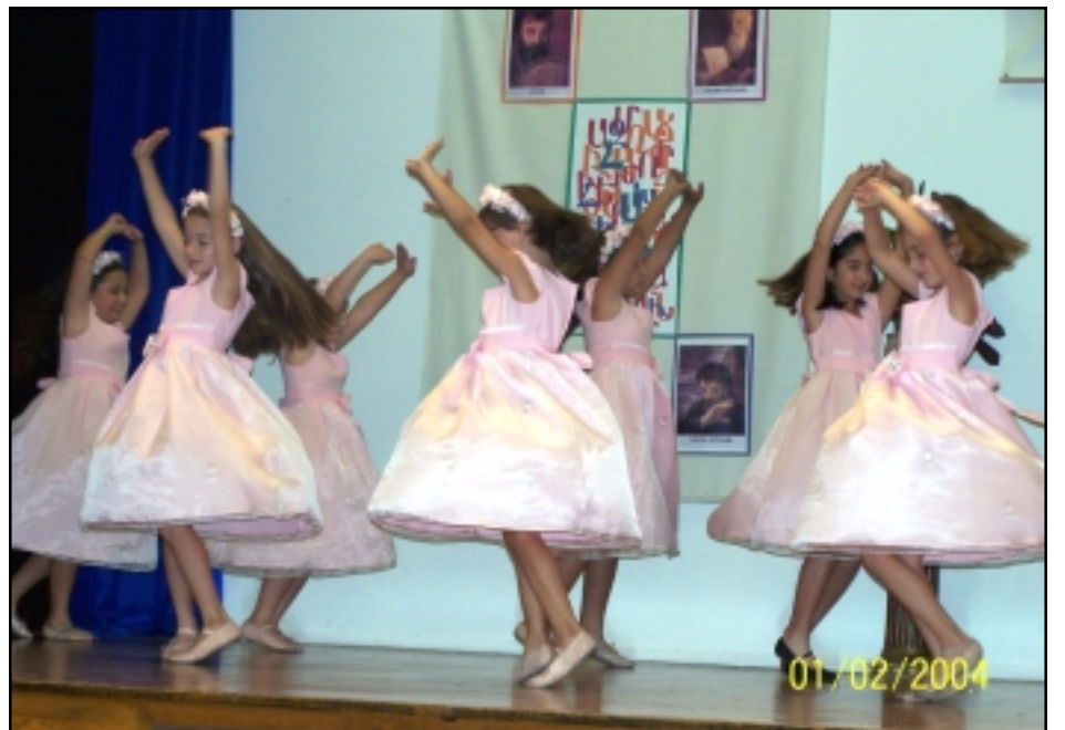
Հայ Քոյրերու Վարժարանի Պարախումբը կը ներկայացնէ հայկական պարեր