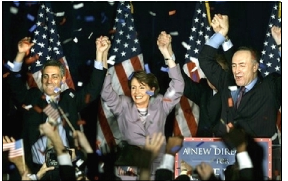
Դեմոկրատ կուսակցութեան ղեկավարները կը տօնեն իրենց յաղթանակը