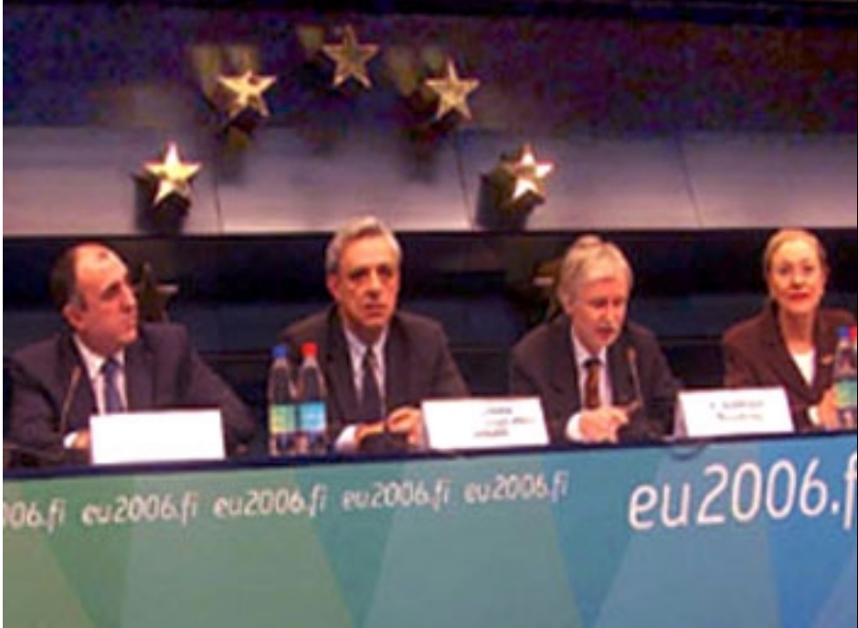
Պրիւսէլի մէջ մամոյսաուլիս կու տան Հայաստանի, Ատրպէյճանի եւ Վրաստանի Արտաքին Գործոց նախարարները

Նոյեմբեր 14-ին Հայաստանի Արտաքին Գործոց նախարար Վարդան Օսկանեան Պրիւսէլի մէջ իր ատրպէյճանցի պաշտօնակից էլմար Մամետեարովի հետ հանդիպում ունենալէ ետք «Ազատութիւն» ռատիոկայանին յայտնած է, որ ԵԱԿ Միւսկի խումբի համա-նախագահները տարածաշրջան կա-