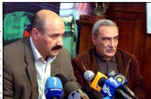
"Brotherhood of Liberation Struggle": Karabakh not for sale