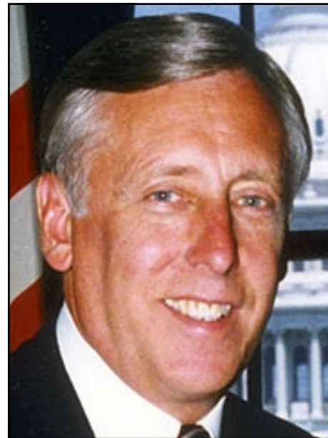
New Majority Leader Rep. Steny Hoyer

tion as Whip. The lawmakers are not cosponsors of H. Res. 316 or H. R. 3361, a bill that would bar assistance for a railroad bypass of Armenia. However, Armenian Caucus Member Rep. Thaddeus McCotter (R-MI), a cosponsor of the Genocide resolution and rail