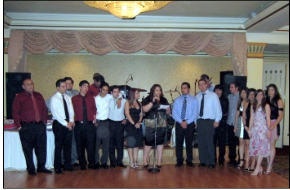
ՀՄՄ-ի երիտասարդ անդամները

տինայի եւ Կլէնտէյլի Վարչութեանց պատասխանատուներ, քոյր կազմակերպութեանց ներկայացուցիչներ, վեթերան մարզիկներ, անդամներ եւ համակիրներու հոծ բազմութիւն մը: