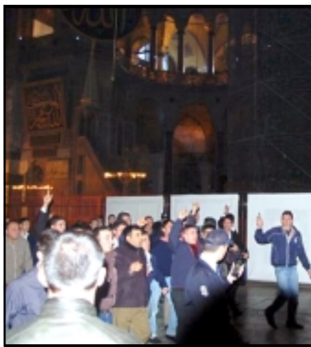
Turkish protesters chant Islamic slogans at the Hagia Sophia museum in Istanbul

When the protesters refused to surrender, a policeman used pepper spray on them. Police later rounded up