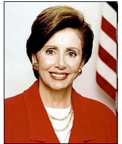
New House Speaker Nancy Pelosi

On the Republican side, Ohio Congressman John Boehner was elected Minority Leader, while Congressman Roy Blunt (R-MO) will keep his posi-