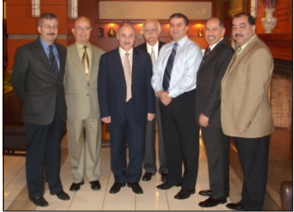
Նախագահ Արկաղի Ղուկասեան (կեդրոնը) շրջապատուած Ս.Դ.Հ.Կ. Վարիչ Մարմնի անդամներով

Անցեալ Չորեքշաբթի երեկոցեան Ս.Դ. Հնչակեան Կուսակցութեան Արեւմտեան Ամերիկայի Վարիչ Մարմնի պատուիրակութիւնը հանդիպում մը ունեցաւ Լեւոնային Ղարաբաղի Հանրապետութեան նախագահ Տիգր. Արկաղի Ղուկասեանի հետ, որ Լոս Անճելէս ժամանած էր մասնակցելու «Հայաստան» Հիմ-