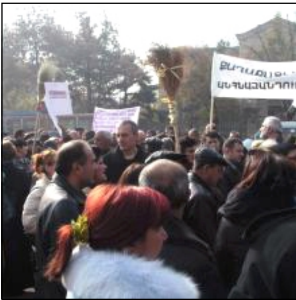
Ցուցարարները Խորհրդարանի շենքի մոտ

«ԱԶԱՏՈՒԹԻՒՆ ՌԱՏԻՈՅ»։ Երկուշաբթի, Նոյեմբեր 27-ին Հայաստանի Ազգային ժողովը արտահերթ նիստում երրորդ և վերջնական ընթերցմամբ հաստատեց «Հասարակութեան և պետութեան կարիքների համար սեփականությունն օտարման մասին» օրինքի նախագիծը: