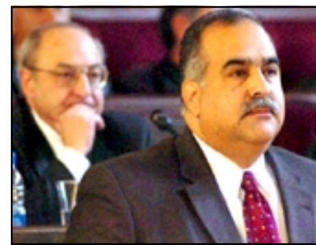
Raffi Hovannisian and Vazgen Manukian