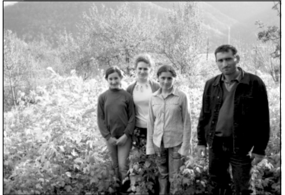
The Karapetyan Family with their thriving backyard micro-enterprise nursery in the village of AYGUT

Armenia Tree Project (ATP) has joined the worldwide tree planting campaign launched by the United Nations Environment Programme (UNEP).