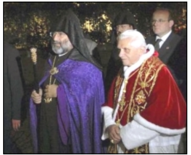
Բենեդիկտոս 16-րդ Պապը եւ Պոլսոյ Հայոց Պատրիարք Մեսրոպ Մուրաֆեան

«ԱԶԱՏՈՒԹԻՒՆ ՌԱՏԻՈՅ»: Հինգշաբթի, Նոյեմբեր 30-ին Հռոմի Բենեդիկտոս 16-րդ Պապը այցելել է Պոլսոյ Հայոց Պատրիարքարան, որտեղ մօտ մէկ ժամ է անցկացրել: