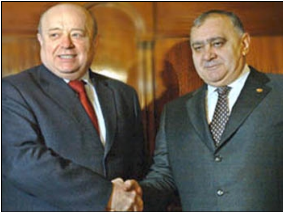
Հայաստանի եւ Ռուսաստանի վարչապետներ՝ Անդրանիկ Մարգարեան եւ Միխայիլ Ֆրադկով Մոսկուայի հանդիպման ընթացքին

«ԱԶԱՏՈՒԹԻՒՆ ՌԱՏԻՈՅ»: Ուրբաթ, Դեկտեմբեր 1-ին Ռուսաստանի մայրաքաղաքում տեղի է ունեցել Հայաստանի եւ Ռուսաստանի կառավարութիւնների ղեկավարների՝ Անդրանիկ Մարգարեանի եւ Միխայիլ Ֆրադկովի գլխավորած պատուիրակութիւնների հանդիպումը, որի ընթացքում քննարկուել է երկկողմ համագործակցութեանը վերաբերող խնդիրների լայն շրջանակ: