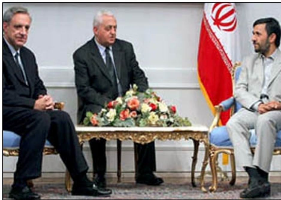
Մահմադ Ահմեդիմեթադ եւ Վարդան Օսկանեան հանդիպում կ'ունենան Թեհրանի մէջ. կեդրոնը նստած է թարգմանիչ

Հայաստանի արտգործնախարար Վարդան Օսկանեանը շաբաթավերջին Թեհրանում հանդիպումներ է ունեցել Իրանի ղեկավարների հետ՝ քննարկելով երկկողմ յարաբերութիւններին, էներգետիկային, տարածաշրջանային անվտանգութեանը վերաբերող խնդիրների լայն շրջանակ: