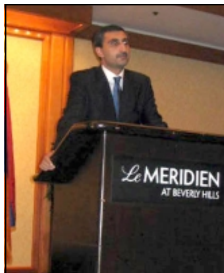
Հ.Հ. Աւագ Հիւպատոս Արմէն Լիլոյեան մթնոլորտ: Ներկաներուն անձամբ դիմաւորեց նորանշանակ երիտա-

Երկուշաբթի Դեկտեմբեր 18ի երեկոյեան, Պէվրըլի Հիլզի Le Meridien հիւրանոցին մէջ շաբաթ ընդունելութեամբ մը նշուեցաւ Հայաստանի անկախութեան 15-ամեակն ու Լոս Անճելոսի մօտ Հ.Հ. Աւագ Հիւպատոս Տիար Արմէն Լիլոյեանի նոր պաշտօնի կոչուիլը: Այս բարեբաստիկ գոյգ առիթները միասնաբար նշելու եկած էին գաղութիա երեք յարանուանութեանց հոգեւոր առաջնորդները, Ս. Դ. Հնչակեան Կուսակցութեան Կեդրոնական վարչութեան եւ Արեւմտեան Ամերիկայի վարիչ Մարմնի անդամներ, ինչպէս նաեւ քաղաքական, մարզական, մշակութային, բարեսիրական կազմակերպութիւններու եւ մամուլի ներկայացուցիչներ, օտար դիւանագէտներ, պետական ու քաղաքային անձնաւորութիւններ: Գեղազարդ սրահէն ներս կը տիրապետէր տօնական ուրախ