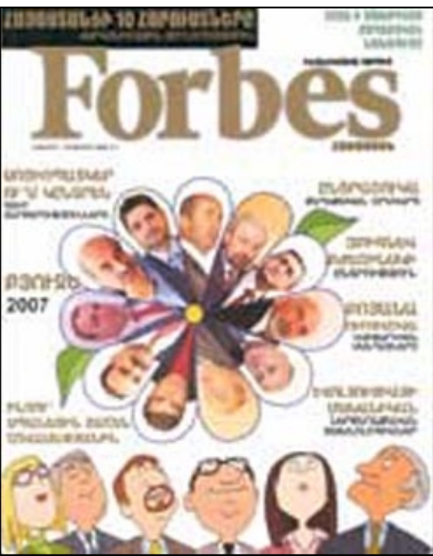
FORBES ամսագրի հայալեզու տարբերակի առաջին համարը

ԵՐԵՎԱՆ, «ԼՐԱ-ԳԻՐ»: FORBES ամսագրի հայալեզու տարբերակի առաջին համարում տպագրվել է Հայաստանի հարուստների տասնեակը: 10 հարուստների մէջ ընդամէնը 4 կուսակցական կաշ, որոնցից 2-ը՝ հանրապետական: Այն էլ՝ ինչ հանրապետական: 6-րդ տեղում հանրապետականի խորհրդի անդամ Երուսնդ Ջախարեանն է, 8-րդը՝ խորհրդի նախագահ ու էլի 5 պաշտօն զբաղեցնող Սերժ Սարգսեանը: Իհարկէ, կարելի է այս երկու հանրապետականներին գումարել նաև կուսակցական պատկանելութեամբ ոչ հանրապետական, սակայն հանրապետական «ախպերութեան» ներկայացուցիչների՝ Մաքսային ծառայութեան պետ, ըստ FORBES-ի՝ երկրորդ հարուստ Արմէն Աւետիսեանին, 9-րդ հարուստ, տրանսպորտի նախարար Անդրանիկ Մանուկեանին, Միխայիլ Բաղդասարովին, եւ կը ստացուի, որ 10 ամենահարուստներից 5-ը հանրապետականի հետ կապ ունեն: Բայց սկզբի համար բաւարարուենք պաշտօնական տարբերակներով եւ արձանագրենք, որ առաջին 10 հարուստների մէջ ընդամէնը 4 կուսակցական կաշ, որոնցից 2-ը՝ հանրապետական: