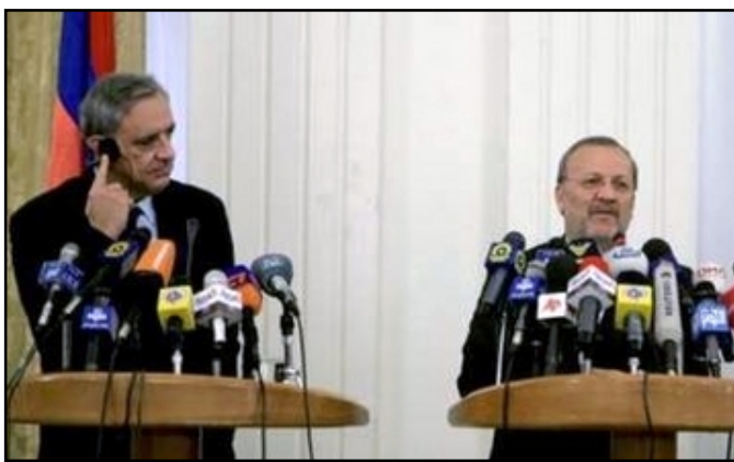
Foreign Ministers Vartan Oskanian and Manouchehr Mottaki during joint news conference in Tehran

Oskanian, according to the Foreign Ministry in Yerevan, stressed the