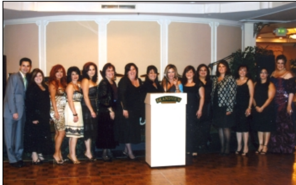
Ծնողա-Ուսուցչական վարչութեան անդամները

Պրէնտիլիու Քըլլէքըշլի շքեղ սրահին մէջ: Ներկայ էին աւելի քան 300 խանդավառ շրջանաւարտներ, ծնողներ, աշակերտներ, ուսուցիչներ, նախկին եւ նոր հոգաբարձուներ, ինչպէս նաեւ Մերտինեան մեծ ընտանիքի անդամներ, բարեկամներ: Ծնողա-Ուսուցչական Մարմնի