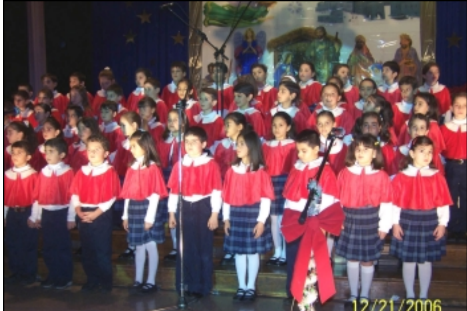
Նախակրթարանի աշակերտները ելոյթի պահուն