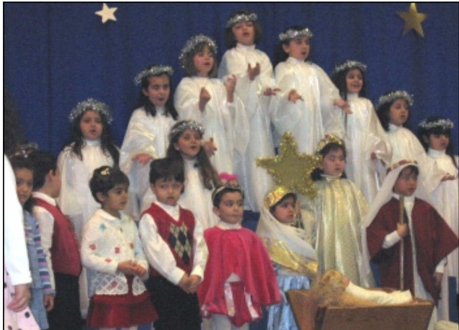
Մանկապարտէզի աշակերտները ելոյթի պահուն

սուսը իր հօր եւ մօր հետ, հովիւներու ներկայութիւնը, մոգերու նուէրներու մատուցումը, Հերովդէսի զայրոյթը եւ այս բոլորը կ'աւարտէր զեղեցիկ երգեցողութեամբ մը, ուր մանկապարտէզը իր բոլոր կարելիութիւններով շարականները կ'երգէր հրեշտակային ձայնով եւ անմեղութեամբ, որը կը