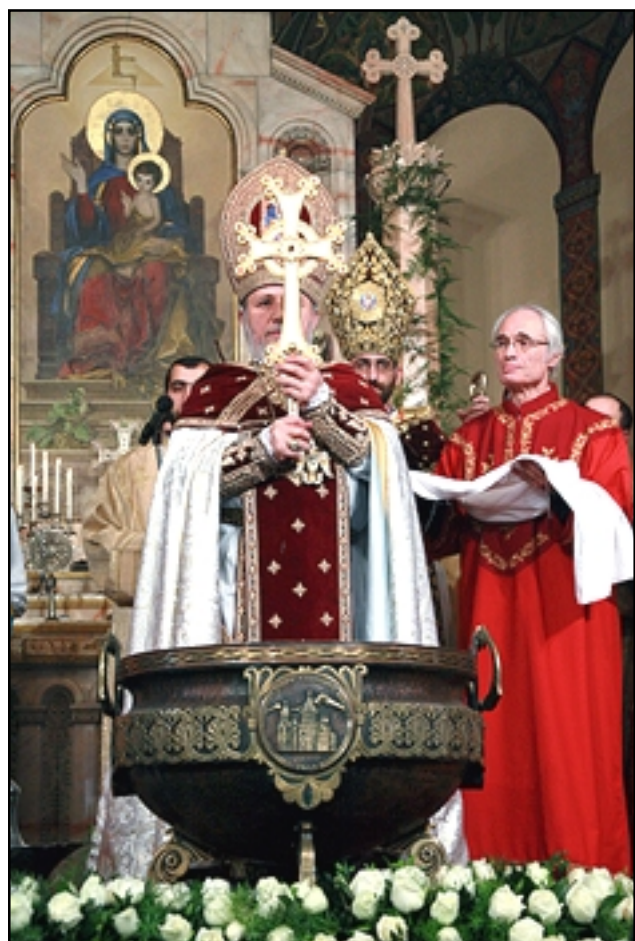
His Holiness Karekin II offering the service of Blessing of the Waters

On the morning of January 6, His Holiness Karekin II celebrated a Pontifical Divine Liturgy in the Cathedral of Holy Etchmiadzin on the occasion of the Holy Nativity and Theophany of Christ. Under the singing of church hymns, the festive procession of deacons, priests and bishops led the Armenian Pontiff to the Mother Cathedral to celebrate Divine