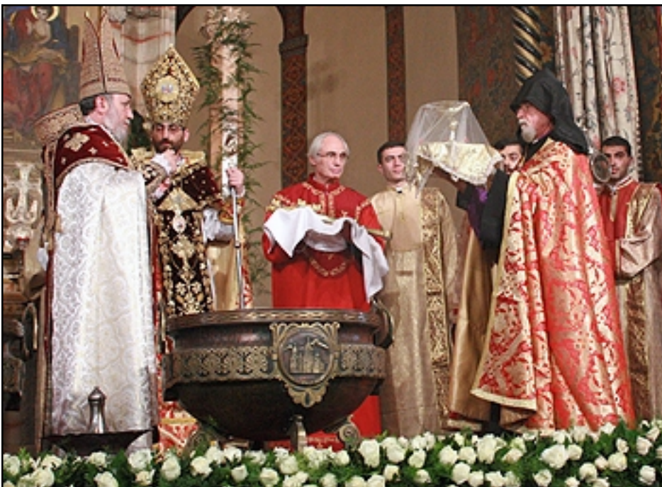
Ս. Էջմիածնի Ս. Ծննդեան արարողութեան տեսարան մը

Յունուար 6-ին աշխարհասփիւռ Հայաստանեայց Առաքելական Սուրբ Եկեղեցին տօնախմբեց Քրիստոսի Սբ. Ծննդեան եւ Աստուածայայտութեան հրաշափառ տօնը: