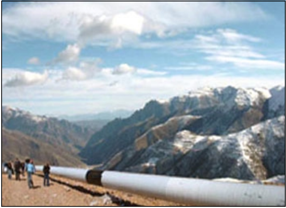
Տեսարան մը Իրան-Հայաստան գազամուղի խողովակներէն

«ԱԶԱՏՈՒԹԻՒՆ ՌԱՏԻՈՅ»: Իրանը պատրաստ է սկսել գազի առաքումը Հայաստան ցանկացած պահի, սակայն Հայաստանը դեռեւս պատրաստ չէ գազը ստանալ, հաղորդում է Iran Daily-ն: