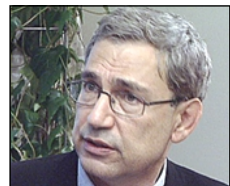
Nobel Prize winner Orhan Pamuk

His cover article quoted a 1951 story about Turkish poet Nazim Hikmet, declared a traitor and imprisoned for his