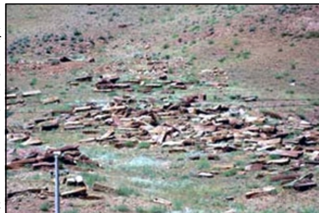
Destruction of monuments in Armenian cemetery of Jugha

atically destroyed the crosses. Photos supporting the claim were shown in Strasbourg, France, and will be moved to a new city every two months.