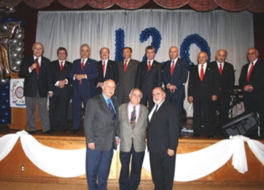
Պոլսահայ Միութեան Կեդրոնական վարժարանի Յանձնախումբի անդամները եւ պատուուած շքանշանաւարտները

նի ջանքերով կը հիմնուի Պոլսոյ Հռչակաւոր Կեդրոնական վարժարանը 1886ին: Հիմնադիրներու միաքէն չէր անցներ, որ 120 տարի ետք, բազմահազար մղոն հեռավորութեան վրայ, Լոս Անճելոս քաղաքին մէջ նոյն վարժարանի նախկին սաները, Պոլսահայ Միութեան Կեդրոնական