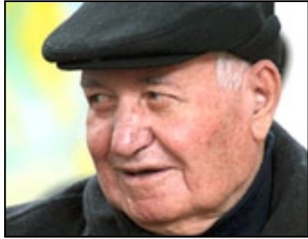
Նախկին յայտնի պետական գործիչ Ալեքսան Կիրակոսեան

«ԱԶԱՏՈՒԹԻՒՆ ՌԱՏԻՈՅ»: Յուճուար 9-ին 88 տարեկան հասակում վախճանուել է Հայաստանի յայտնի պետական գործիչ Ալեքսան Կիրակոսեանը: