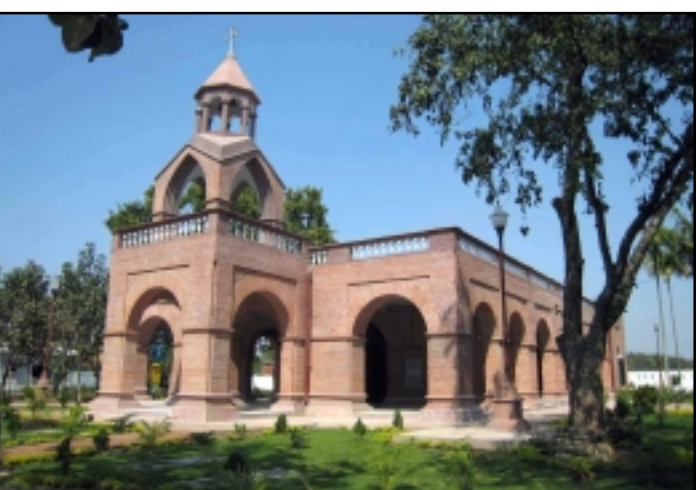
Սայրաքաղի Ա. Մարիամեկեղեցին

Այնուհետեւ կատարուեց հոգեհանգիստ եկեղեցու բակում թաղուած հայորդիների հոգիների խա-