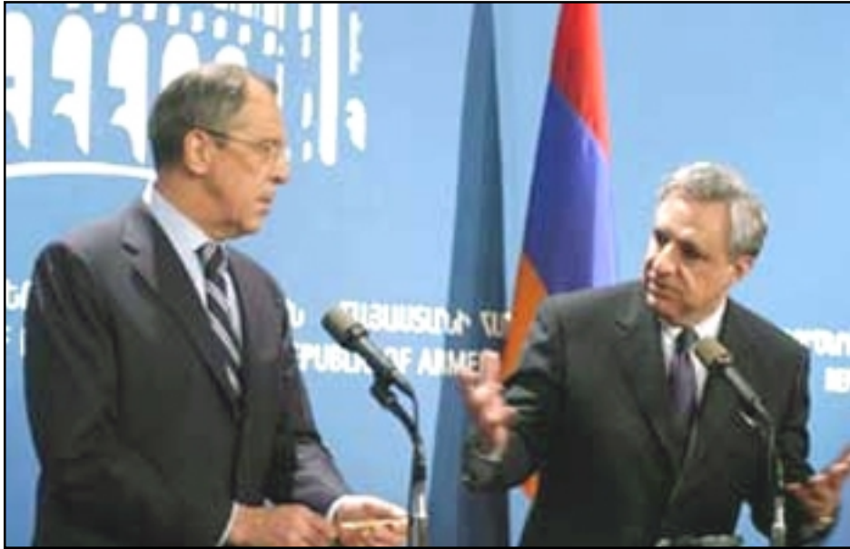
Սերգեյ Լաւրով (ճախիւ) եւ Վարդան Օսկանեան Երեւանի մէջ կայացած մամուլային ընթացքի

ԵՐԵՎԱՆ, «ԱՅԲ-ՖԷ»: «ԼՂ հիմնախնդիրը իր էությունը իսկապես բացառիկ է: Բացառիկ է այն առումով, որ սա եզակի հակամարտութիւն է, որի կարգաւորման նոյնիսկ մանրամասնութիւնների շուրջ համախառն հնչողքը եւ անգամ հակամարտող կողմերի դիրքորոշումը չի հակասում իրար», - Ապրիլ 3-ին Երեւանում յայտարարեց Ռուսաստանի Դաշնութեան Արտաքին Գործոց նախարար Սերգեյ Լաւրովը: