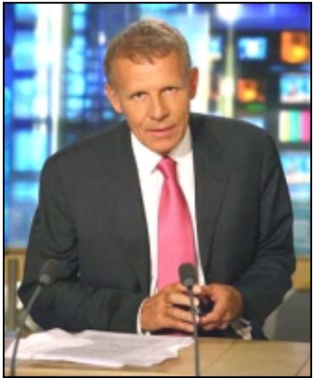
լրագրող Պատրիկ Պուշկովը դ'Արլոր

Պատրիկ Պուշկովը դ'Արլորը Փրանսիացի յայտնի լրագրող է եւ գրող: 1987 թուականից TF1 հեռուստաընկերութեան երեկոյան լրատուութեան գլխաւոր հաղորդավարն է, 1989 թուականից՝ տեղեկատուական տնօրէնը: Նա Ֆրանսիայի ղեկավար շրջանակների «Դար» ակումբի անդամ է: «Ազգի» թղթակից Արմին Ազիզեանին տուած հարցազրույցում նա խօսում է Ֆրանսիայում Հայաստանի տարուայ, լրագրութեան, Հրանտ Տինքի սպանութեան եւ այլ հարցերի մասին: