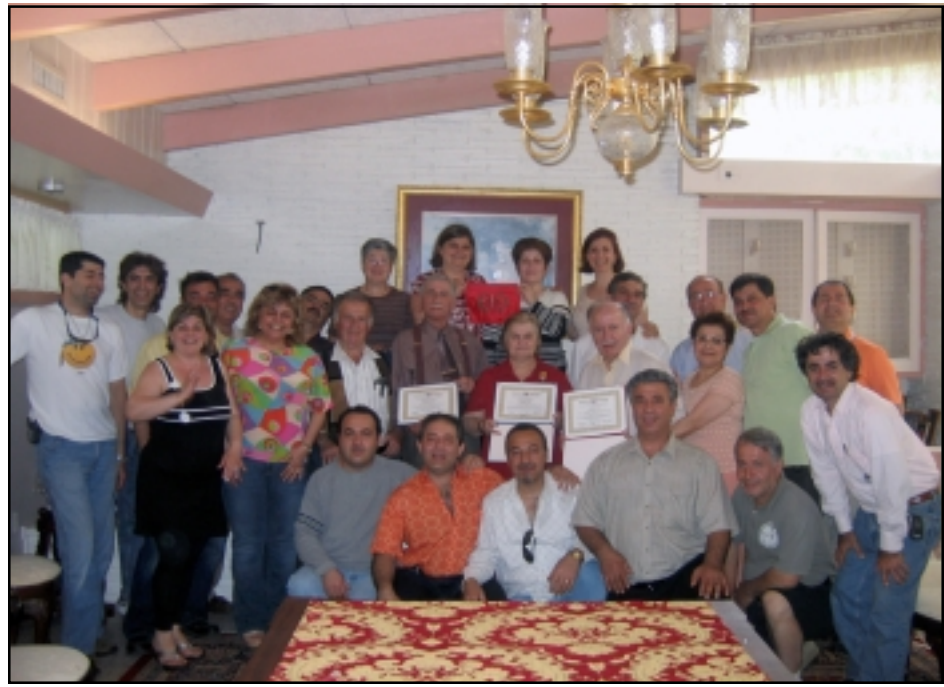
Պաթոն Ռուժ քաղաքի կուսակցական հաւաքի մասնակիցներէն մաս մը

ղը, անցնող տարեշրջանին գաղութէն ներս խիստ օգտաշատ գործունէութիւն ծաւալած է մասնաւորաբար նիւթապէս օգտակար հանդիսացած է եւ վարկեր ապահոված Քաթարինայի աղէտէն վնասներու ենթարկուած մեր հայրենակիցներուն: Այս շրջանին իրականութիւն դարձած է հայութեան երազը եւ ներկայիս գաղութը սեփականատէրն է եկեղեցիի մը ու գաջն անուանած Ս. Կարապետ: Եկեղեցին օժտուած է նաեւ յարակից սրահով մը: Այժմ իրականութիւն դարձած է նաեւ հայկական գերեզմանատուն մը ունենալու գաղափարն ալ եւ եկեղեցւոյ սահմանամերձ հողաշերտ ալ գնելով, յատուկ արտօնագրով գաջն վերածած են գերեզ-