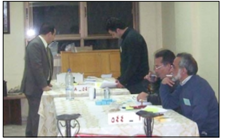
Ընտրողական Քննիչ Ժողովը ձայներու քննութիւնը կը կատարէ:

Դամասկոսի Հայոց Թեմի Առաջնորդութիւնը անհուն ուրախութեամբ կը յայտնէ, թէ կամօքն Աստուծոյ եւ մասնակցութեամբ համայն դամասկահայութեան, Կիրակի, 25 Մարտ 2007ին, Դամասկոսի Հայոց Թեմի Առաջնորդարանին մէջ տեղի ունեցաւ Ազգային Գաւառական Ժողովի (Թեմական Ժողով) լրացուցիչ անդամներու ընտրութիւնը: