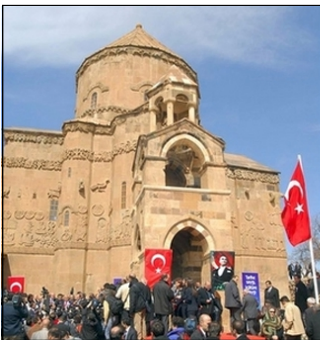
Աղթամարի Սուրբ Խաչ եկեղեցիի մուտքին՝ Աթաբաբի մկարը եւ Թրքական դրօշակներ գետեղուած

Ս.Դ. Հնչակեան Կուսակցութեան երիտասարդական միութիւնը օրեր առաջ հանդէս եկած էր կոչով՝ ուղղուած Հայաստանի կառավարութեան, պոլքութելու Աղթամարի Սուրբ Խաչ եկեղեցուց բացման հանդիսութիւնը: Մարտ 30-ին ՄԴՀԿ «Սարգիս Տիրուհի» Ուսանողական-Երիտասարդական Միութիւնը հրապարակեց երկրորդ յայտարարութիւն մը դատապարտելով եկեղեցուց բացման Հայաստանի պաշտօնական պատուիրակութեան մասնակցութիւնը: