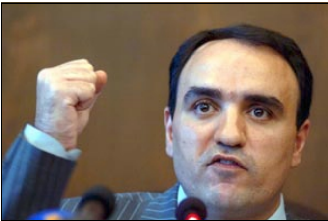
Orinats Yerkir leader Artur Baghdasaryan

Yerevan State University Robert Kocharyan reflected on the tapped conversation between Baghdasaryan and the diplomat.