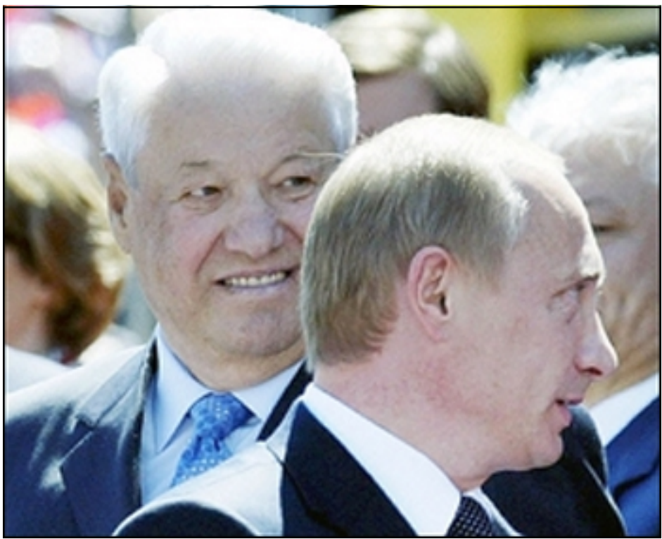
Պորիս Ելցին եւ Վլատիմիր Փութին

1996 Ելցինեան Չրդ շրջանը արդէն իր անկումին սկզբնաւորութիւնն էր: Այդ վայրկեանէն սկսեալ, Փութինի ոստիկանական պետութիւնը ինքզինք պիտի հեշտութեամբ հաստատէր: Իր սկսած տեմոքրատական շարժումը չկրցաւ մնայուն հաստատութիւններ ստեղծել: Աւելի վատ իր անկումը թունաւորեց ռուս ժողովուրդի միտքը քափթիթալիզմի եւ տեմոքրատիայի նկատմամբ: «Օլիկարի»ներու իշխանութիւնը յաղթեց ժողովուրդի տրամադրութեան վրայ, այնքան մը որ դժուար եղաւ գանազանել մէկ կողմէ ազատ ընտրութեանց «բարիք»ներն եւ միւս կողմէ ազատ շուկայական դրութեան միջեւ: Նոր իշխող «ընտրանի» դասը կազմուած էր հին «պիւրոքրաթ»ներէ, եւ նոր «թեքնոքրաթ»ներէ, որոնք լման անտարբեր էին ազատական տեմոքրատիայի արժէքներուն նկատմամբ: