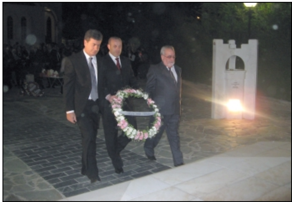
Հայկական երեք կուսակցութիւններու միացեալ ծաղկեպսակի գետեղումը

մասնաւորաբար հայրենի հողի սահմակեցուցիչ կորուստները: Յեղասպանութենէն 92 տարիներ ետք, թրքական իշխանութիւնները ոչ միայն կը շարունակեն ուրանալ, այլ կը խեղաթիւրեն պատմական բացայայտ իրողութիւնները: Հետեւաբար, հայկական քաղաքական երեք կուսակցութիւնները, խորապէս համոզուած որ Հայկական Դատի հետապնդման կապակցութեամբ ոչ մէկ տարբերութիւն գոյութիւն ունի իրենց միջեւ, վերանորոգած են իրենց ուխտը՝ մի-