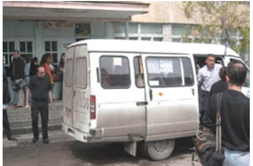
Voters bused to a polling station in Yerevan

Hovannisian claimed that Zharangutyun polled three times more