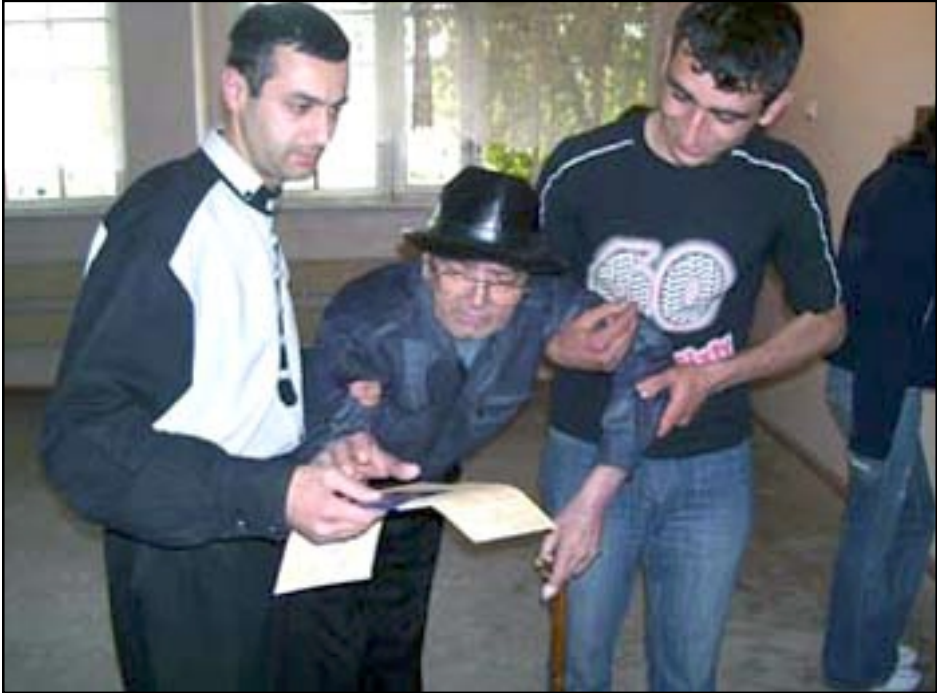
Ո՞վ պիտի ուզէր ամմասն մնալ ազատ, արդար եւ թափանցիկ ընտրութիւններէն...

Մայիս 12-ին տեղի ունեցան Հայաստանի խորհրդարանական ընտրութիւնները: Ամէն ինչ ընթացաւ նախատեսուածին նման: Իշխանական ուժերը գլխաւորութեամբ Հանրապետական կուսակցութեան, օգտագործելով իրենց տրամադրութեան տակ ունեցած պետական բոլոր լծակները, մեծ գումարներ եւ երկրէն բացակայողներու փոխարէն քուէարկութիւնը, յաջողեցան անգամ մը եւս ժողովուրդը զրկել իր ազատ կամքը արտայայտելու իրաւունքէն: