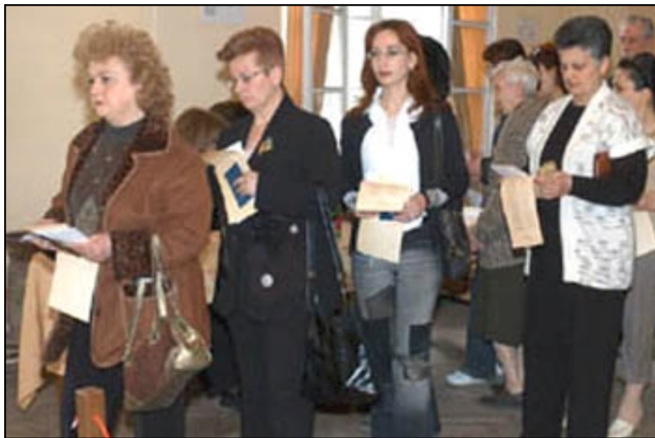
Armenian voters line out to cast their ballots

members of the two main pro-establishment parties. RFE/RL correspondents witnessed two such instances in Yerevan.