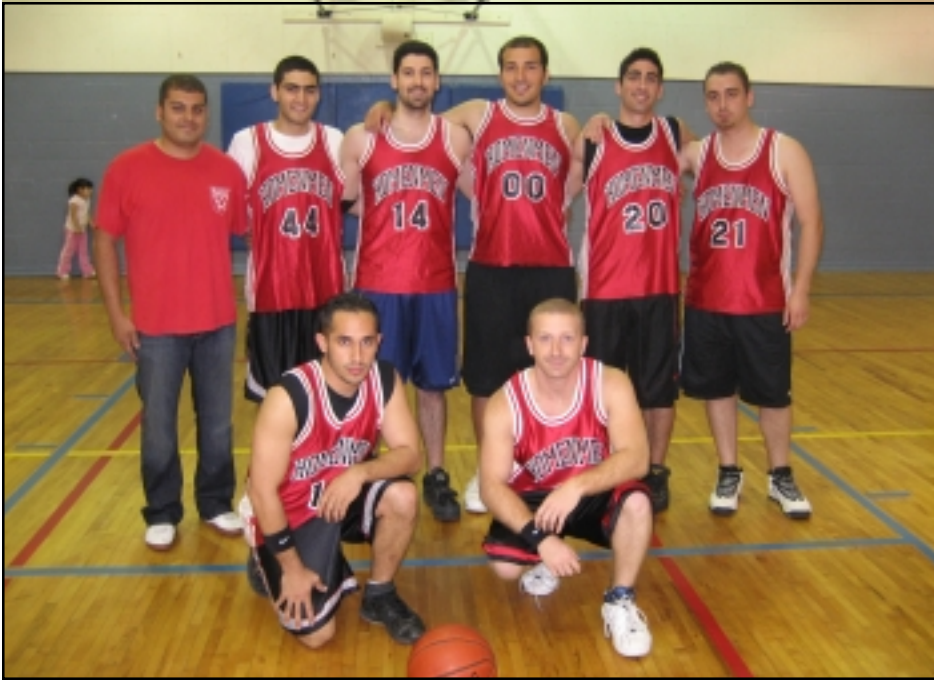
Հ.Մ.Մ. Փասատինայի կազմը