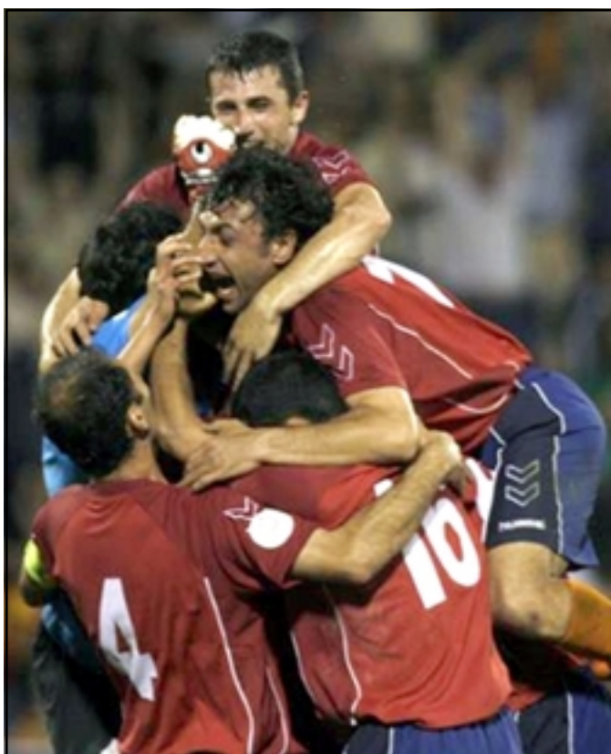
Armenia's players celebrates victory over Poland in their Euro 2008 Group A qualifying soccer match in Yerevan

Despite the defeat the Poles still lead Group A with 19 points from nine matches, five points ahead of both Portugal and Serbia, who have two games in