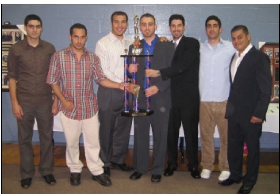
Հ.Մ.Մ. Փասատինայի կազմը կը ստանայ խոյանական բաժակը

Միհրան Խաչատուրեանի ընդ թամար Փափիրեանի ամուսնութեան բարեբաստիկ առիթով՝ Հ.Մ.Մ.ի վարչութիւնը ջերմօրն կը շնորհաւորէ նորապսակ զոյգն ու անոնց համայն պարագաները, մասնաւորաբար Տէր եւ Տիկ. Ընկ. Նորայր եւ Մարի Խաչատուրեանները, մաղթելով երջանիկ տարիներ: