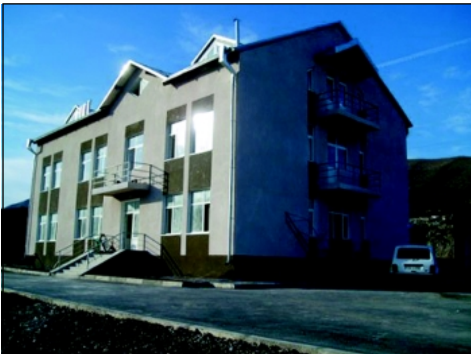
The new, gleaming Madaghis School built in the Martakert Region of Nagorno Karabakh. The School will be named after Baroness Caroline Cox

be unsafe due to landslides common in the area. Armenia Fund hired a group of experts, who in cooperation with local government agencies, conducted a meticulous soil survey in the village. The group has already determined the safest, reliable location for the Hakaku Village School. Construction will be-