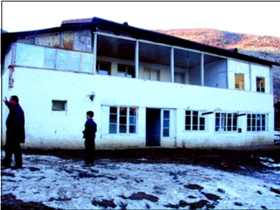
The old, dilapidated Hakaku Village School in Hadrut, Nagorno Karabakh waiting to be demolished

Manoogian-Demirdjian School of Canoga Park, California led a major fundraising effort for the Hakaku School in the months preceding the Telethon resulting in a record breaking $115,000 USD. The old school in Hakaku will be demolished. However, its present site will not be used because the ground soil has been determined to