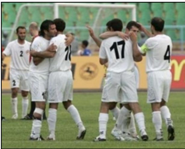
Ղազախստան-Հայաստան յաղթանակէն ետք

Ֆուտբոլի Հայաստանի հաւաքականը վերջապէս յաղթանակ տօնեց: Հայ ֆուտբոլիստները 2:1 հաշուով հիւրընկալուելիս պարտութեան մատնեցին Ղազախստանի հաւաքականին: