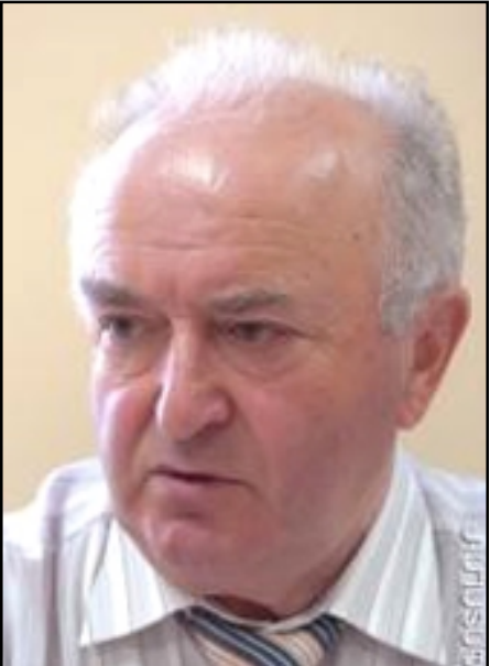
Ակադեմիկոս Լենսէր Աղալովեան

Ըստ Լենսէր Աղալովեանի՝ իրենց պատասխանին հետեւել է Սերժ Սարգսեանի հետեւեալ հարցը. «Ի՞նչ է՝ ձեր ուզածը այն չէ՞ր, որ ԼՂՀ-ն Հայաստանին միանար միջանցքով: Այդ միտքը Սերժ Սարգսեանը վերջերս կրկնեց նաեւ