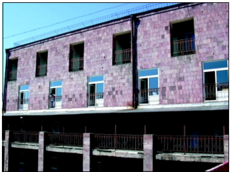
Nork-Marash Hospital: The 2nd and 3rd floors of the hospital undergoing major reconstruction

Since its inception in 1989, the UAF has sent $496 million of humanitarian assistance to Armenia on board 143 airlifts and 1,449 sea containers. The UAF is the collective effort of the Armenian Assembly of America, Armenian General Benevolent Union, Armenian Missionary Association of America, Armenian Relief Society, Diocese of the Armenian Church of America, Prelacy of the Armenian Apostolic Church of America and The Lincy Foundation. For more information, contact the UAF office at 1101 North Pacific Avenue, Suite 204, Glendale, CA 91202 or call (818) 241-8900.