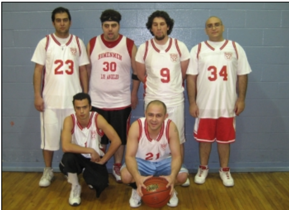
Հ.Մ.Մ. Կլեմտյի կազմը

Հ.Ե.Ը.ի Արեւմտեան Ամերիկայի Շրջանային Վարչութեան կազմակերպած գարնանային մարզախաղերու աւարտական պասքեթպոլի խաղերը տեղի ունեցան Երեքշաբթի Մայիս 2, 2007ին Երեկոցեան ժամը 9:00ին Ալեք Մանուկեան մարզադաշտին վրայ, ներկայութեամբ Հ.Մ.Մ.ի եւ Հ.Ե.Ը.ի վարչութեան մարզական պատասխանատուներուն: Օրը զուգակցելով Սարգիս Աղիկեանի վաղաժամ մահունան, որ պատահեցաւ ինքնաշարժի արկածի հետեւանքով, ընկեր Մանուկ Տէփոցեան խնդրեց մէկ