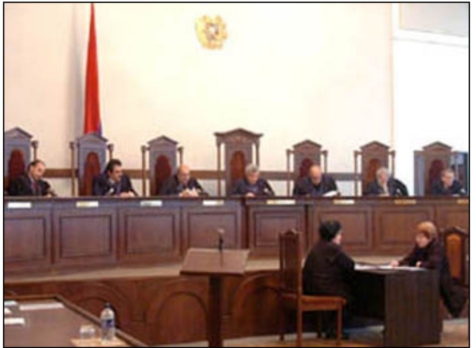
Հայաստանի Սահմանադրական Դատարանը իր մէկ նիստի ընթացքին

«Իմպիւզմենտ» դաշինքի ներկայացուցիչ Նիկոլ Փաշինեան շարունակեց բացատրութիւններ տալ արձանագրուած ընտրախախտումներու վերաբերեալ: