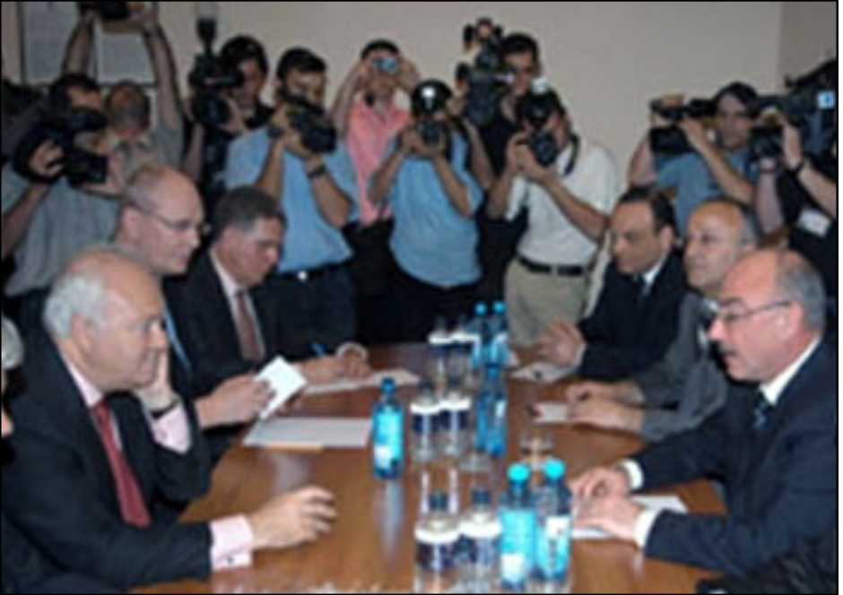
Տեսարան մը ԵԱՀԿ նախագահ Մորատինոսի եւ Լեոնային Ղարաբաղի նախագահ Արկադի Դուկասեանի միջեւ կայացած հանդիպումէն

«ԱԶԱՏՈՒԹԻՒՆ ՌԱՏԻՈՅ»: Տարածաշրջանային այցով Երեւա-նում գտնուող ԵԱՀԿ-ի գործող նա-խագահ, Իսպանիայի արտգործնա-խարար Միգել Անխել Մորատինոսը Երեքշաբթի, Յունիս 5-ին աւարտեց հայաստանեան հանդիպումները: