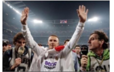
Ռէալ Մատրիտ նուաճեց Սպանիոյ առաջնութիւնը՝ լուսանկարին մէջ խումբի անգլիացի աստղ Տելիտ Պէքերմոք Յուլիս 21-եմ սկսեալ մաս պիտի կազմէ Լոս Անճելըսի Կալաքի խումբին

Սպանիայի ֆուտպոլի առաջ-նութեան 38-րդ եւ վերջին հան-գրուանի մրցումներուն արդիւնքները