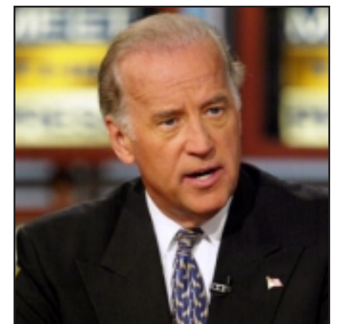
Senator Joseph Biden

Biden’s statement, which was submitted for the congressional record on June 15, endorses the Laureates’ call for Turks and Armenians to take steps to lift the blockade, generate confidence through civil society cooperation, improve official contact and allow basic freedoms. He also supports their call on Ankara to end all forms of discrimination against ethnic