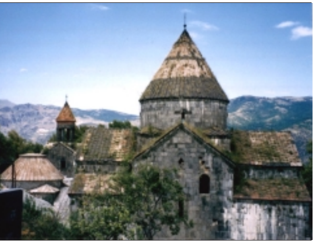
Սանահինի վանական համալիրը

ԵՐԵՒԱՆ, «ԱՅԲ-ՖԷ»: 10-12-րդ դարերից մեզ հասած Սանահինի վանական համալիրը վտանգի տակ է: Պատմական կառույցն օր օրի խարխուլում է: Տանիքներին աճած հարուստ բուսականութիւնը խարխուլում է յատկապէս Սուրբ Աստուածածին ու Ամենափրկիչ եկեղեցիների տանիքները: