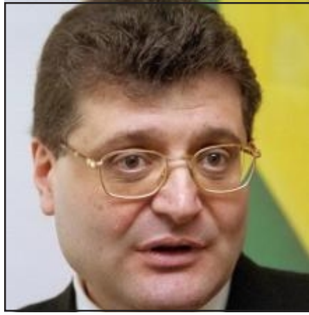
«Նոր ժամանակներ» կուսակցութեան նախագահ Արամ Կարապետեան

ԵՐԵՒԱՆ, «ԱՅԲ-ՖԷ»: «Նոր ժամանակներ» կուսակցությունը եւս նախագահական ընտրություններին կը մասնակցի սեփական թեկնածուով. այս մասին Յունիս 18-ին յայտարարություն է տարածել կուսակցությունը: Կուսակցության այս որոշումը պայմանաւորուած է նաեւ խորհրդարանական ընտրություններում արձանագրած յաջողություններով: