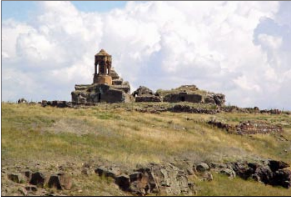
Monastery of Horomos

The city comprised dozens of religious structures (churches, chapels, monasteries and mausoleums) and secular buildings (royal palaces, mansions, baths, markets, caravanserais) and defensive structures (the citadel and double line of ramparts) as well as bridges, aqueducts and sewer systems. While the urban center of Ani was being developed, so too was an underground Ani being built, whose remains testify to the existence of hundreds of houses, dozens of chapels and tombs, monastery complexes, and city service facilities such as