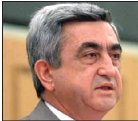
Հայաստանի վարչապետ Սերժ Սարգսեան

Գործակալութիւնը կը յիշեցնէ, որ թուրքերոյ եւ Ատրպէյճանի կողմէ շրջափակումը Հայաստանին ստիպած են առեւտրային կապերը իրականացնել միայն Վրաստանի եւ Իրանի տարածքով: Այդ դժուարութիւնները հանգեցուցած են գի-