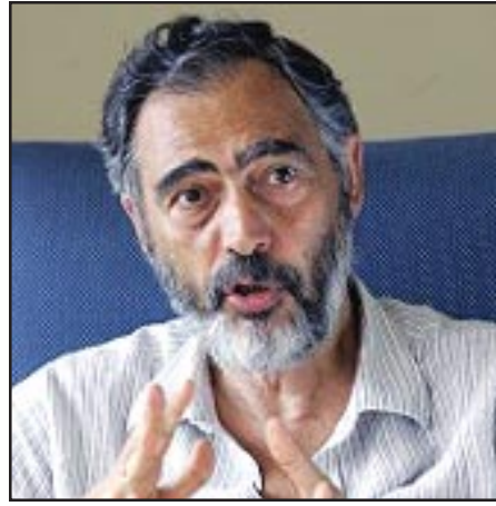
Agos editor-in-chief Etyen Mahcupyan