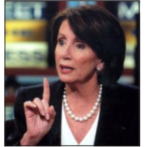
Speaker Nancy Pelosi

House, lower chamber of Congress, are now supporting the Armenian genocide resolution. The number of representatives cosponsoring the measure in late June rose to 218 in the 435-member House.