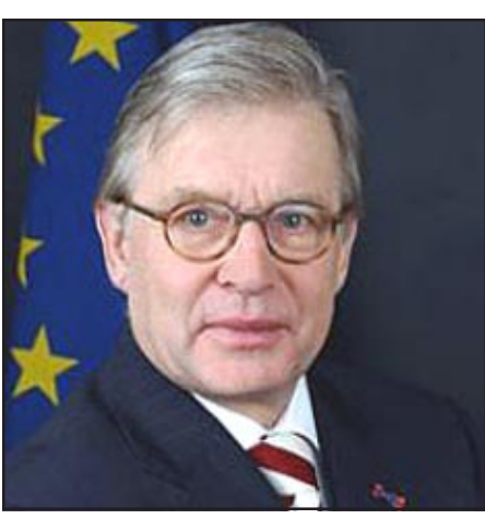
ԵՆԻՒՎ նախագահ Ռենէ Վան Դեր Լինդեն

ԵՐԵՒԱՆ, «ԱՅԲ-ՖԷ»: Երկիրը չի զարգանալ եւ չի բարգաւաճի առանց ԵՆԻՒ-ի ժողովրդավարութեան, մարդու իրաւունքների եւ օրէնքի գերակայութեան հիմնարար սկզբունքները հաշուի առնելու տարածաշրջան կատարած այցի աւարտին Պաքու յայտարարել է ԵՆԻՒՎ նախագահ Ռենէ Վան Դեր Լինդենը: Նա մասնաւորապէս կարեւորել է ազատ եւ արդար ընտրութիւնների անցկացումը, որոնք ժողովրդավարութեան հիմքն են: Նա շեշտել է 2008թ Ատրպէյճանի նախագահի ընտրութիւնների՝ ԵՆԻՒ չափանիշներին համապատասխան անցկացումը՝ յոյս ունելով, որ դրանք որակապէս կը տարբերուեն 2005թ խորհրդարանական ընտրութիւններից: Նա կոչ է արել երկրի իշխանութիւններին՝ ակտիւացնել համագործակցութիւնը ԵՆԻՒ կառուցների հետ՝ բարելաւելու համար ընտրական օրէնսդրութիւնը, մասնաւորապէս ընտրական յանձնաժողովների եւ դիտորդների գործառնությունների եւ իրաւունքների յստակացման առումով: ԵՆԻՒՎ նախագահը ընդգծել է, որ յատուկ ուշադրութիւն դարձուի քաղաքական պատճառով բանտում գտնուող լրագրողների եւ այլոց խնդրին: Վաստառողները, ըստ նրա, պէտք է ազատ արձակուեն՝ մարդասիրական նկատառումներով: