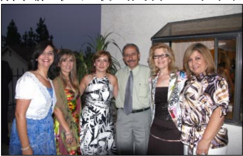
Կազմակերպիչ Յանձնախումբի անդամները

նուիրեց օրուան հիւրընկալ Տէր եւ Տիկին Կարօ եւ Անի Պէքարեաններուն, առ ի երախտագիտութիւն այս երեկոյի յաջողութեան համար իրենց բերած մեծ նպաստին, թէ