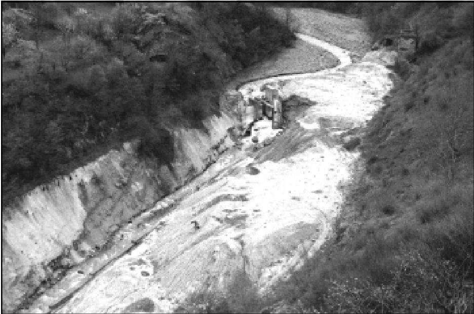
The new film "Poisoning for Profit" documents the human health problems and environmental destruction caused by mining in Armenia, which occurs when mining waste products enter the air and soil and pollute irrigation and drinking water

The ninth in a series of environmental films produced by Vem Media Arts in Armenia, titled "Poisoning for Profit" was released on World Environment Day. The documentary was funded by Armenia Tree Project, Armenian Forests NGO, World Wildlife Fund Caucasus Office, and the Greens Union of Armenia.