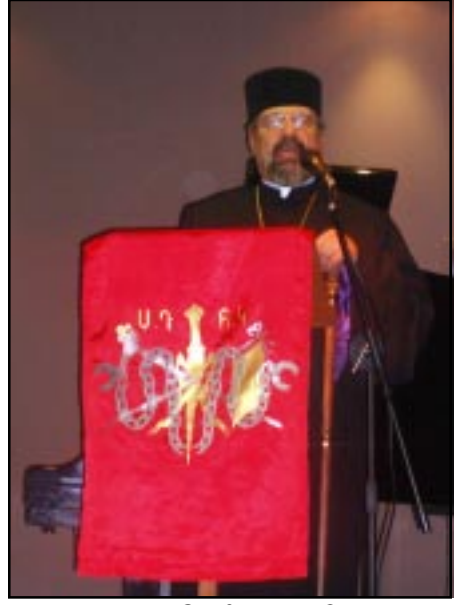
Աւստրալիոյ Թեմի Առաջնորդ Աղան Արթեայիսկոպոս Պալիազեան

«Քսան կախաղաններու 92-րդ տարելիցի հանդիսութիւնները հայկական սփիւռքի տարածքին, այս տարի կը նշուին գուգահեռաբար Սոցիալ Դեմոկրատ Հնչակեան Կուսակցութեան հիմնադրութեան