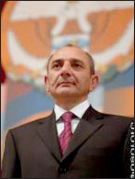
ԼՂՀ նախագահ Բակո Սահակեան երդման արարողութեան ընթացքին

Սեպտեմբեր 7-ին Ստեփանակերտի կայազօրային Սպայի Տան դահլիճէն ներս տեղի ունեցաւ Լեռնային Ղարաբաղի Հանրապետութեան նորընտիր նախագահ Բակո Սահակեանի երդման արարողութիւնը: