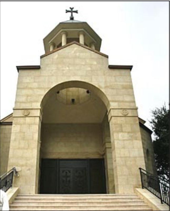
Փասատինայի նորակառույց եկեղեցույ մուտքը

Օրուան պատարագիչն էր Արեւմտեան Թեմի առաջնորդ Գերշ. Տ. Յովնան Արք. Տէրտէրեան: Սուրբ սեղանին կը սպասարկէին եկեղեցու նախկին հովիւներ Գերայ. Տ. Ասպետ Վրդ. Պալեան եւ Արթ. Տ. Մուշեղ Ա. Բհնյ. Թաշճեան: