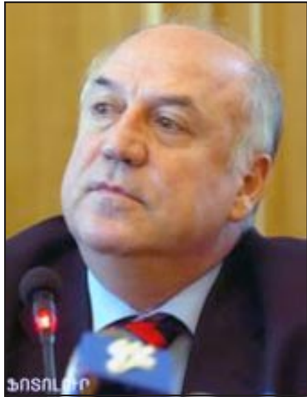
Ազգային Միաբանության կուսակցության նախագահ Արտաշես Գեղամեան

ԵՐԵՒԱՆ, «ԱՅԲ-ՖԷ»: «Ազգային Միաբանությունը կուսակցություն» նախագահությունը Սեպտեմբեր 7-ին տարածած հարցազրույցում վերահաստատել է Արտաշես Գեղամեանի այն մտայնությունը, որով առաջարկում է ընդդիմադիր քաղաքական կուսակցությունների հանդիպումներին մասնակից դարձնել նաև Ռոբերտ Քոչարեանին եւ Սերժ Սարգսյանին: Աւելին, ԱՄ-ն նպատակադրված է գտնում ընդլայնել նման հանդիպումների շրջանակը՝ ընդգրկելով թէ՛ իշխանական, թէ՛ ընդդիմադիր այլ կուսակցությունների առաջնորդներին: