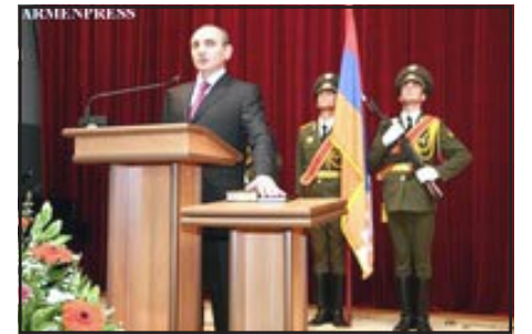
Bako Saakian taking the oath of office

Saakian pledged to push for full independence of the mountainous territory. Speaking at the inauguration, Saakian said Azerbaijan must accept Nagorno-Karabakh representatives at talks.