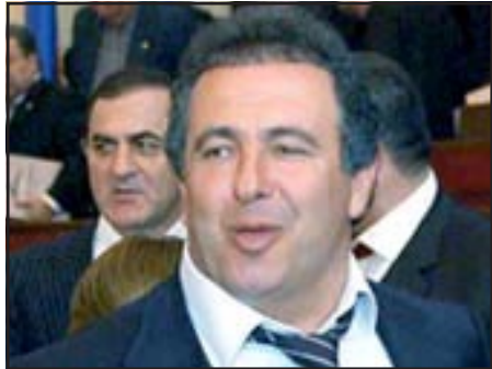
«Բարգաւաճ Հայաստան» կուսակցութեան նախագահ Գագիկ Ծառուկեան

ԵՐԵՒԱՆ, «ԱՅԲ-ՖԷ»: Ովքեր կ'առաջադրուեն ՀՀ նախագահի պաշտօնում, առաջիկա յայտնի է. բաց յայտնի դարձաւ առաջադրուելու ցանկութիւնը չունեցող մէկի անունը՝ Գագիկ Ծառուկեան: