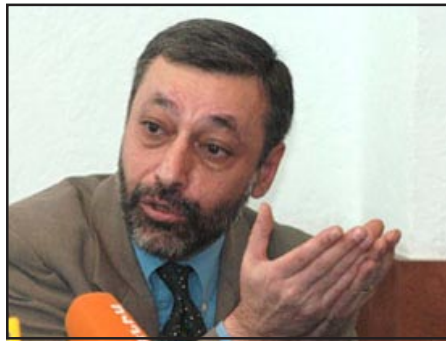
Former Foreign Minister Aleksandr Arzumian

vestigators have asked Russian prosecutors to check the veracity of Aghazarian's claim and the legality of his stated revenues.