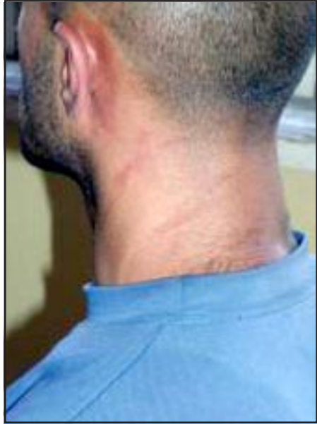
Խոշտանգումներու ենթարկուած երիտասարդներէն մին ցոյց կու տայ իր ստացած վէրքերը

«ԱԶԱՏՈՒԹԻՒՆ ՌԱՏԻՈՅ»: Կիրակի, Սեպտեմբեր 9-ին Վանաձոր այցելած Հայաստանի հելսինքեան ընկերակցութեան նախագահ Միքայէլ Դանիէլեանը երկուշաբթի օրը եւս մէկ անգամ մանրամասն անդրադարձաւ Վանաձորի քաղաքապետի ձերբակալուած եղբօրորդուն պատկանող ռեստորանի աշխատակիցների խոշտանգումների դէպքերին: