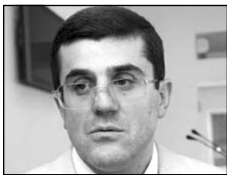
ԼՂԶ նոր վարչապետ Արա Յարութիւնեան

Արա Յարութիւնեանը, որը 2005 թվականին պատգամաւոր է ընտրուել մեծամասնական համակարգով, խորհրդարանում յայտարարեց, որ վայր է դնում պատգամաւորական մանդատը եւ հրա-