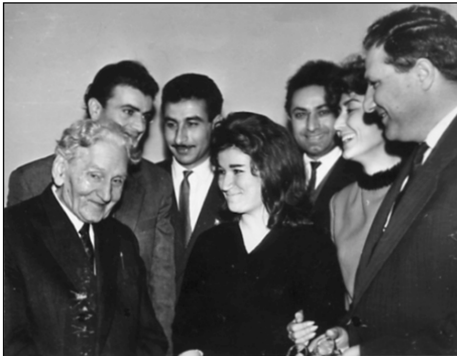
Առաջին սփիւռքահայ ուսանողներէն խումբ մը մեծ վարպետ Մարտիրոս Մարեանի հետ

Դա չի շեցնում է ոչ հեռաւոր անցեալը, այն ժամանակները երբ