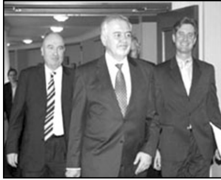
OSCE Minsk Group co-chairs