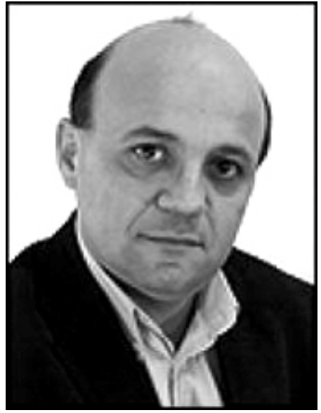
Շուէդիայի խորհրդարանի պատգամաւոր հայագրի Մուրադ Արթին

Մուրադ Արթինին մտահոգում է Հայաստանի քաղաքական-հասարակական համակարգում կանանց ներգրաւուածութեան ցածր տոկոսը: «Ես ամաչում եմ Հայաստանում կանանց վիճակի համար: Նոյնիսկ Թուրքիայի պառլամեն-