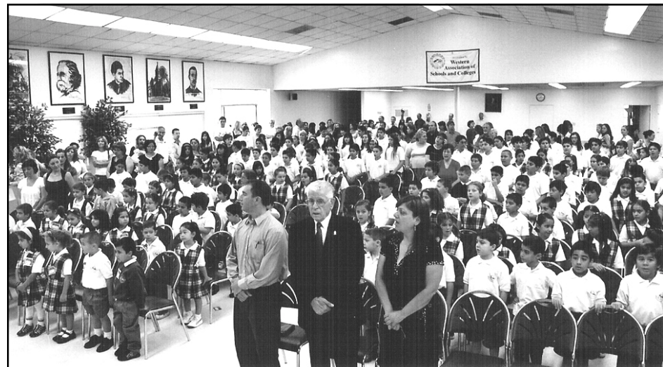
Մերտինեան վարժարանի վերամուտի պաշտօնական հանդիսութիւնը

Օրուան առաջին պատգամաբերն էր Վեր. Ճէյսըն Մաթոսեան: