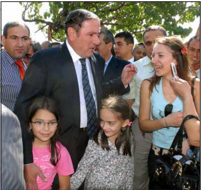
Լեւոն Տէր-Պետրոսեան Մուսալեռցիներու հետ

Այս տասը տարուայ փորձը ցոյց տուեց, որ մնացած ճանապարհները յաջողութիւն չեն բերում, այլ ճանապարհ չկայ: Հիմա, ես կ'ողջունէի ցանկացած մէկին, որը կը յաւակնէր այդ միասնական թեկնածուի դերին եւ նրան կը յաջողուէր իր շուրջը համախմբել բոլոր ուժերին, եւ իմ ամբողջ կարողութեամբ, ամբողջ ազդեցութեամբ ես կը նպաստէի այդ պրոցէսին: Ինչ վերաբերում է ինձ, ասեմ: Ես այսօր դեռ որոշում չունեմ: Ես դեռ ու-