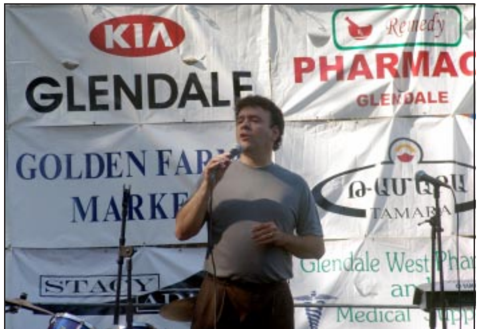
Armenian Independence Day Festival

Օրուան ընթացքին տեղի ունեցան նաեւ նարտիի մրցաշարք եւ փոքրերու յատուկ մնայուն ժամանցի այլազան խաղեր: Այս առթիւ վիճակահանութեան դրուած էին բազմաթիւ պար-