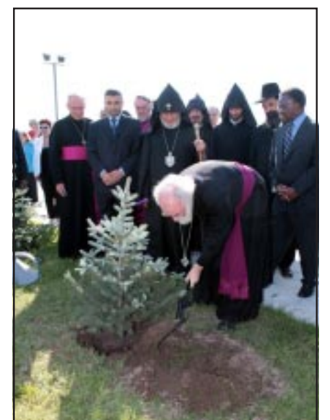
Archbishop of Canterbury Rowan Williams planting a tree at the Tsitsernakabert Genocide Memorial Park

Archbishop Williams's itinerary in Armenia also included a visit to a prison near the town of Abovian where he familiarized himself with the plight of its more than 150 inmates, all of them