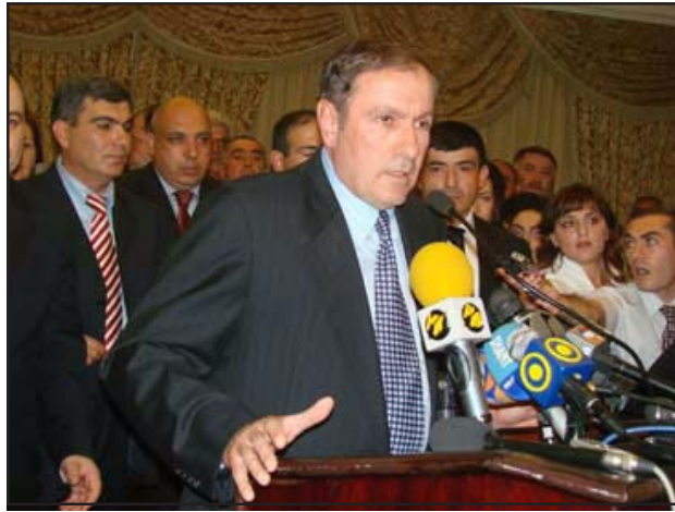
Former president Levon Ter-Petrosian speaking during Independence Day celebration

Ter-Petrosian indicated that he also needs to build broad-based opposition support for his presidential bid and does not think that his traditional support base, mainly made up of his Armenian Pan-National Movement (HSH) party, alone can help him make a strong election showing. "The only way to get rid of these authorities is the