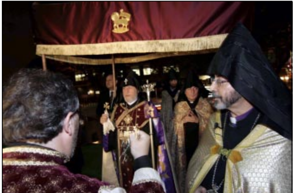
Ն.Ս.Օ.Տ.Տ. Գարեգին Բ. Ամենայն Հայոց Կաթողիկոս իր շքախումբով Ս. Վարդան Մայր Տաճարի մուտքին

ԱՅՑԵԼՈՒԹԻՒՆ ՊՈՍԹՈՆ Հոկտեմբեր 5, 2007ին Ամենայն Հայոց Կաթողիկոսը Իր շքախումբով Լոնկ Այլլընտի օդանաւակայանէն ճամբայ ելաւ դէպի Պոսթոն, ուր Զինք դիմաւորելու եկած էին շրջանի հոգեւորականները, եկեղեցապատկան կազմակերպութեան ներկայացուցիչներ եւ դպրոցական աշակերտներ: Աւանդական »աղ ու հաց«ի օրհնութենէն ետք, շքախումբը ճամբայ ելաւ դէպի պանդոկ: Երեկոյեան ժամը 8:00-ին՝ One Exchange Place-ի մէջ տեղի ունեցաւ երիտասարդ արհեստավարներու ձեռնարկը՝ յատկապէս պատրաստուած ճոխ յայտագիրով: Ներկայ էին մօտ 300 երիտասարդներ: