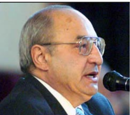
ԱԺՄ կուսակցութեան նախագահ Վազգէն Մանուկեան

ԵՐԵՒԱՆ, «ԱՅԲ-ՖԷ»: ԱԺՄ-ն առաջիկայ նախագահական ընտրութիւններին կը մասնակցի սեփական թեկնածուով: Հոկտեմբեր 7-ին տեղի ունեցած ԱԺՄ խորհրդի նիստում կուսակցութեան խորհուրդը երաշխաւորել է կուսակցութեան նախագահի՝ Վազգէն Մանուկեանի թեկնածութիւնը: