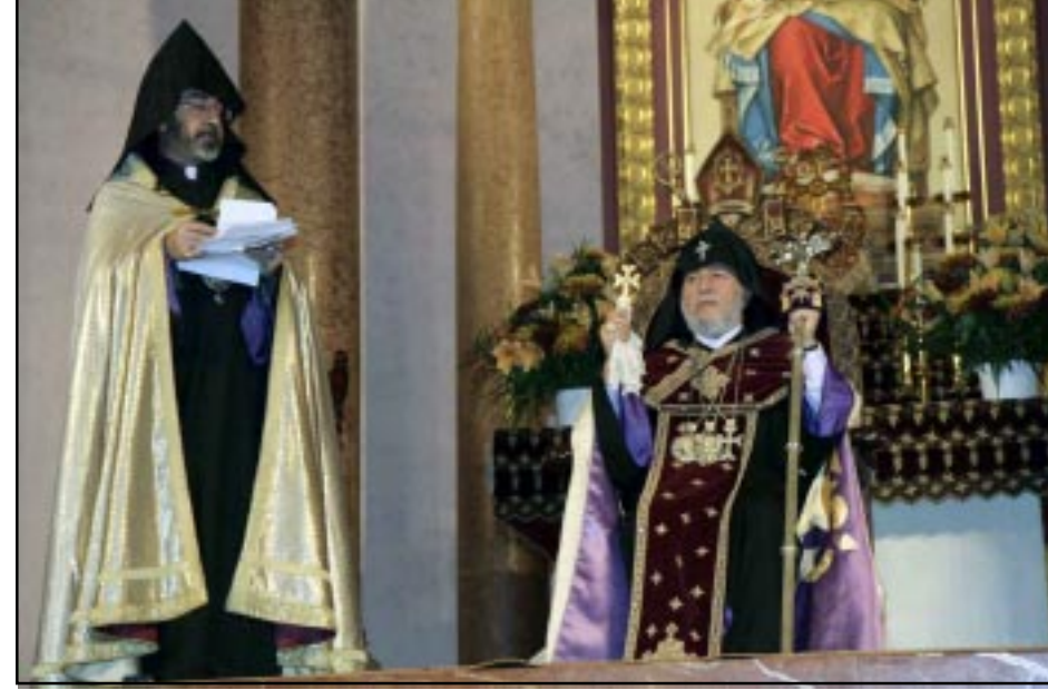
Արեւելեան Թեմի Առաջնորդ Գերշ. Տ. Խաժակ Արք. Պարսամեան եւ Ամենայն Հայոց Կաթողիկոս Ն.Ս.Օ.Տ.Տ. Գարեգին Բ.

Ս. Վարդան Մայր Տաճարին մէջ Գերշ. Տ. Խաժակ Արք. Պարսամեանի բարեգալստեան խօսքէն ետք Վեհափառը իր գոհունասկութիւնը յայտնեց որ այսքան հոծ թիւով Հայ եւ քոյր եկեղեցիներու հոգեւորականներ եւ հաւատացեալներ ներկայ են բարի գալուստ մաղթելու Ամենայն Հայոց Կաթողիկոսին: Ս. Էջմիածնի եւ ազատ ու վերածնած Մայր հայրենիքի ող-