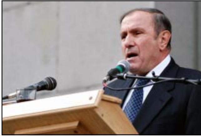
Former President Levon Ter-Petrosian during Yerevan rally

"Otherwise, in which other country can an ordinary bus driver get so rich in one or two years that he is able to make tens of millions of dollars in investments not in his native Artsakh (Karabakh) but in the United States of America? Or how can a 25-year-old