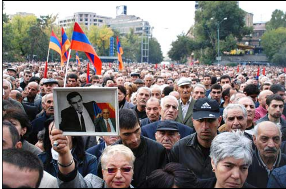
Տեսարան մը քաղաքացիական ցուցարարի ժամանակ

Հայաստանեան աղբիւրներու համաձայն, հանրահաւաքէն յետոյ Ռոբերտ Քոչարեան կազմակերպած է իշխանական վերնախաւի ժողով, որ տեղի ունեցած է Ազգային Անվտանգութեան ամառանոցէն ներս: Հաւաքին մասնակցած են իշխանութեան այն բոլոր օղակներու պատասխանատուները, որոնք կոչուած են իրականացնելու իշխանութեան նախընտրական շրջանի ծրագիրները: Հաւաքի ընթացքին բաւական երկար քննարկել են երկրէն ներս ստեղծուած նոր իրավիճակը, հնարաւոր զարգացումները եւ իշխանական օղակներու գործողութիւնները այս կամ այն տարբերակի պարագային: