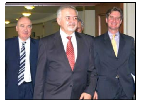
American, French and Russian co-chairs of the OSCE Minsk Group