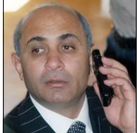
ՀՀ փոխ վարչապետ Յովիկ Աբրահամեան

Ի դէպ, Յովիկ Աբրահամեանի եւ «Ա1+»-ի ու «Ազատութեան»