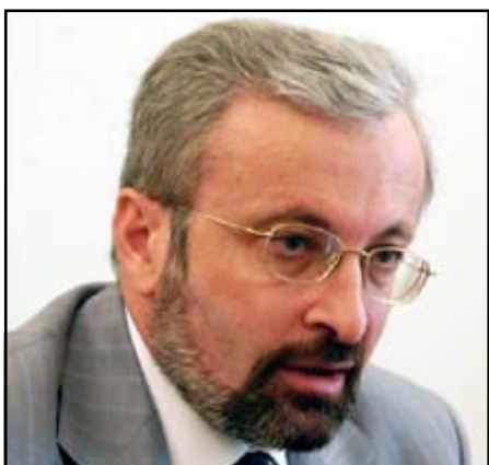
Խորհրդարանի նախագահ Տիգրան Թորոսեան

Ազգային ժողովի շէնքում պատասխանելով լրագրողների հարցերին՝ Տիգրան Թորոսեանը, խօսելով Ուրբաթ օրը կայացած հանրահա-