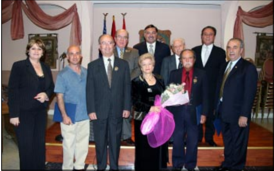
Պատուոյ Գիրքը ստացողները Ս.Դ.Հ.Կ. Կեդրոնական Վարչութեան անդամներուն հետ

Ս.Դ. Հնչակեան Կուսակցու- թեան 120-ամեակի տօնակատա- րութիւններու ծիրէն ներս, Հոկ- տեմբեր 26-ի երեկոյեան, Հ.Մ.Մ.- ի Փաստօրինայի կեդրոնէն ներս տեղի ունեցաւ մեծարանքի հանդի- սութիւն կազմակերպութեամբ Ս.Դ.Հ.Կ. Արեւմտեան ամերիկայի