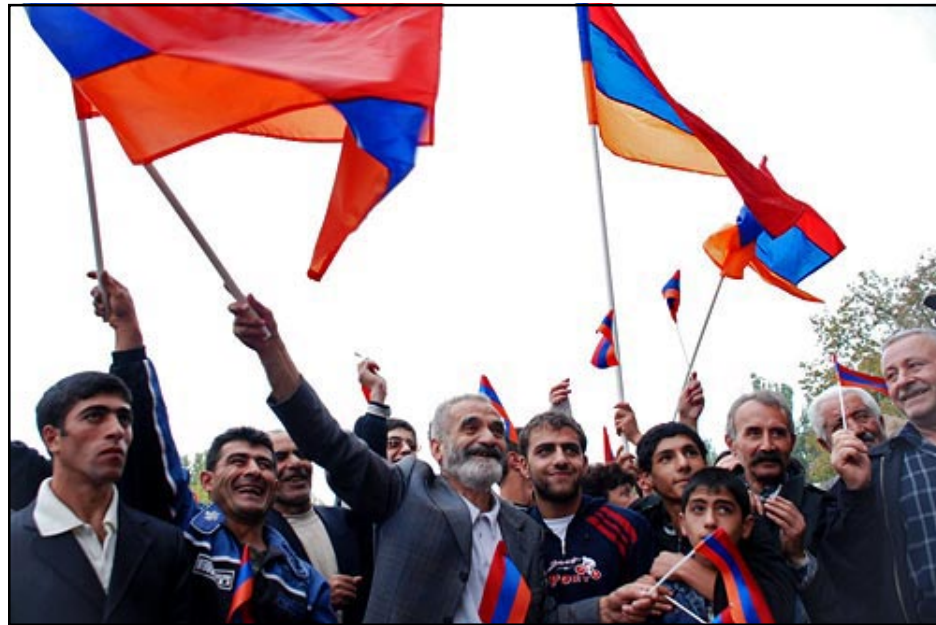
Ter-Petrosian supporters waving flags during the Yerevan rally

but, for the opposition, the ex-president's return to politics "is perhaps an exclusive chance to get noticed."