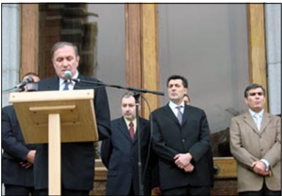
Ելոյթ կ'ուրեմնայ Լեւոն Տէր-Պետրոսեան. Կողքին՝ Ստեփան Դեմիրճեան, Արամ Սարգսեան եւ ուրիշներ

«Հայաստանում ներկայ իշ- խանական համակարգը կառուց-