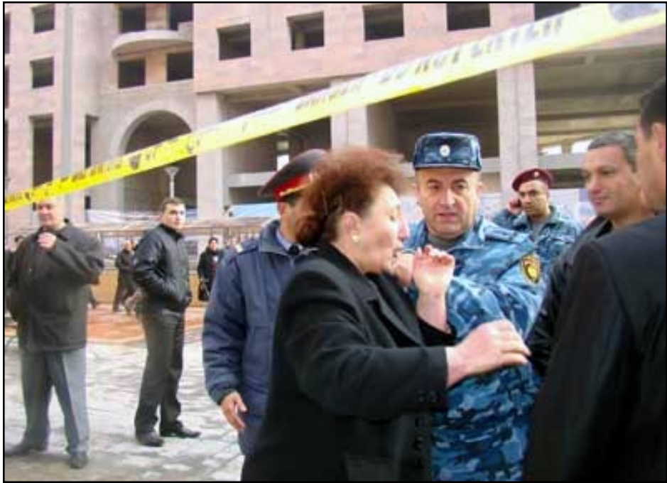
Ոստիկանները կը փորձեն հեռացնել բողոքող քաղաքացիին

Նոյեմբեր 16-ին Հիւսիսային պողոտայի բացման արարողութեան ժամանակ Ռոբերտ Քոչարեանը եւ նրան ուղեկցող չինովիկները պողոտայով շրջելիս, հասնելով Թուամանեան փողոց՝ շրջանցեցին բողոքի ցույցը, որը կազմակերպել էին այդ պողոտայի՝ իրենց տներից վտարուած բնակիչները: