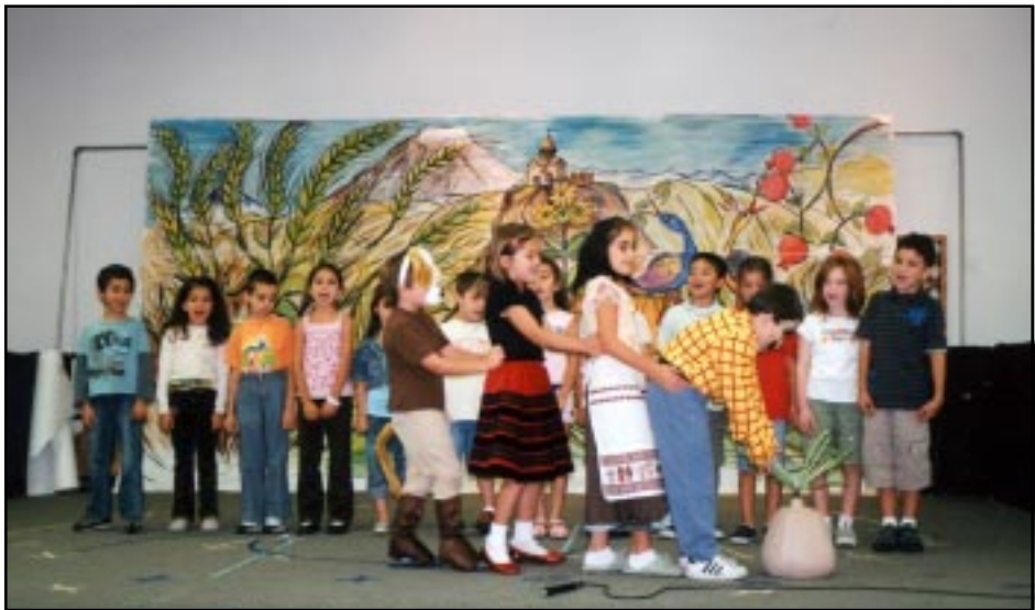
«Պապիկն ու շողգամը»