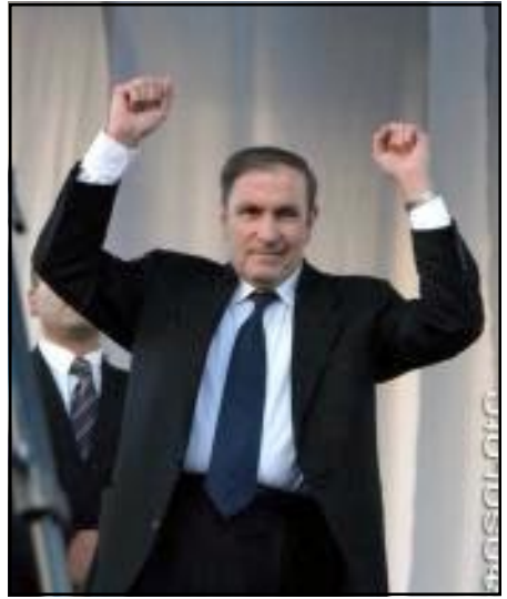
Լեւոն Տէր-Պետրոսեան Նոյեմբեր 16-ի հանրահաւաքի ընթացքին

«Ես առաջիմ չեմ կարող պետական գաղտնիքներ հրապարակել, բաց հաւատարմութեամբ եմ, որ պատերազմի, գէնքի, գինամթերքի եւ վառելիքի հայթայթման եւ բանակի մատակարարման, Հայաստանի սահմանամերձ շրջանների պաշտպանութեան, խափանուած կոմունիկացիաների վրայ այնքան կոմար է ծախսուել, որ լիւրջ կը բաւարարէր