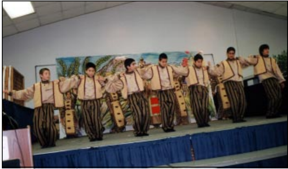
Մուսա Տաղի տոնմիկ պարը

«քարնավալ» մը Ծնողա-ուսուցչաց մարմինի կազմակերպութեամբ: Առաւօտեան ժամը 10էն առաջ արդէն, դպրոցին բակը լեցուն էր. ամէն կողմ խաղեր, կրպակներ... ժամը 11ին գործադրուեցաւ գեղարուեստական յայտագիր մը, վարժարանիս սրահին մէջ, ուր ներկաներու թիւը աւելի քան 300 էր: Հայ մշակոյթին նուիրուած այս յայ-