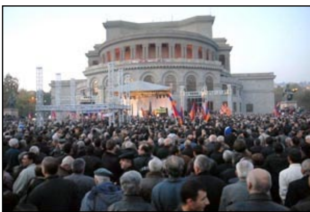
Thousands of Ter-Petrosian supporters in Freedom Square rally

ing policy — and I really did — this is the biggest one. In fact, this is not a mistake but a disaster which I inflicted on our people. So help me rid you of that disaster," he added, drawing cheers from the crowd.