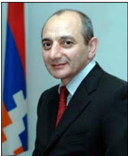
Լեոնային Ղարաբաղի նախագահ Բակո Սահակյան

ԼԵՒՈՆ ՏԵՐ-ՊԵՏՐՈՍԵԱՆ ՆԵՐՈՂՈՒԹԻՒՆ ԽՆԴՐԵՑ ԺՈՂՈՎՈՐԴԷՆ