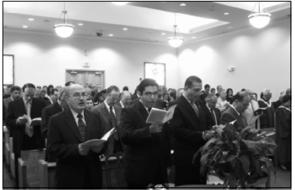
Sunday morning Worship Service in Chicago Church