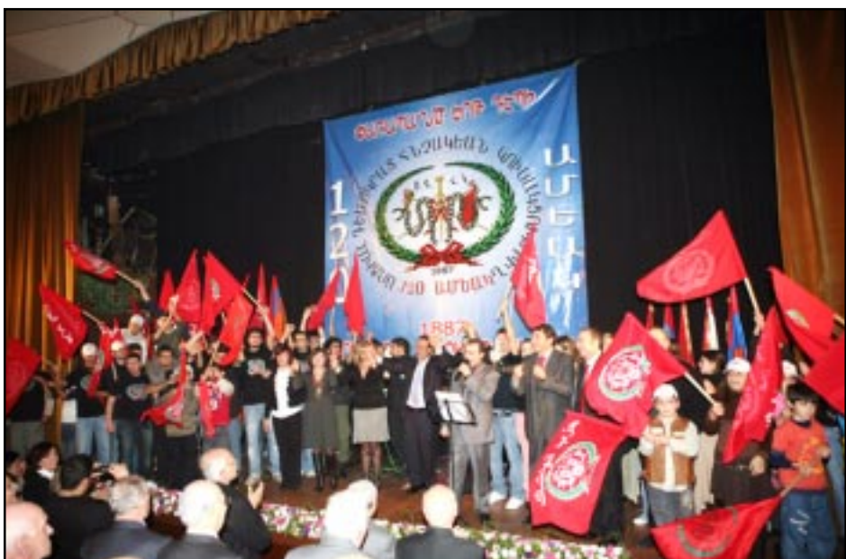
Հայրենասիրական երգերու հնչիւններուն տակ երիտասարդութիւնը Մայր Կուսակցութեան դրօշներով կը բարձրանայ բեմ

2007 տարուայ ընթացքին կուսակցական, հրապարակային գաւազան ձեռնարկներու եզրափակիչ հանդիսութիւնն էր որ կը կատարուէր: Խուռներամ բազմութեան կողքին, հանդիսութեան ներկայ էին Ն.Ս.Օ.Տ.Տ. Արամ Ա. Կաթողիկոսի ներկայացուցիչ Սրբազան Հայր՝ թեմիս Առաջնորդ Տէր Գեղամ Եպս. Խաչերեանը, Արհիպապառի Հայր Վարդան Եպս. Աշգարեանը, Լիբանանի մօտ Հայաստանի Հանրապետութեան արտակարգ եւ լիազօր դեսպան դոկտ. Վահան Տէր Ղեւոնդեանը, Ամերիկայի հիւրաբար Պէչըրթ գտնուող Ս. Դ. Հ. Կ. Կեդրոնական Վարչութեան ատենապետ ընկ. Սեդրակ Աճէմեանը, հայկական ազգային կուսակցու-