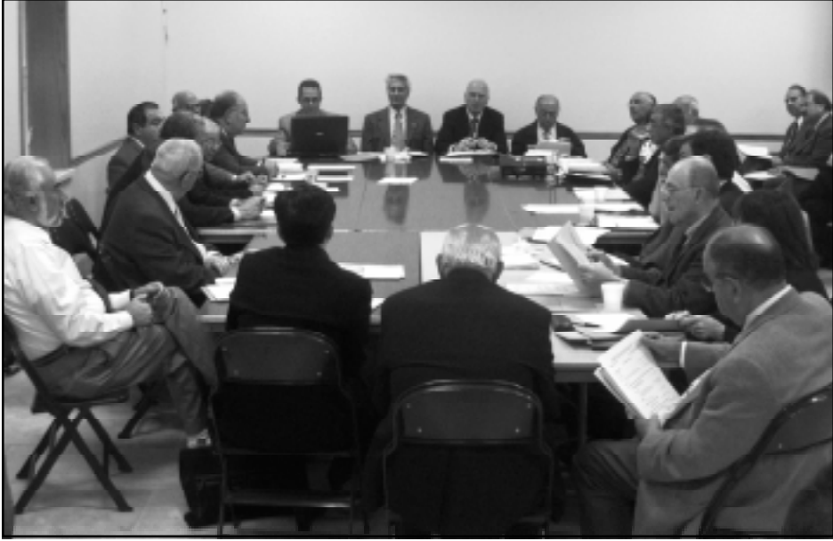
AMAA Board of Directors Meeting

It was a special treat to attend the AMAA's 89th Anniversary dinner at a