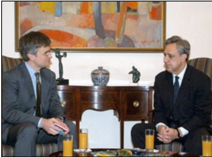
Փիթեր Սեմնեբի (ձախիմ) եւ Վարդան Օսկանյանը Երևանի մէջ կայացած հանդիպումի ընթացքին

«ԱԶԱՏՈՒԹԻՒՆ ՌԱՏԻՈՅ»: Արտգործնախարար Վարդան Օսկանյանն ՅուՆԻՍԻՍ-ում 14-ին ընդունել է Հարավային Կովկասում Եւրամիութեան յատուկ ներկայացուցիչ Փիթեր Սեմնեբին, ով Հայաստանում է աշխատանքային այցով: