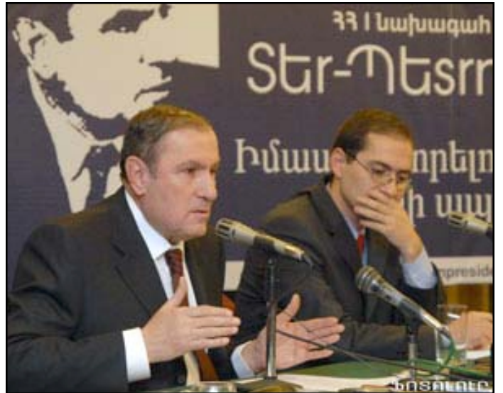
Former President Levon Ter-Petrosian during his press conference

Still, it remained unclear if Ter-Petrosian is ready to stage the kind of post-election street protests that