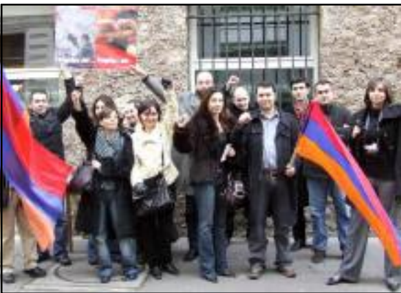
Հայաստանի քաղաքացիներու բողոքի ցոյցը Փարիզի հայկական դեսպանատան առջեւ

ԵՐԵՒԱՆ, «ԱՅԲ-Ֆէ»: Փարիզի ոստիկանապետի կողմից արտօնուած 4- ժամեայ բողոքի ցոյց է տեղի ունեցել Փարիզի հայկական դեսպանատան առջեւ, որին մասնակցել են մօտ 30 տարբեր տարիքի, մասնագիտութեան տէր ՀՀ քաղաքացիներ: