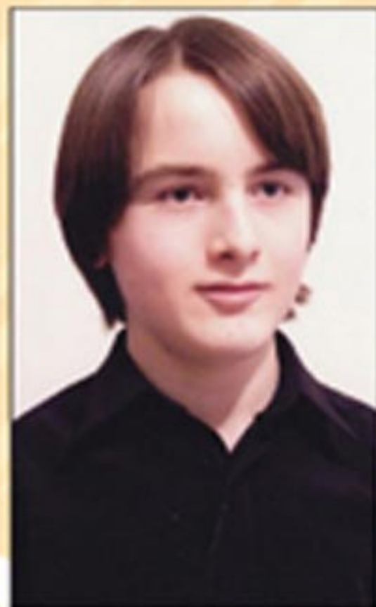
Daniil Trifonov Piano