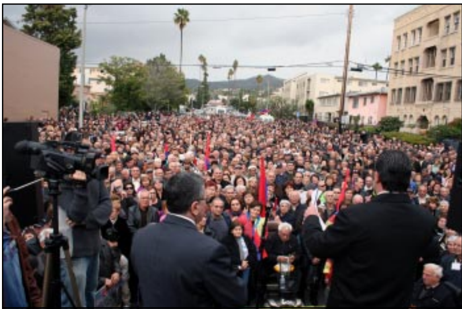
Տեսարան մը Լոս Անճելըսի մէջ տեղի ունեցած զօրակցական ցոյցէն

Կիրակի Փետրուար 24-ին Լոս Անճելըսի Լիթըլ Արմենիա թաղամասէն ներս տեղի ունեցաւ բողոքի ցույց-հանրահաւաք, որուն կը մասնակցէին 15 հազարէ աւելի ժողովուրդ: Հանրահաւաքի նպատակն էր առաջին հերթին զօրակցիլ Հայաստանի մէջ թափ առած համաժողովրդական շարժումին եւ կոչ ընել Միացեալ Նահանգներու Պետական Քարտուղարութեան ըլլալ հետեւողական Հայաստանի մէջ ժողովրդավարութեան սկզբունքներու պահպանման հարցով, չճանչնալ նախագահական ընտրութիւններու արդիւնքները, դատապար-