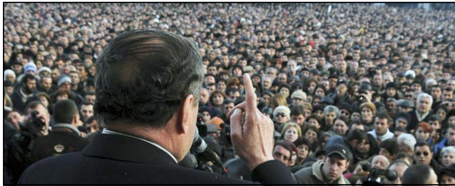
Tens of thousands listening to Levon Ter-Petrosian

During his staged rally Sarkisian appealing to the opposition protesters. "I know just how numerous are people ready to take to the streets to take care of their votes. I know that very well. But please, restrain your emotions."