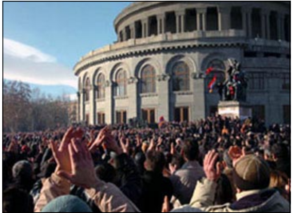
Օփերայի առջեւ օրերէ ի վեր կրկնուող տեսարանը

Շարունակելով՝ Տէր-Պետրոսեան ըսաւ. - «Ես ուզում եմ դիմել