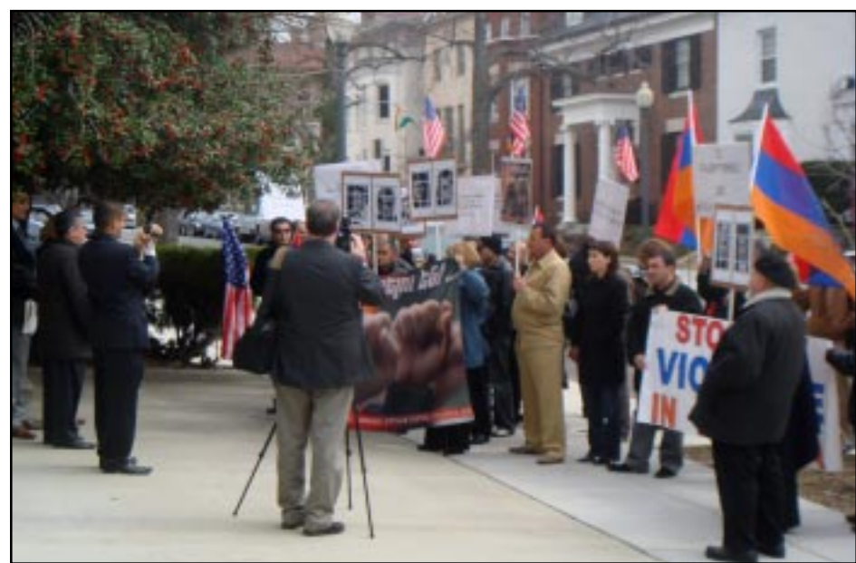
Տեսարան մը Ուաշինկթընի ցոյցէն

ՊԵՏԱԿԱՆ ՔԱՐՏՈՒՂԱՐՈՒԹԵԱՆ ՅԱՆՁՆՈՒԵՑԱՒ 10 ՀԱՁԱՐԵ ԱԲԵԼԻ ԱՏՈՐԱԳՐՈՒԹԵԱՄԲ ՊԱՅԱՆՁԱԳԻՐ ՄԸ