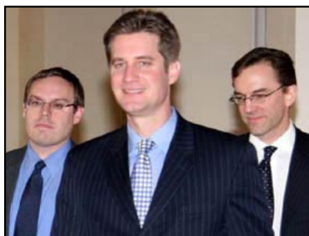
Bryza pictured with top U.S. Embassy officials during his visit to Yerevan last week

Bryza's comments came just three days after he held talks in Yerevan with outgoing President Robert Kocharian,