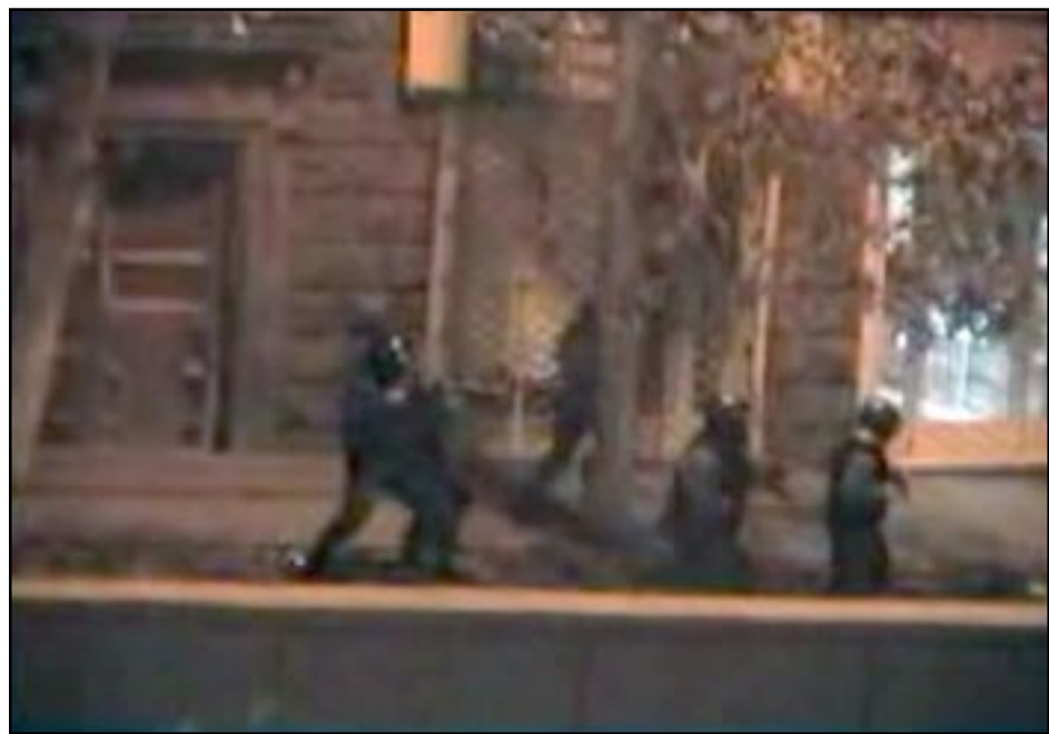
Վիտէօ Գևորգիանու մէկ առնուած սոյն Գևորգ, յստակ ցոյց կու տայ թէ ինչպէս Հայ զինուորականներ կը կրակեն իրենց ժողովուրդի վրայ: Թէեւ Գևորգ ցած ռալկի՝ գայն կը հրատարակենք յանուն պատմութեան

«Գրիգոր Լուսաւորիչ պողոտայի բնակիչներին շատերը, որոնք իրենց պատահաններին հետեւել են այդ փողոցում տեղի ունեցած Մարտի 1-ի դիշերուայ իրադարձութիւններին, արձանագրել են, թէ ինչպէս են ոստիկանութեան շարքերից դուրս գալիս խուճբեր, քարեր ու բենզինով լիքը շէր նետում խանութների վրայ ու նորից ոստիկանների միջով հանգիստ հետ գնում: Քաղաքացիները վկայում են, որ նոյն Երեւանի քաղաքապետարանի վրայ յարձակուած խուճբը դուրս է եկել ոստիկանների շարքերից, ոստիկանները, սիրուն ճանապարհ են բացել նրանց համար եւ այդ նոյն խուճբը կրկին վերադարձել է ոստիկանների շարքերի յետեւը: Նոյնը տեղի է ունեցել նաեւ միւս օբիեկտների վրայ»