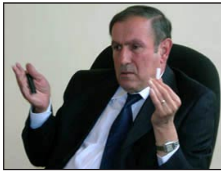
ՀՀ առաջին նախագահ Լեւոն Տէր-Պետրոսեան

Լեւոն Տէր-Պետրոսեան դժգոհութիւն է յայտնել եւրոպացի դիտորդներու պահուած քից: «Կոմերսանտ» թերթին տուած հարցազրոյցում նա պնդել է, թէ եւրոպացիները իրենց երկրներում չէին հանդուրժի նոյնը, ինչ հանդուրժում են Հայաստանում: