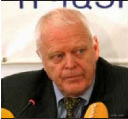
Եւրախորհրդի մարդու իրաւունքներու յանձնակատար Թոմաս Համմարբերգ

«ԱԶԱՏՈՒԹԻՒՆ ՌԱՏԻՈՅ»: «Հայաստանում այսօր լուրջ խնդիրներ կան. հասարակութիւնը երկփեղկուած է, կայ բեւեռացում, մի շարք մարդիկ ձեռքակալուած են եւ դատուելու են: Բնականաբար, դրա արդիւնքում կան մտահոգութիւններ՝ կապուած մարդու իրաւունքների պաշտպանութեան հետ», - «Ազատութիւն» ռադիոկայանի հետ գրոյցում ուրբաթ օրը ասաց Եւրախորհրդի մարդու իրաւունքների հարցերով յանձնակատար Թոմաս Համմարբերգը: