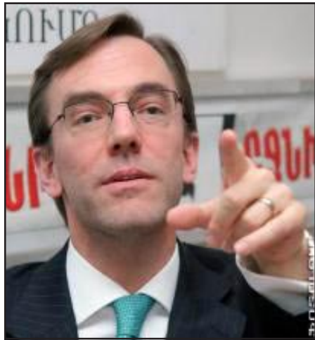
Հայաստանում ԱՄՆ գործերի ժամանակաւոր հաւատարմատար ժողէֆ Փեմինգթոն