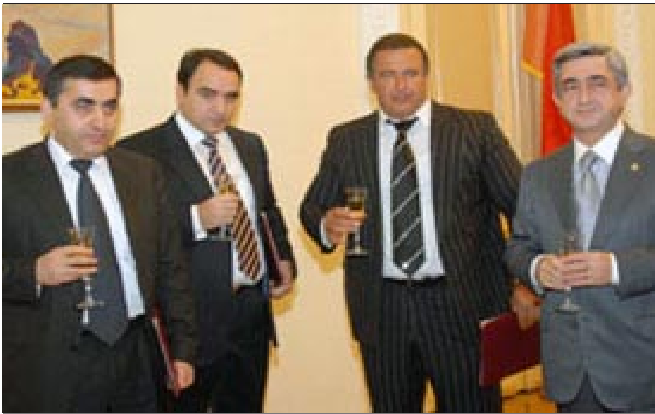
Coalition partners: toasting "end of democracy"

The Armenian capital, Yerevan, has been the stage for protests against