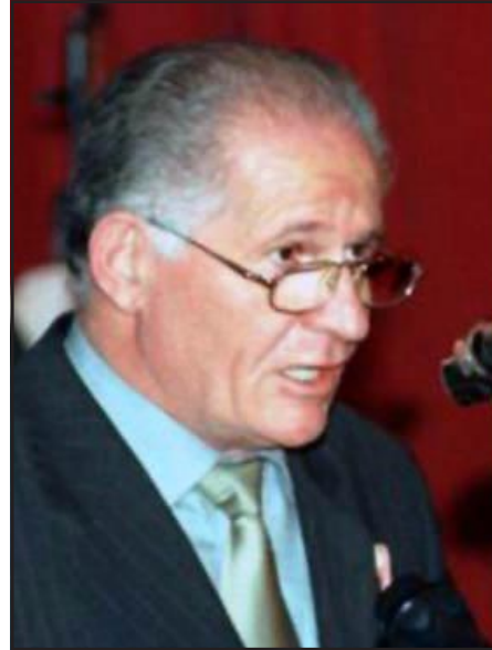
ՀՀ պաշտպանութեան նախկին նախարար Վահան Շիրիսանեան

Մամուլում հրապարակուել է, որ ապրիլի 9-ին ժամը 15:00-ին Ազատութեան հրապարակում նախատեսուել է անցկացնել զօրահանդէս: ՀՀ պաշտպանութեան նախարար Միքայէլ Յարութիւնեանը զօրահանդէս անցկացնելու մասին հրամանի մէջ Ազատութեան հրապարակը չի շատակել է չակերտների մէջ: Նոյն օրը նախատեսուած Սերժ Սարգսեանի երդման արարողութիւնը զօրահանդէսով ձեռնարկուելու նպատակով պաշտպանութեան նախարարի արձակած հրամանն ունի 14 կէս: Դրանց, ինչպէս նաեւ զօրահանդէսի անցկացման վայրի ընտրութեան առնչութեամբ մեկնաբանութիւններ ինդրեցինք ՀՀ պաշտպանութեան նախկին նախարար Վահան Շիրիսանեանից: Նա նախ ասաց, որ երեք Ազատութեան հրապարակում որեւէ զօրահանդէս չի անցկացուել: