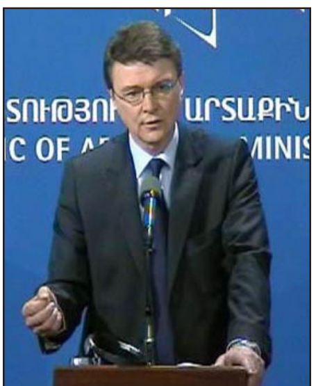
Ազգի խումբի ղեկավար Պէր Սիորգեն

«Եւ-ն Հայաստանը կը դիտէ որպէս տարածաշրջանային կարեւոր երկիր, գործընկեր երկիր, եւ այդ իսկ պատճառով մեզի համար հետաքրքրական է այն իրավիճակը, որ ստեղծուած է Հայաստանի մէջ եւ մենք կարեւոր կը նկատենք