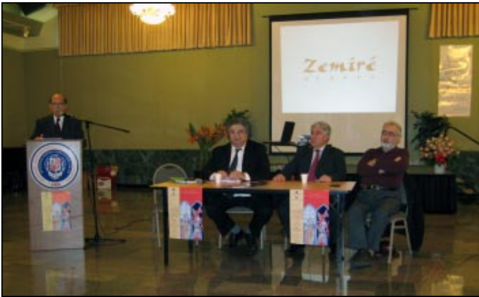
«ԶԵՄԻՐԷ» ԵՐԳԱԽԱՂԻՆ ԸՆԴՀԱՆՈՒՄ ԿԱՏՈՒՄ ԿԱՅԵԼԵԼՈՒ ԿԱՅԵԼԵԼՈՒ

Շաբաթ, Ապրիլ 6-ին, կեսօր-ուայ ժամը 12-ին Փաստինայի Հ.Բ.Լ.Մ.ի Արևք Մանուկեան կեդրոնին մէջ տեղի ունեցաւ խիստ շահեկան մամուլի ասուլիս մը, որուն ներկայ էին Հարաւային Գալիֆորնիոյ հայ մամուլի եւ հեռուստատեսութեան գրեթէ բոլոր ներկայացուցիչները: