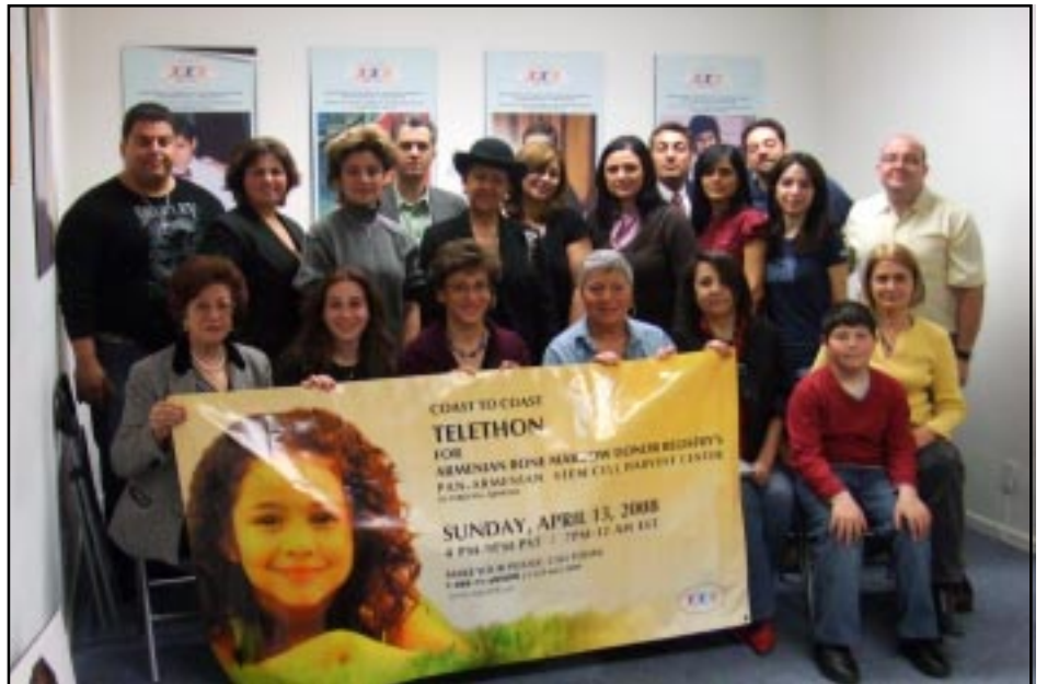
ՀՈՒՆՆԻ «ՀՐԵՇՏԱԿ ՍԸ ԵՂԻՐ, ԿԵԱՆՔ ՍԸ ՓՐԿԷ» ԹԵԼԵՐՈՆԻ ԿԱՄԱԼՈՐՆԵՐԸ

«ՀՐԵՇՏԱԿ ՍԸ ԵՂԻՐ, ԿԵԱՆՔ ՍԸ ՓՐԿԷ» ՔԱՐՈՉԱՐՇԱԲ Ի ՆՊԱՍՏ ՑՈՂՈՒՆԱՅԻՆ ԲՋԻՋՆԵՐՈՒ ՊԱՏՈՒԱՍՏՈՒՄԻ ԿԵԴՐՈՆԻ ԶԻՄՆԱՐԿՈՒԹԵԱՆ