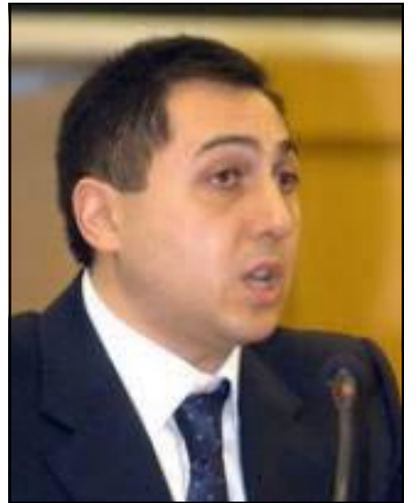
ՀՀ Մարդու իրաւունքների Պաշտպան Արմէն Յարութիւնեան

Հաշուի առնելով այն հանգա- մանքը, որ ըստ պաշտօնական հա- ղորդագրութեան 2008 թուականի Ապրիլի 15-16-ին Ազգային ժողո- վում պատգամաւորների եւ մի- ջազգային փորձագէտների միջեւ տեղի են ունենալու համապատաս- խան դրոյթների քննարկումներ, Մարդու իրաւունքների Պաշտպա- նը նպատակաշարժում է գտնում անդրադառնալ սահմանադրական