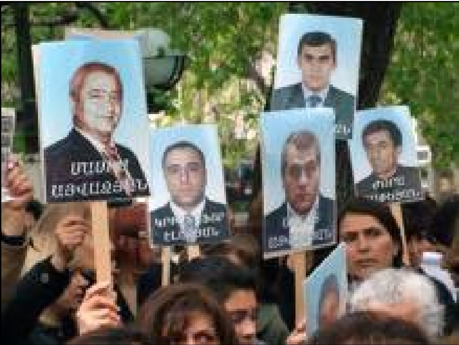
Քաղաքական բանտարկեալներու հարագտները ցոյց կը կատարեն Դատախազութեան շէնքին առջեւ

ԵՐԵՒԱՆ, «ԱՅԲ-ՖԷ»: «Մեզ ձեր ծաղիկները պէտք է: Մեր տղամարդկանց ձերբակալել էք, ու մեզ էլ դեռ համարձակուում էք ծաղիկ տալ: Ձեր լիտիութիւնը չափ ու սահման չունի: Էս ծաղիկները կը տաք Սերժին ու Ռոբերտին: Այսօր նրանց տօնն էր, նրանք, որ տղամարդ լինէին, մեր տղամարդկանցից չէին վախենայ եւ ձերբակալի», - նման խօսքերով ՀՀ Գլխավոր դատախազութեան մօտ Ապրիլ 7-ին հաւաքուած Տէր-Պետրոսեանի թիմի ձերբակալուածները հարագտներն ու համախոհները մայթերին նետեցին՝ Գլխավոր դատախազ Աղուան Յովասէփեանի ուղարկած ծաղիկները «Ազատութիւն քաղաքացիականներին» պատանուներով եւ բոլոր ձերբակալուածների դիմանկարները ձեռքերին, գրեթէ բոլորը սեւ հագուստով եւ գլխաշորերով դատախազութեան շէնքի մօտ բողոքի ցոյց էր կազմակերպուել: Իրենց նամակը նրանք հնարաւորութիւն չունեցան առձեռն յանձնել գլխավոր դատախազին: «Մեզ նոյնիսկ ընդունարան թոյլ չտուեցին մտնել: Ասացին, որ դիմումը գցենք արկղը եւ հեռանանք», - ասաց դատախազութեան շէնք մտած կանանցից մէկը: