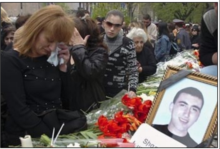
Միասնիկեանի արձանի մօտ հայ կանայք կը սգան Մարտ 1-ի գոհերը

Արձանի շուրջ մեծ էր ոստիկաններու թիւը, որոնք