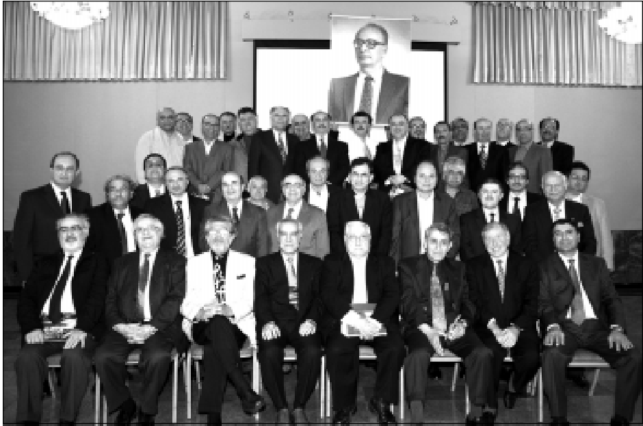
Յովակիմեան-Մանուկեան Վարժարանի շրջանաւարտներէն խումբ մը