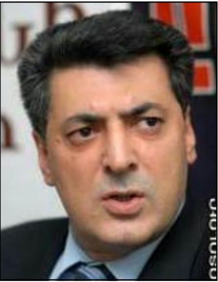
ՀԺԿ առաջնորդ Ստեփան Դեմիրճեան

ԵՐԵՒԱՆ, «ԱՅԲ-ՖԷ»: «Իշխանութիւնները պէտք է շահագրգիռ լինեն՝ համապատասխան քայլերով շահելու ժողովրդի վստահութիւնը: Պէտք է հասկանան՝ ունենալու մեթոդներով այս ճգնաժամն յաղթահարել ուղղակի անհնար է», - յայտարարեց ՀԺԿ առաջնորդ Ստեփան Դեմիրճեանը: Իսկ երկխօսութեան համար, ըստ նրա, հարկաւոր են նպաստաւոր պայմաններ: «Առաջնահերթ խնդիր ենք համարում՝ դադարեցնել քաղաքական հետապնդումները, ազատ արձակել քաղաքացիականներին, թուլացնել լարուածութիւնը, քրէական յանցանք կատարած անձանց տարանջատել իրենց քաղաքական դիրքորոշումն արտայայտող մարդկանցից: Թէ Ազդի խումբը, թէ Եւրոխորհուրդը պահանջում են նաեւ վերանայել հանրահաւաքների, երթերի մասին օրէնքում կատարուած փոփոխութիւնները: Բնականաբար երկխօսութիւնը չպէտք է դառնայ ինքնանպատակ կարգախօս, պէտք է ձեւաւորուի յստակ օրակարգ», - կարծում է Դեմիրճեանը՝ աւելացնելով, որ այդ ճգնաժամը պէտք է հանգուցալուծուի նոր ընտրութիւնների միջոցով: Ըստ նրա՝ արտահերթ խորհրդարանական ընտրութիւնների անցկացումը տրամաբանական պահանջներից մէկն է, քանի որ «խորհրդարանում ակնյայտօրէն չեն արտացոլում հասարակական տրամադրութիւնները»: Իշխանական կողմից ձեւաւորուած պաթիւնավտանգ եւ լարուած իրավիճակի խնդիրը, Դեմիրճեանի համոզմամբ, չի լուծուած: «Պէտք է ինքնախաբէութեամբ զբաղուել, թէ իբր իրենք վայելում են հասարակութեան 70-80 տոկոսի աջակցութիւնը: Անձերի պայմանաւորուածութիւնը պէտք է ներկայացնել որպէս ազգային համաձայնութիւն: Իրական երկ-