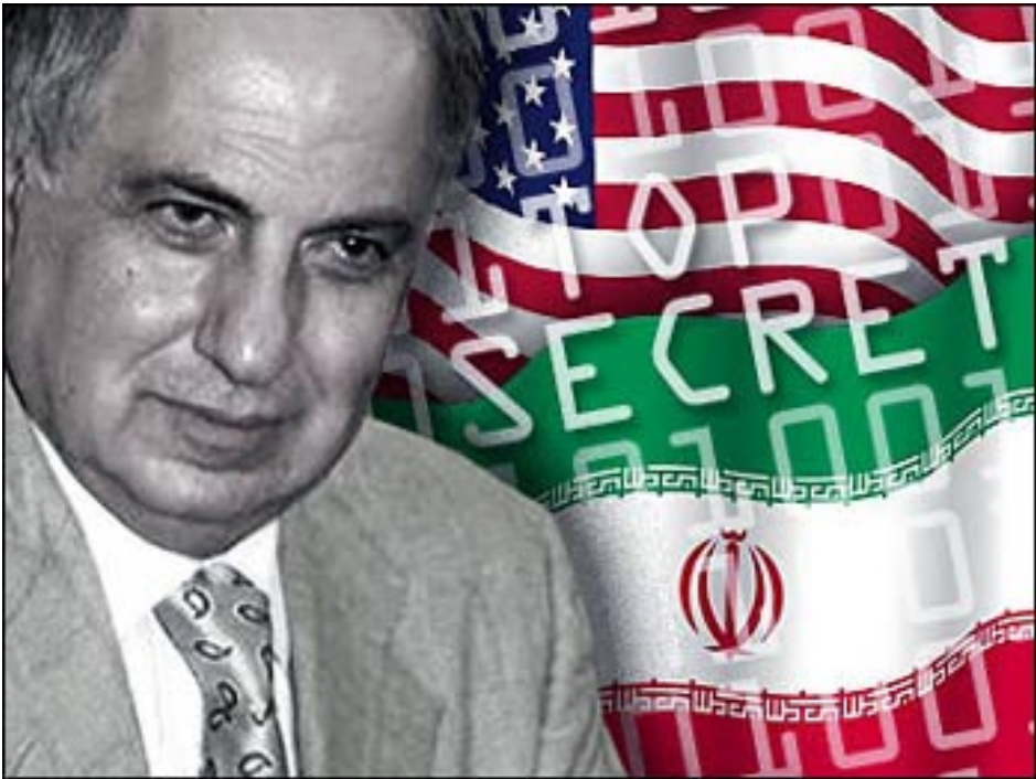
Ահմէտ Չեյեպի՝ լրտես կամփառագետ...

Վերադառնանք սկզբնական հարցումին, թէ ինչպէս նախագահ Պուշ եւ իր խորհրդականները «խաբուեցան» եւ ո՞վ զիրենք իս-