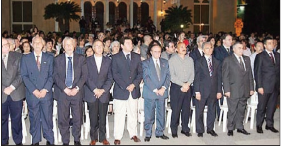
Տեսարան մը Անթիլիասի Մայրավանքէն մերս տեղի ունեցած հանդիսութենէն

Հինգշաբթի, Ապրիլ 23-ի երեկոյան, Հայոց Ցեղասպանութեան ոգեկոչման Լիբանանի Կեդրոնական Մարմինի կազմակերպութեամբ, Անթիլիասի Մայրավանքէն ներս տեղի ունեցաւ ժողովրդային հաւաք: