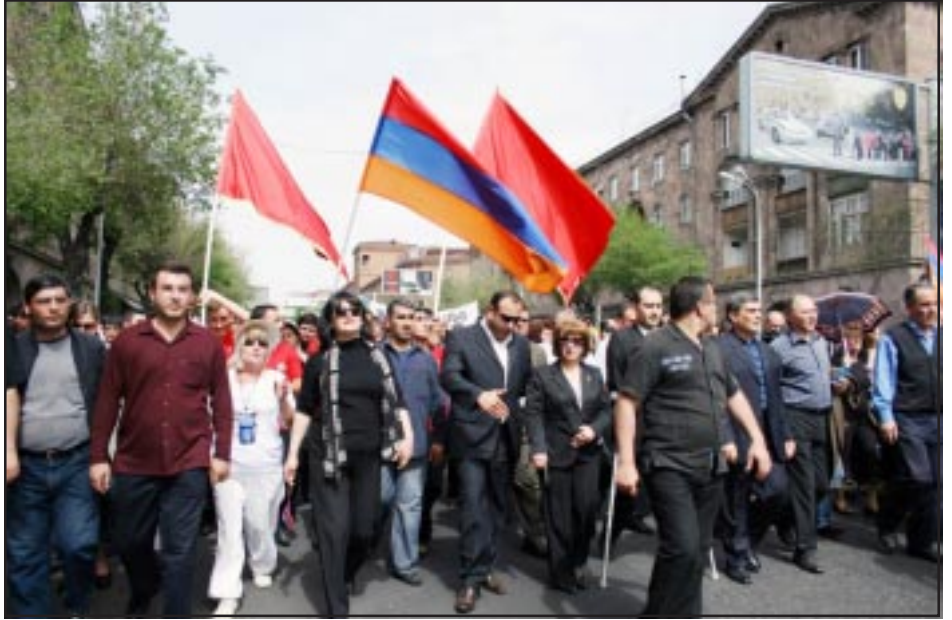
Երթ դէպի Ծիծեռնակաբերդի յուշահամալիր: Առաջնորդութեամբ «Համաժողովրդական Շարժման» ղեկաւարութեամբ

Գարեգին Բ.-ի առաջնորդութեամբ: Անմար կրակի առջեւ վեհափառ Հայրապետը կատարեց հոգեհանգստեան արարողութիւն՝ Մեծ Եղեռնի զոհերու լիշատակին: