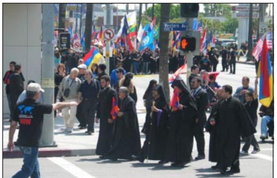
Հռիփվուտի «Փոքրիկ Հայաստան» շրջանին մէջ տեղի ունեցած Երիտասարդական ցոյցը

Ամերիկահայութիւնը բազմաթիւ միջոցառումներով եւ տարբեր բնույթի հանդիսութիւններով ոգեկոչեց Հայկական Յեղասպանութեան 93-րդ տարելիցը: