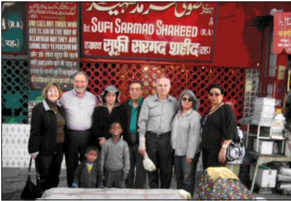
The traveling group in front of the entrance to the tomb of Saint Sarmad, a Muslim poet of the 17 th century who was born Armenian

CALCUTTA, INDIA -- India is an amazing country which has contributed its share of culture, architecture, religion and history to the world. Everyone should have the chance to visit this historical place to see with their own eyes the old cultural sights. But all of this aside, one should remember that India is also dear to the hearts of Armenians. Many have established their lives there and built churches, schools, printing presses and clubs to keep alive the Armenian spirit.