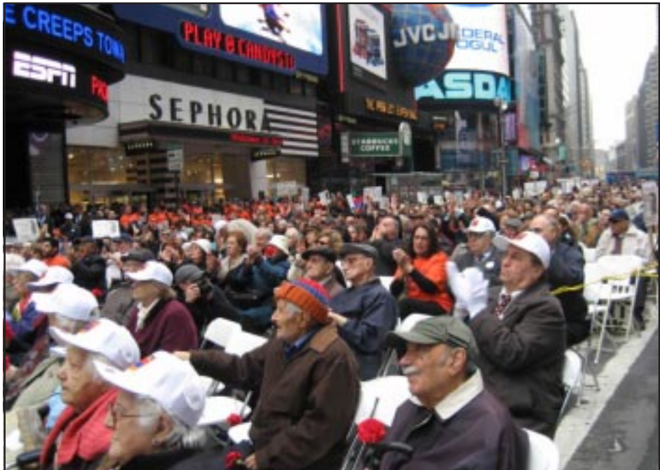
Նիւ Եորքի Թայմզ հրապարակի յիշատակի հանդիսութիւնը

Յուշարձանին ծաղկեպսակներ գետեղեցին Ս.Դ.Հնչակեան Կուսակցութեան, Լեւոն Տէր-Պետրոսեանի Լոս Անճելըսի շտապի, Հայ Ամերիկեան Խորհուրդի եւ Յանուն ժողովրդավար Հայաստանի կազմակերպութեան ներկայացուցիչները: