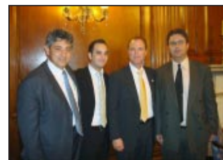
ACA representatives with Congressman Adam Schiff

The April 23rd observance was presided over by the Co-Chairmen of