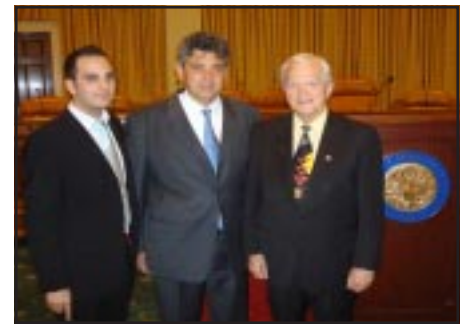
ACA representatives with Congressman Joe Knollenberg

Speaker Pelosi reaffirmed her commitment to this critical human