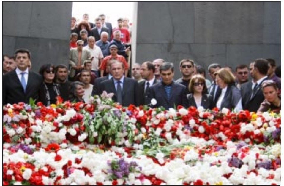
Եղեռնի զոհերուն յարգանք կը մատուցեն ժողովրդային շարժումի ղեկավարները. ճախէն աջ՝ Ստեփան Դեմիրճեան, Լեւոն Տէր-Պետրոսեան, Արամ Սարգսեան, Լիւսմիլա Սարգսեան, Տիկ. Տէր-Պետրոսեան եւ ուրիշներ

Երբ բազմութիւնը անցաւ Կիւրեան կամուրջը եւ թեքուեցաւ դէպի Ծիծեռնակաբերդի բարձունք տանող ճանապարհի սկզբնաւորութիւնը ժողովուրդին միացաւ Հայաստանի առաջին նախագահ Լեւոն Տէր-Պետրոսեանը: Բացա-