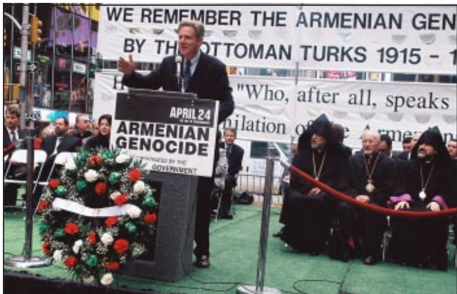
Congressman Frank Pallone delivering his speech

We will demand restitution and compensation to pay for physical and emotional pain, grief, and suffering.