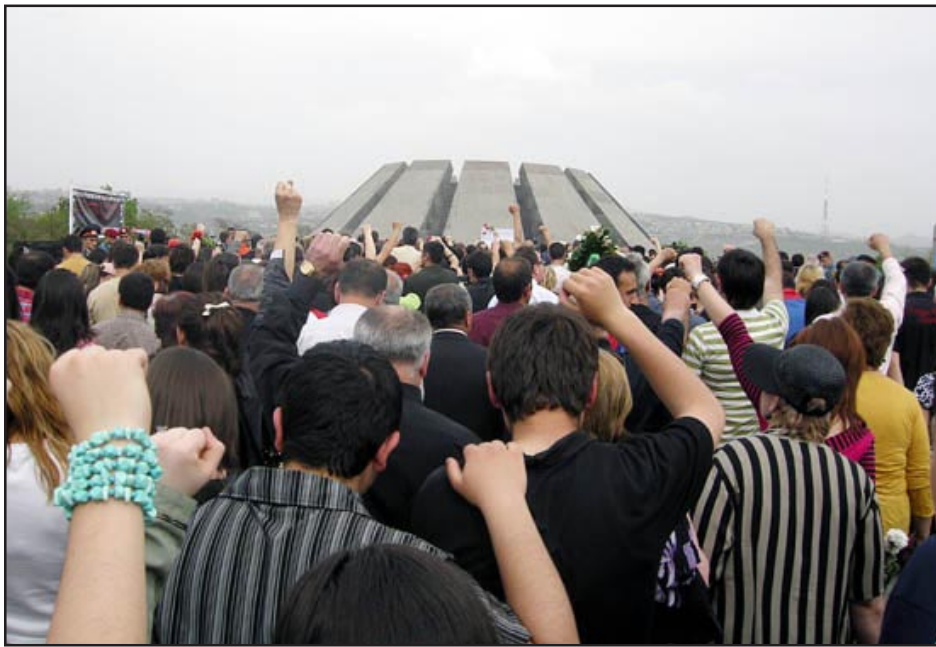
Opposition supporters at the Genocide Memorial

YEREVAN -- Hundreds of thousands of people silently marched to the hilltop genocide memorial in Yerevan on Thursday to pay their respects to more than one million Armenians massacred in Ottoman Turkey from 1915-1918.