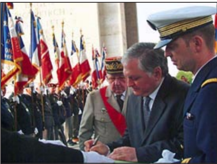
Հայաստանի արտգործնախարար էդուարդ Նալբանդեան ստորագրում է Յիշատակի Ոսկէ մատենանում

«ԱԶԱՏՈՒԹԻՒՆ ՌԱՏԻՕ»: Հայոց Ցեղասպանության զոհերի լիշատակի հանդիսաւոր արարողութիւն է կայացել Ապրիլ 23-ի երեկոյան Փարիզի Յողթական կամարի տակ՝ Հայաստանի արտգործնախարար էդուարդ Նալբանդեանի մասնակցութեամբ: