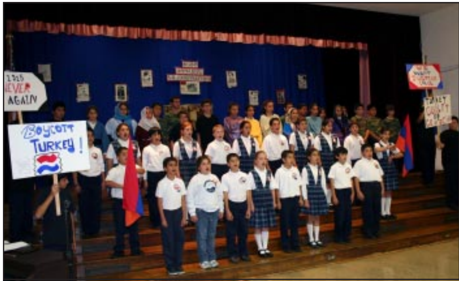
Իր պատկանելիութեան գիտակից եւ իրաւունքներու տէր մտք սերունդը

Յետ պատարագի աշակերտները, սկսեալ մանկամտուրի մանուկներէն մինչեւ ութերորդ դասարանի պատանիները, լուռ քալե-