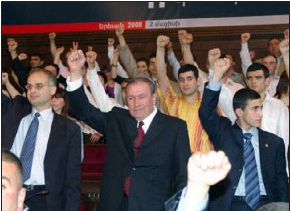
Լեւոն Տէր-Պետրոսեան եւ Գոնկրէսի մասնակից երիտասարդները բռուցցնեցին վեր

Ելոյթ ունեցան առաջին նախագահին սատարող գրեթէ բոլոր ուժերու ներկայացուցիչները, որոնց շարքին ՀԺԿ առաջնորդ Ստեփան