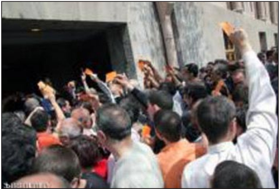
Գոնկրէսի մասնակիցները կը փորձեն մուտք գործել դահլիճ

կայն, այդ երկխօսութիւնը դիտելով ոչ թէ որպէս կողմերից մէկին ծնկի բերելու միջոց, այլ որպէս երկրում իրական բարեփոխումներ իրականացնելու եւ քաղաքական գործունէութեան նորմալ դաշտ ստեղծելու պատեհութիւն: Դրա համար անհրաժեշտ է, որ Հայաստանի կառավարութիւնը նախ եւ առաջ լիապէս կատարի Եւրախոր-