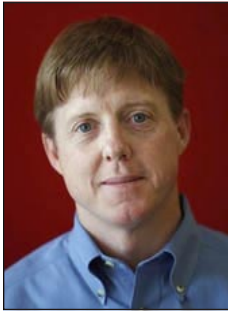
Congressman Don Cazayoux

won a special election in Louisiana, replacing retired republican Congressman Baker, making him the first Democrat in three decades to represent the state's 6th District.