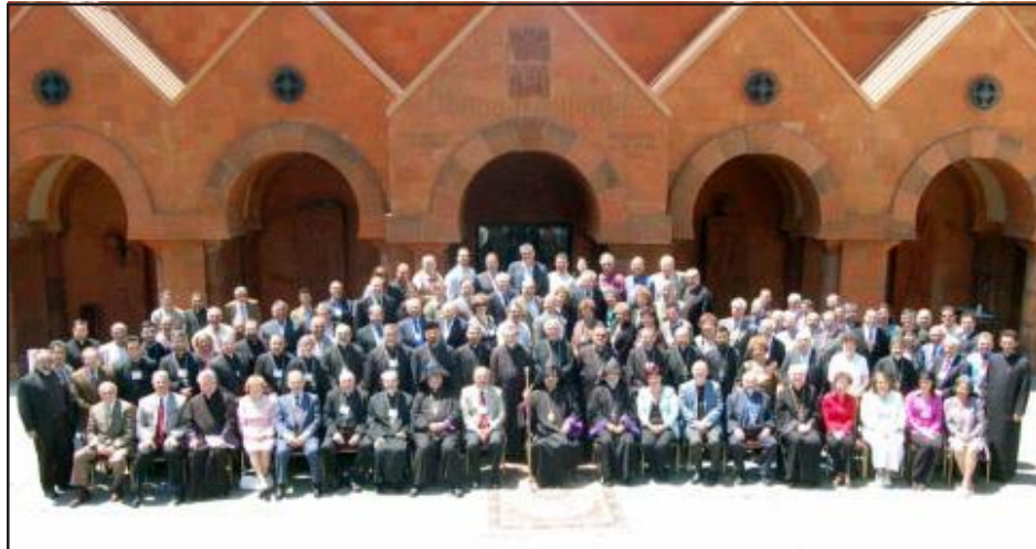
Թեմական 81րդ Պատգամաւորական ժողովի մասնակիցները

նագրութիւնը: Ատենապետի հրաւերով, Քահանայութեան Թեկնածու՝ Բրշ. Արսէն Սրկ. Հայրապետեան կարդաց Ն.Ս.Օ.Տ.Տ. Գարեգին Բ. Ամենայն Հայոց Կաթողիկոսին պատգամը: Պատգամաւորները յոսնկայս եւ ամենայն երկիւղածութեամբ ունկնդրեցին Վեհափառ Հայրապետին քաջալերական պատգամը: Նորին Սրբութեան պատգամին Անգլերէն թարգմանութիւնը կարդաց Քահանայութեան Թեկնածու՝ Բրշ. Գրիգոր Սրկ. Աւագեան: Օրուան Հոգեւոր Պատգամը