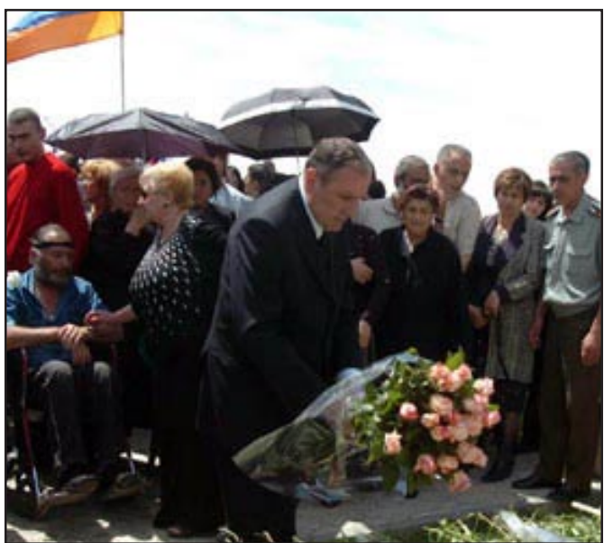
Լեւոն Տէր-Պետրոսեան վարդեր կը գետնէ վազգէն Սարգսեանի շիրմաքարին

Մայիս 8-ին Հայաստանի մէջ նշուեցաւ Երկրապահի օրը եւ այս առթիւ Երաբլուր այցելեցին համաժողովրդական շարժման առաջնորդները՝ Լեւոն Տէր-Պետրոսեան, Արամ Սարգսեան, Ստեփան Դեմիրճեան, Լիւտմիլ Սարգսեան եւ այլ կուսակցութեանց ղեկավարները, ինչպէս նաեւ Երկրապահ Կամաւորական Միութեան, երիտասարդական եւ կանանց կազմակերպութիւններու անդամները: