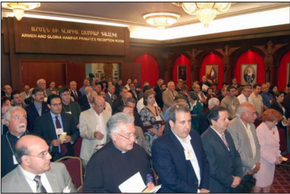
Պատգամաւորական Ժողովի Նիստերու ընթացքին

Թեմական Խորհուրդի կողմէ առաջարկ մը ներկայացուեցաւ, որ բացի եկեղեցոյ շէնքերէն, իւրաքանչիւր Ծուխի ա՛յլ կալուածները պատշապանելու եւ ապահով պահելու համար օրինական միջոցներու դիմ-