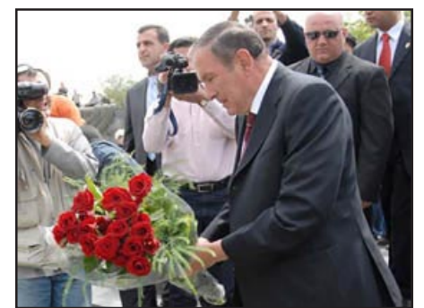
Levon Ter-Petrosian laying a wreath at the monument

The number of Armenian war veterans has been shrinking rapidly and, according to the Ministry of Labor and Social Affairs, currently stands at ap-