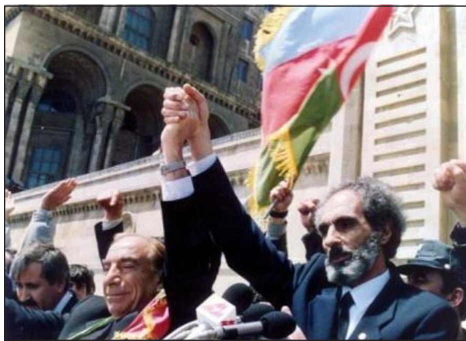
The leader of the Turkish Fascist and Turkist Party Alparslan Turkes and E. Elcibey together on the "Liberation Square" in Baku on 3 May 1992

cities in Azerbaijan Pogroms against Armenians were instigated. These events were described in the Western press as "nationality conflicts" or "national disturbances between Islamic Azerbaijani and Christian Armenians". In reality, these incidents were nothing short of a one-sided war against the Armenian population. The Pogroms were not just spontaneous attacks of Azerbaijani against their Armenian neighbors, but the start of a planned campaign, organized and led by the authorities and nationalistic circles, against all Armenians living in Azerbaijan and Mountainous Karabakh. A repeat of the events which occurred under the Young Turk regime Seventy years ago, which in turn was a continuation of the policy beginning in