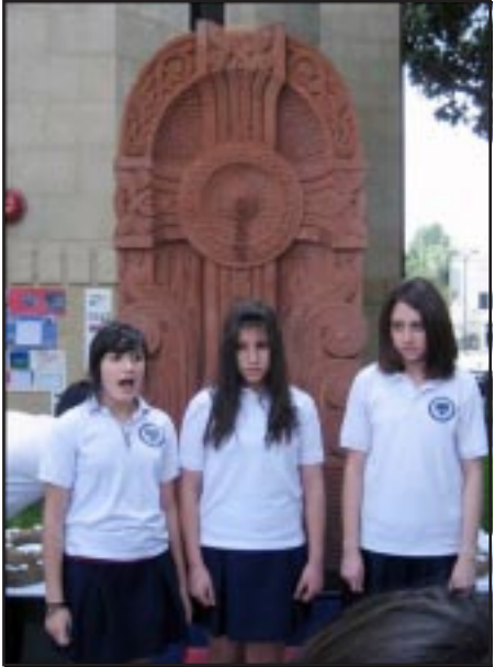
Աշակերտներու հաւաքը Սուրբ Գրիգոր Լուսաւորիչ եկեղեցւոյ շրջափակին մէջ

Ապրիլ 23ի ամբողջ օրուան ընթացքին աշակերտութիւնը տարբեր եւ իւրաքանչիւր ձեռնարկներու ներկայ գտնուեցաւ: Առաւօտեան ժամը 9:30էն մինչեւ ժամը 12 մանկապարտէզէն-Դ. կարգերու աշակերտները այցելեցին Մոնթեպելլոյի Հայկական Յեղասպանութեան յուշար-