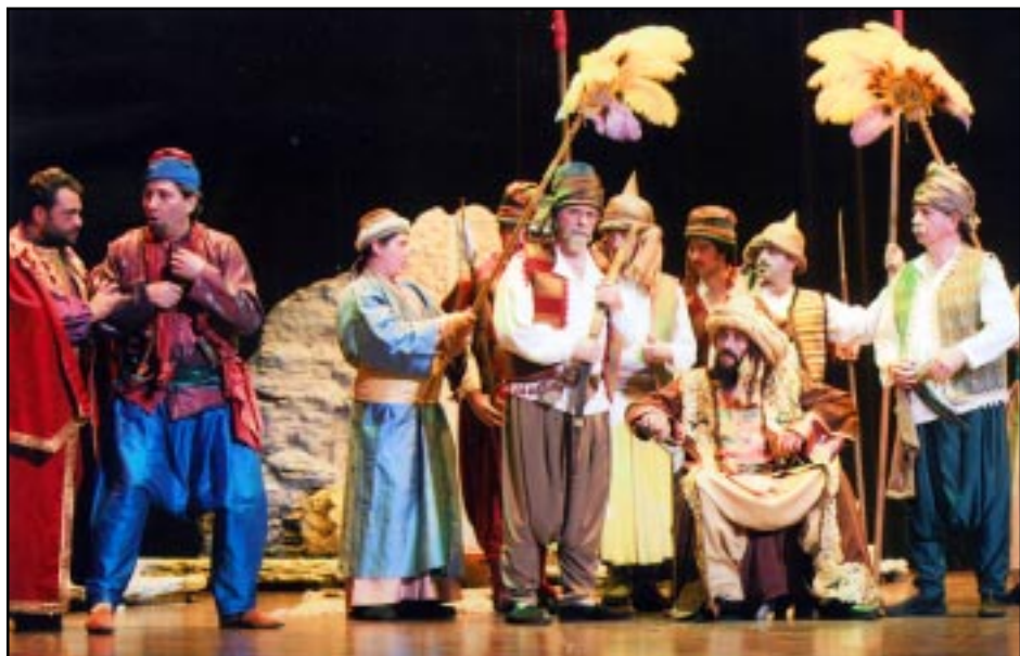
Տեսարան մը «Զեմիրէ» օփերայի ներկայացումէն

Անցնող շաբաթավերջին Լոս Անճելըսի մէջ ներկայացուեցաւ Պոլսահայ մեծ երգահան Տիգրան Զուխաճեանի «Զեմիրէ» օփերան, բարձրորակ արուեստի վայելք մը շնորհելով հազարաւորներու, որոնք երեք օրերու վրայ եկան լեցնելու «Փասատինա Սիվիլք Օտիթորյում»-ի հսկայ սրահը: