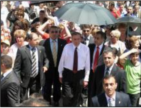
Լեւոն Տէր-Պետրոսեան Մարդարայատ կատրած այցի ընթացքին

«ԱԶԱՏՈՒԹԻՒՆ ՌԱՏԻՈՅ»: Հայաստանի առաջին նախագահ, Համաժողովրդական Շարժման նախաձեռնող եւ առաջնորդ Լեւոն Տէր-Պետրոսեանը, դիմելով իր աջակիցներին, յորդորեց «Կանգնել մինչեւ վերջ»: