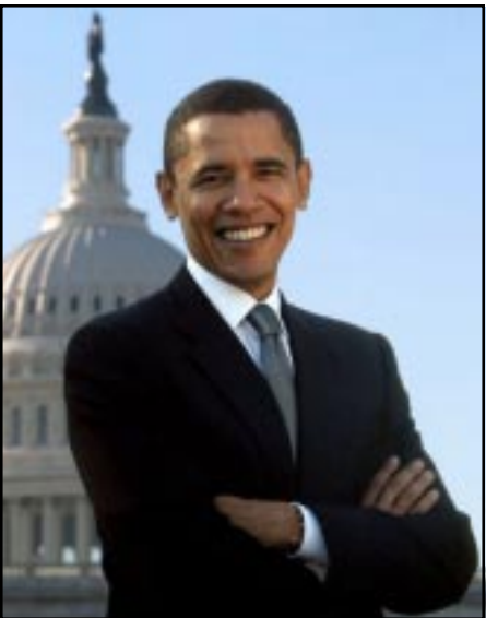
Ամերիկայի նախագահի թեկնածու Պարաֆ Օպամա

Հարաւային Տաքսիդի եւ Մոնթանայի մէջ տեղի ունեցած քուէարկութիւններով, Յունիս 3-ին աւարտեցաւ Դեմոկրատ կուսակցութեան նախնական երկարատեւ ընտրարշաւը եւ Պարաք Օպամա ստանալով իր կուսակ-