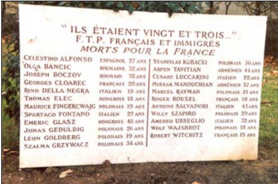
Ֆրանսայի համար նահատակ Միսաք Մանուշեանի եւ իր 22 հերոս ընկերներուն և նուիրուած յուշատախտակը՝ Լիոնի մուտքին

շատ Տեսինի կողքին: Այս աւանին մէջ ալ, ինչպէս Լիոնի կեդրոնական հրապարակին վրայ՝ կառուցուած են Հայոց Յեղասպանութեան նուիրուած Յուշարձաններ, արդիական ոճով: