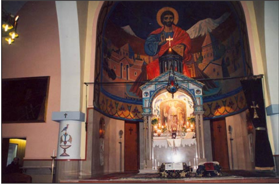
Լիոնի Հայոց Առաջնորդարանի Մայր Տաճարը

Թեամբ Ֆրանսայի Ազգային հերոս-նահատակ՝ Միսաք Մանուշեանին: Անոր եւ Արքէն Դաւիթեանին ու զէնքի ընկերներուն նուիրուած յուշարձանակոթողը տեղադրուած է Լիոն քաղաքի մուտքին, հայա-