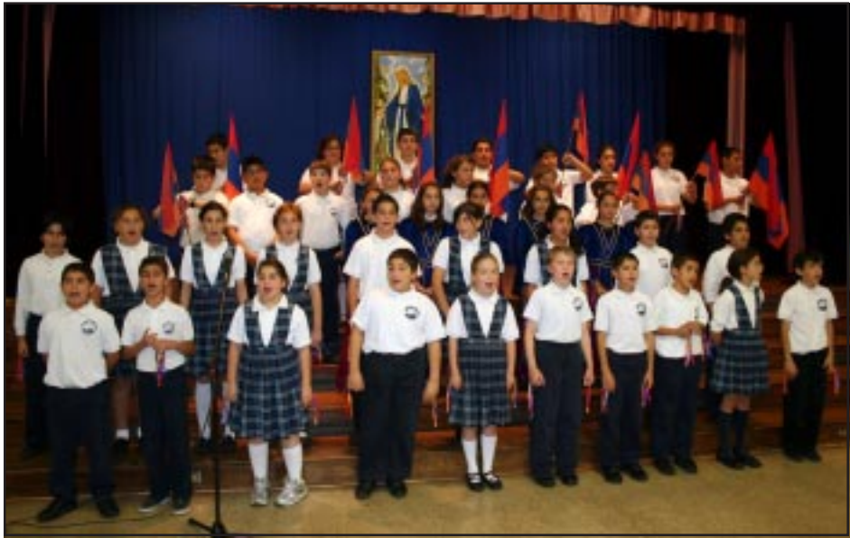
Հինգերորդ եւ վեցերորդ դասարանի աշակերտներ երգով ու ասմունքով կը պանծացնեն եռագոյն դրօշը

յարգանքի... Յաջորդ բաժինը, որ տրամադրուած էր նախակրթարանի եւ միջնակարգի մեծ ծնողաց, սկսաւ 10:30ին եւ չաւարտեց որոշուած ժամուն՝ 12ին, այլ շարունակուեցաւ եւ դարձաւ իսկական հայկական փառատուն: Երաժշտութիւն, երգ, պար, նուագ, ասմունք, ներկայացում, ամէն տեսակ արուեստի գործեր կային եւ մեծ բծախնդրութեամբ ու սիրով կը մատուցուէին մեծ ծնողներուն. կարծես անոնց աչքերու մէջէն շողացող երջանկութիւնը մակնիսացուցած էր անոնց թոռները որոնք ի յայտ կը բերէին իրենց ձիւքերը գերազանցելով զիրար: