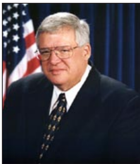
Former House Speaker Dennis Hastert

During his tenure as Speaker of the House (1999-2006), Hastert pulled an Armenian Genocide resolution from the House floor following a request by then President William Clinton in 2000. A 2005 Vanity Fair article alleged that Hastert received funds from Turkish groups and nationalists, in exchange