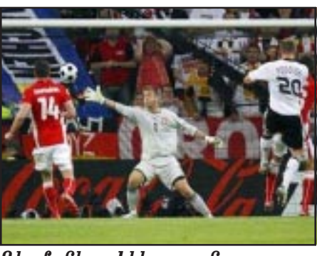
Գերմանիա - Լեհաստան