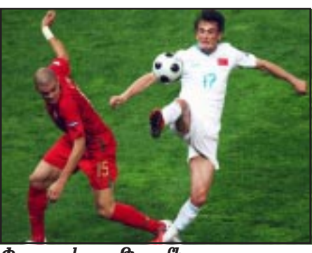
Փորթուկալ - Թուրքիա