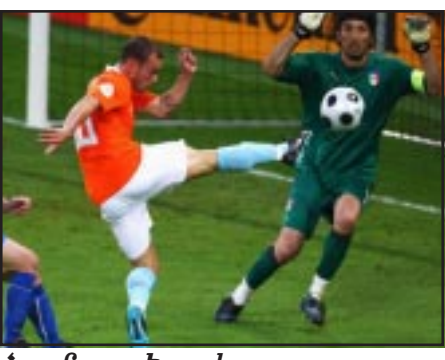
Հոլանտա - Իտալիա