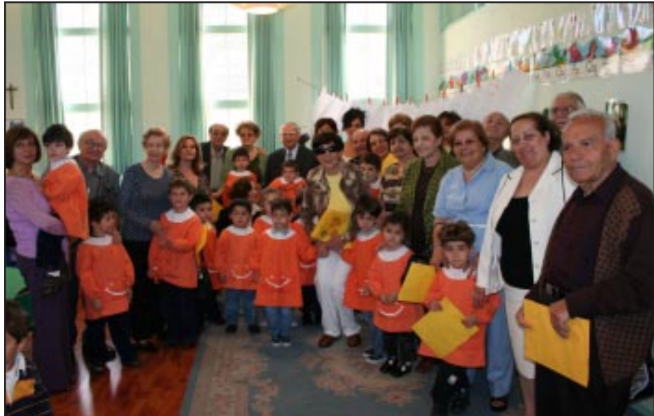
Մանկապարտէզի փոքրիկներ իրենց մեծ ծնողներուն հետ մարմնագոյն դասարան

Ուրախութիւնը արեւի նման պայծառացուց անոնց աչքերը, երբ մանկացած, ինքնամոռաց անոնք պատիկ թաթիկները բռնած իրենց թոռներուն՝ ուղղուեցան դասարանները, պահ մըն ալ դասարաններու մէջ զիրենք վայելելու եւ տարիներու ծանր լուծը թօթափած իրենց ժպիտը խառնելու այդ անմեղ ժպիտներուն... իրաւունք ունիք մեծ հայրեր եւ մեծ մայրեր պատիւը ձեռն էր այդ օր, արժանի էք պատուի, արժանի էք