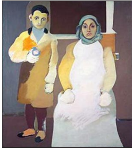
Arshile Gorky's "The Artist and His Mother," on loan from the Whitney Museum of American Art, will be on display at the Diocesan Center on Thursday, June 19.

An opening-night concert featuring renowned Armenian-American art-