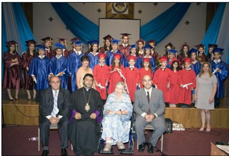
«Ա. և Մ. Յովսէփեան» վարժարանի շրջանաւարտները

Սուրբ Գրիգոր Լուսաւորիչ եկեղեցւոյ «Ա. և Մ. Յովսէփեան» վարժարանի Մանկապարտէզի, Ե. և Ը. կարգերու վկայականաց բաշխումը տեղի ունեցաւ Շաբաթ, Յունիս 21-ին, երեկոյեան ժամը 6ին, Փասատինայի Հ.Բ.Ը.Մ. «Մարի Մանուկեան» երկրորդական վարժարանին սրահին մէջ: