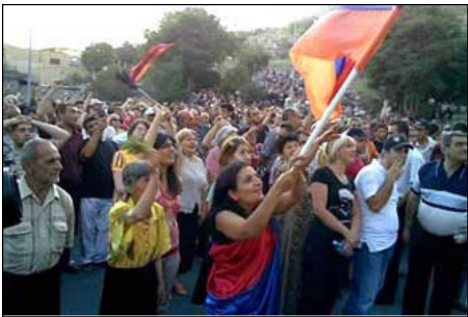
Բազմահազար ժողովուրդ մասնակցեցաւ ընդդիմադրութեան հերթական հանրահաւաքին ու անոր յաջորդած երթին

Այս առթիւ, «Մասիս» խստօրէն կը դատապարտէ այս արարքի պատասխանատուները եւ իր գորակցութիւնը կը յայտնէ Պր. Յովսէփեանին: