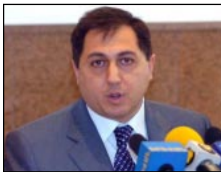
Armenia's human rights obudsman Armen Harutiunian

Despite the "no problem" assurances from the Ombudsman's Office, in an interview to the pro-opposition