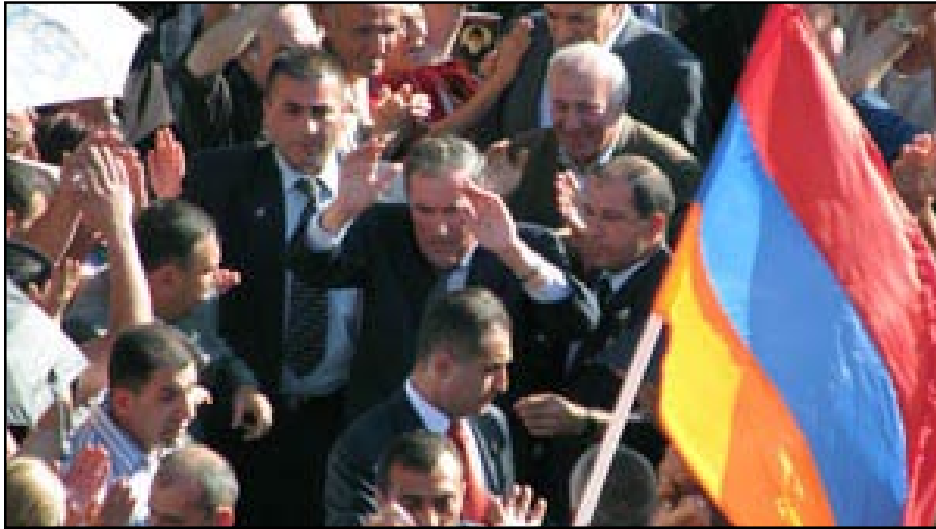
President Levon Ter-Petrosian saluting flag waving Popular Movement supporters

Armenia's main opposition alliance led by first president Levon Ter-Petrosian announced a renewed campaign of daily anti-government protests late Friday as thousands of its supporters marched through central Yerevan four months after the violent suppression of their post-election demonstrations.