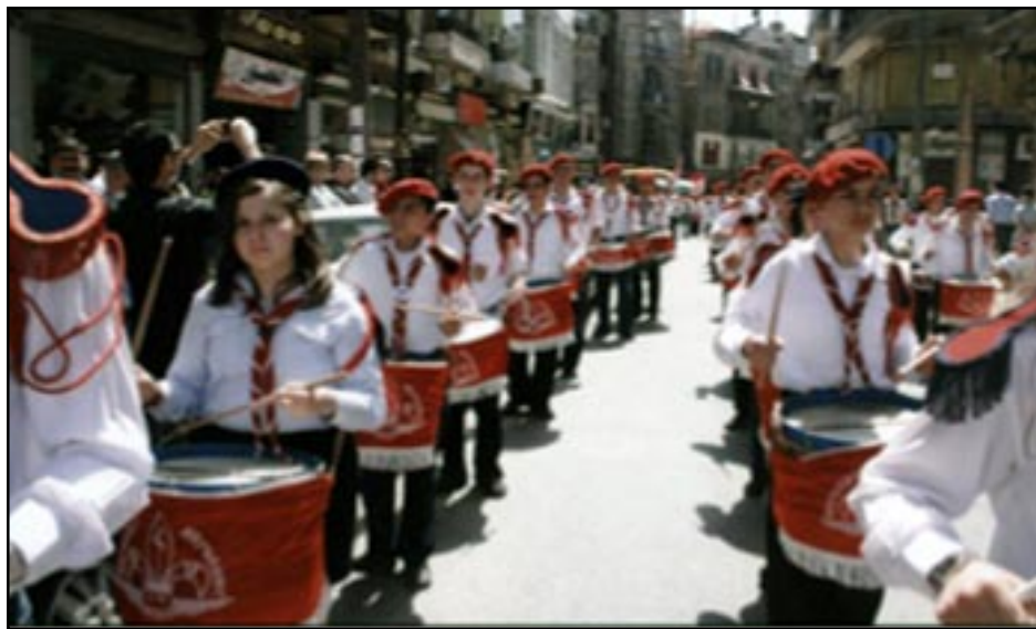
Շ.Մ.Մ.-ի Փողերախումբը ելոյթի պահուն