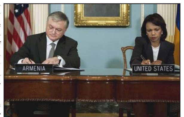
Eduard Nalbandian and Condoleezza Rice

Those efforts will boost Armenia's capabilities “to prevent, detect, and respond effectively to attempts to smuggle nuclear or radioactive materials,” the department said in a statement. “It specifies twenty-eight agreed steps that the two governments intend to be taken for this purpose.” read the statement. “This assistance would complement and be carefully coordinated with the aid the Republic of Armenia is already receiving from