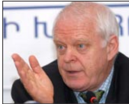
CE commissioner for human rights Thomas Hammarberg