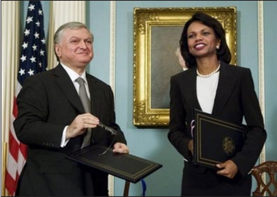
ԱՄՆ պետքարտուղար Կոնդոլիզա Ռայսը եւ ՀՀ արտաքին գործոց նախարար Էդուարդ Նալբանդեան Ուաշինգթոնի մէջ տեղի ունեցած հանդիպումի ընթացքին

ԵՐԵՒԱՆ, «ԱՅԲ-ՖԷ»: Պետքարտուղար Կոնդոլիզա Ռայսն ու ԱՄՆ-ում գտնուող ՀՀ արտգործնախարար Էդուարդ Նալբանդեանը ստորագրել են Հայաստանի Հանրապետութեան կառավարութեան եւ Ամերիկայի Միացեալ Նահանգների կառավարութեան միջեւ միջուկային ու ռադիոակտիւ նիւթերի մաքսանենգ փոխադրումների դէմ պայքարի ոլորտում համատեղ գործողութիւնների ծրագիրը: