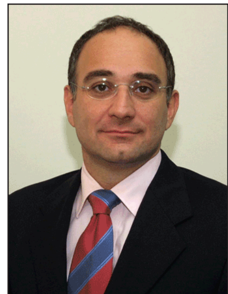
Ռեժանիթի եւ ջուրի նախարար Ալան Թապուրեան

Խորհրդարանական մեծամասնութեան մաս կազմող Ժան Օղասապեան նշանակուած է Պետական նախարար, իսկ ընդդիմադրութեան