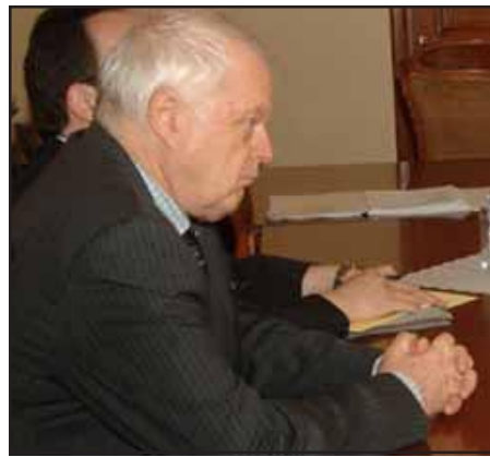
ԵԽ-ի մարդու իրաւունքի յանձնակատար Թ. Համարպրկ մամուլիսի ընթացքին

Թոմաս Համարպրկ յայտնեց, որ իր հանդիպումներու ընթացքին երկար քննարկում ունեցած է, թէ արդեօ՞ք բանտերու մէջ գտնուողները քաղաքական բանտարկեալ են: «Ես մտահոգութիւն արտայայտած եմ այդ կա-