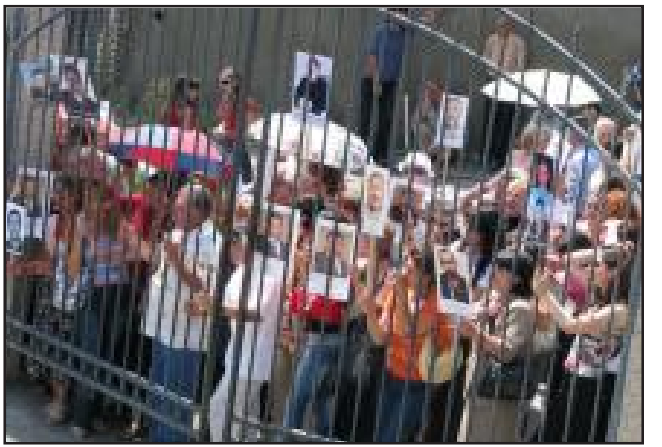
Ցուցարարներ Եւրոպայի խորհրդի երեսնի պերկի հանդիպումը հայաստանեան հասարակական կազմակերպութիւնների հետ: Ցուցարարներ Եւրոպայի խորհրդի երեսնի պերկի հանդիպումը հայաստանեան հասարակական կազմակերպութիւնների հետ:

ԵՐԵՒԱՆ, «ԱՅԲ-ՖԷ»: «Ազատութիւն քաղաքատարկեալներին», «Ազատ, անկախ Հայաստան», «Անտրժ, անոռք Հայաստան», - այս վանկարկումները երկուշաբթի կէսօրին լսում էին Եւրոպայի խորհրդի գրասենեակի դիմաց, որտեղ տեղի էր ունենում Եւրոպայի խորհրդի մարդու իրաւունքների յանձնակատար թոմաս Համմար-Յաթանեանի հասարակական կազմակերպութիւնների հետ: «Հայոց Կանանց Շարժումը», որոնց ներկայացուցիչներից շատերի ամուսինները կալանաւորուած են, ԵՄ գրասենեակի մուտքի առջեւ ամուսինների նկարները պարզած, ցանկանում էին գրաւել Համմարպերկի ուշադրութիւնը: «Tomas, help us» / «Թոմաս, օգնիր մեզ»/, - վանկարկում էին կանայք: Մօտ կէս ժամ անց Շուշիի առանձնակի գումարտակի հրամանատար ժիրայր Սեֆրիւեանին չաջողուեց հանդիպել ԵՄ մարդու իրաւունքների յանձնակատարի տեղակալի հետ: