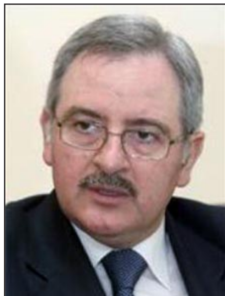
Պետական նախարար Ժան Օղասապեան

Մեծամասնութեան եւ ընդդիմադրութեան միջեւ ամիս ու կէս տեւող բանակցութիւններէ ետք, Յուլիս 12-ին Լիբանան ունեցաւ իր նոր՝ ազգային միասնականութեան կառավարութիւնը: