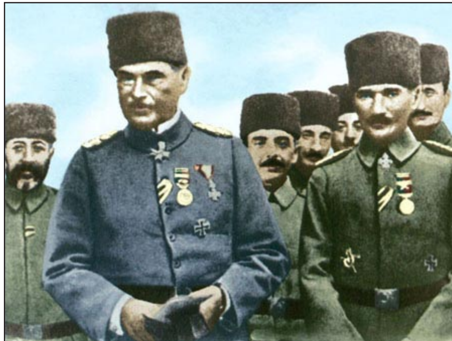
Marshal Liman von Sanders Chief of the German Military Mission in the Ottoman Empire. He prevented the deportation of Armenians from Smyrna

militaire“. That is in accordance with the agreements made between Minister of War Enver Pasha and the Head of the German Military Mission Liman von Sanders. To rid all doubt that the Turks through this formulation might deviate from the German wishes, Hans von Wangenheim wrote underneath the returned final version of the con-