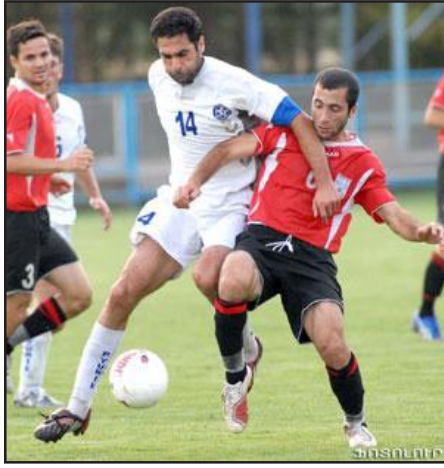
«Փիլնիկ» – «Արարատ»

Ֆուտբոլի Հայաստանի առաջնությունում կայացրան 14-րդ տուրի հանդիպումները: Տուրի կենտրոնական հանդիպումը տեղի ունեցավ «Փիլնիկ» մարզադաշտում, որտեղ ախոյեան «Փիլնիկ»ը 1:0 հաշվով առաւելութեան հասավ առաջատար «Արարատ»ի նկատմամբ: Ընթացիկ մրցաշրջանում սա «Փիլնիկ»ի առաջին յաղթանակն էր արարատցիների նկատմամբ: