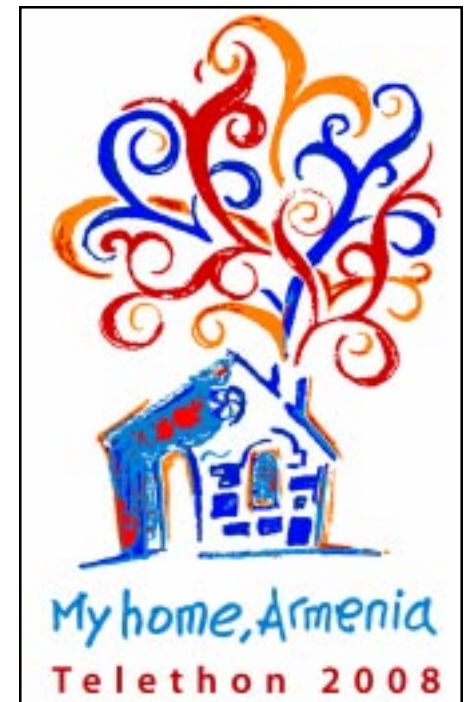
Telethon 2008 "My Home, Armenia" logo unveiled

only focus on infrastructure and rural development, but continues to provide monetary assistance to the families and children affected from the war.