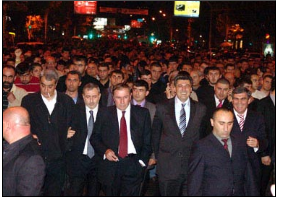
Ընդդիմադրութեան դեմադրանքներ՝ Լեւոն Տէր-Պետրոսեանի գլխաւորութեամբ, կ'առաջնորդեն Երեւանի մէջ տեղի ունեցած հսկայ ցույցը

«Իշխանութեան համար մղուող քաղաքական պայքարում ամէն ինչից վեր դասելով ազգային եւ պետական շահը, ես յայտարարել էի, որ Ղարաբաղի դէմ ռազմական սպառնալիքի առաջացման դէպքում կոչով կը դիմեմ Համաժողովրդական շարժման մասնակիցներին, խնդրելով ժամանակաւորապէս դադարեցնել իրենց գործողութիւնները եւ լծուել համազգային պայքարի նուիրական գործին: Ղարաբաղեան հակամարտութեան մտաւորութիւնը հանրապարտութեան մտաւորութիւնը չէ, իր պարունակած վտանգներով հաւասարազօր լինելով ռազմական սպառնալիքի, կարծում եմ, հրատապ է դարձնում այդ կոչի իրականացումը», - յայտարարեց առաջին նախագահը՝ պարզաբանելով. - «Խօսքը չի վերաբերում, անշուշտ, Շարժման գործունէութեան լիակատար սառեցմանը, այլ միայն ու միայն զանգուածային միջոցառումներին՝ համահանրապետական հանրահաւաքների եւ երթերի ժամանակաւոր դադարեցմանը: Նամանաւանդ, որ դադարը