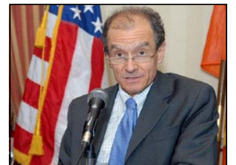
U.S. Assistant Secretary of State Daniel Fried

Fried argued that Armenia and Azerbaijan were already very close to cutting a peace deal when their presi-