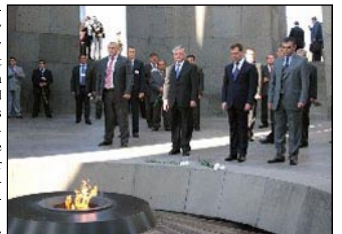
Russian President Dmitry Medvedev at the Armenian Genocide Memorial in Yerevan

"I hope that the three presidents will meet very soon to continue discussions on this theme," he said. "I hope that the meeting will take place in