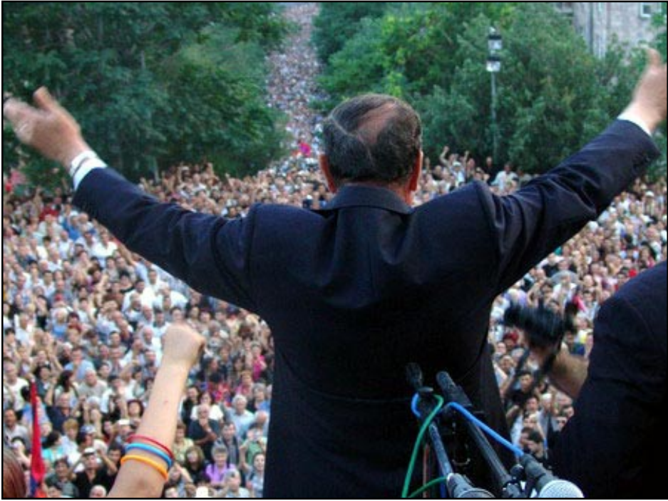
Տեսարան մը Հոկտեմբեր 17-ի հանրահաւաքէն

«Երես թեքելով Ռուսաստանից եւ լիովին ապաւինելով Արեւմուտքին՝ յանձինս ԱՄՆ-ի եւ նրա դաշնակից Թուրքիայի, Սերժ Սարգսեանը փաստօրէն վերջիններս է վստահում Հայաստանի արտաքին քաղաքականութեան ամենահանգուցալին խնդրի՝ Ղարաբաղեան հակամարտութեան միակողմանի կարգաւորումը: Նման եզրակացութեան հիմք է տալիս այն իրողութիւնը, որ Արեւմուտքն, ակնյայտօրէն, ջանում է Ռուսաստանը դուրս մղել Ղարաբաղեան կարգաւորման գործընթացից: Դրա ամենավառ արտայայտութիւնն են ինչպէս արեւմտեան դիւանագէտներին թափանցիկ ակնարկները, այնպէս էլ Ղարաբաղի հարցով հայթօրէք-աղբեջանական եռակողմ բանակցութիւնների անցկացման փաստը, եւ մասնաւոր թուրքիայի կողմից Միւսկի խմբի համանախագահութիւնն ստանձնելու հարաւորութիւնների վերաբերեալ խօսակցութիւնները: Ի դէպ, Սերժ Սարգսեանը տուեալ պահին այնպիսի կախեալ վիճակի մէջ է Արեւմուտքից, որ եթէ նրա առջեւ պահանջ դրուի Միւսկի խմբի համանախագահութիւնում Ռուսաստանը փոխարինել թուրքիայով, ապա նա հազիւ թէ կարողանայ ընդդիմանալ դրան»,- ըսաւ առաջին նախագահը՝ շարունակելով. - «Ըստ այդմ, այսօր վտանգի տակ է Միւսկի խմբի գոյութիւնը, որը տասնըվեց տարի շարունակ եղել է Լեւոնային Ղարաբաղի հարցի լուծման միակ միջազգային մեխանիզմը: Իր բոլոր թեքութիւններով հանդերձ, Միւսկի խումբը, Արեւմուտքի եւ Ռուսաստանի հաւասարաչափ ներկայացուածութեան եւ մասամբ նաեւ նրանց միջեւ գոյութիւն ունեցող մրցակցութեան շնորհիւ, մեզ հա-