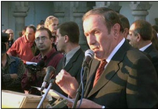
Levon Ter-Petrosian delivering his speech at the opposition rally

In a trademark long speech at what may have been his last rally in Yerevan this