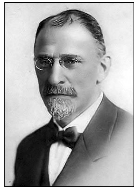
Ambassador Henry Morgenthau