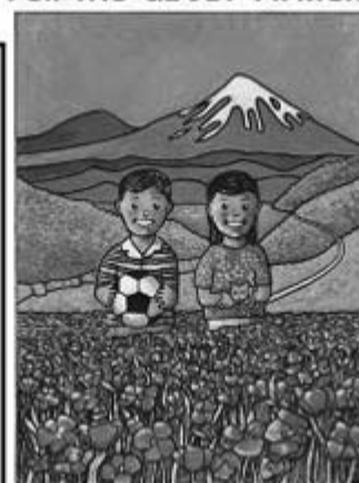
By Terri Lyn Eshilian