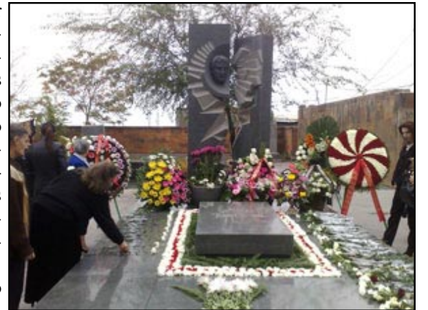
Laying flowers at the tomb of the Vazgen Sarkisian in Yerablur cemetery

Ter-Petrosian spoke to RFE/RL at the Yerablur military cemetery in Yerevan where he laid flowers at the tomb of the late Prime Minister Vazgen Sarkisian on the ninth anniversary of the latter's assassination in the October 1999 armed attack on the Armenian parliament. The first president of Armenia again accused his successors, Robert Kocharian and Serzh Sarkisian, of complicity in the still mysterious attack that also left seven other officials dead. "Even if they only covered up [the killings,] impeded the investigation or failed to ensure a fair court ruling, that still counts as complicity," he said.