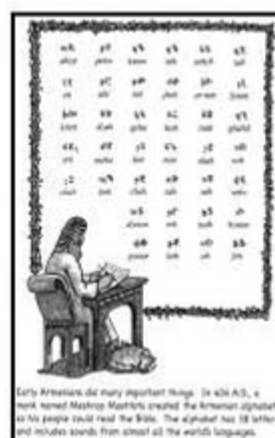
Early Armenians did many important things. In 400 A.D., a monk named Mesrop Mashtots created the Armenian alphabet so his people could read the Bible. The alphabet has 36 letters and includes sounds from almost all the world's languages.