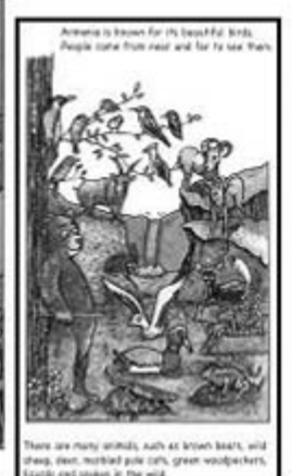
Armenia is known for its beautiful birds. People come from near and far to see them. There are many animals, such as brown bears, wild sheep, deer, horned grey cats, green woodpeckers, quails and owls in the wild.

Here is a book you can read to your child which explains “Armenia” is more than just a word. It is a rich land with a proud heritage. The perfect gift to expand the horizons of the next generation!