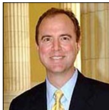
Congressman Adam Schiff

and a half Armenians perished in the first genocide of the last century, and no amount of spending by the forces of denial can rewrite history or discourage my pursuit of recognition."