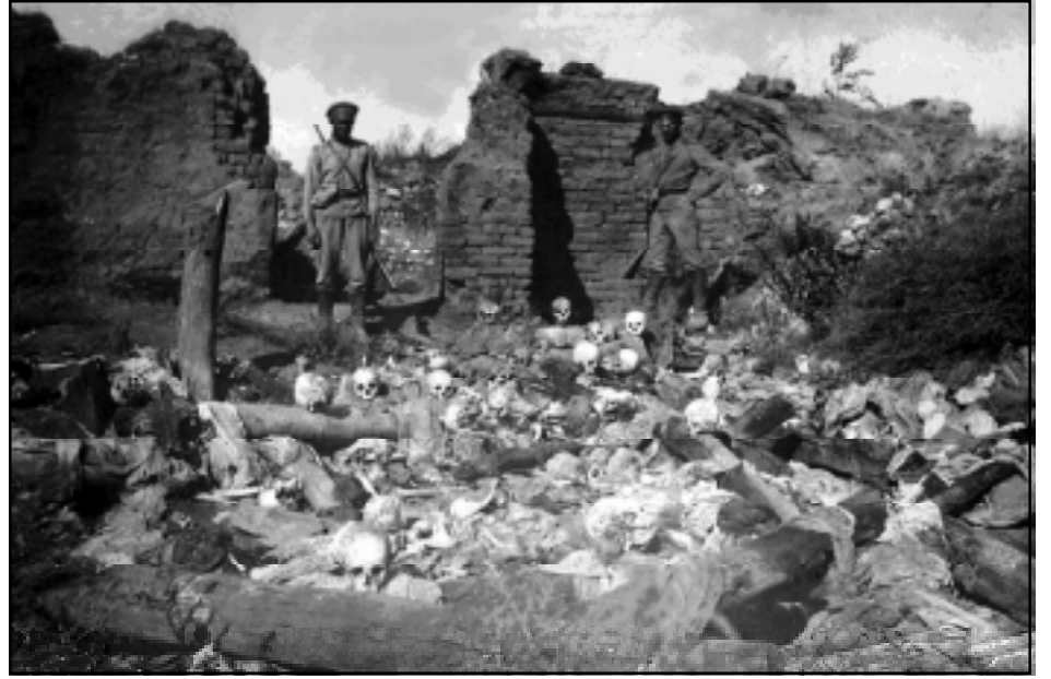
Նոր յայտնաբերուած նկարը ցոյց կու տայ կոտորածներու ընթացքին հրկիզուած հայկական գիւղերու բնակիչներու մատուցները

Հայոց Ցեղասպանութեան թանգարան-ինստիտուտի կողմէ տարուող հետազօտական եւ հաւաքական աշխատանքներու արդիւնքով արձանագրուեցաւ ուշագրաւ նոր բացայայտում: Վերջին ձեռքբերումը Հայոց Ցեղասպանութեան առնչուող խիստ կարեւոր լուսանկարի մը բնագրի յայտնաբերումն է: