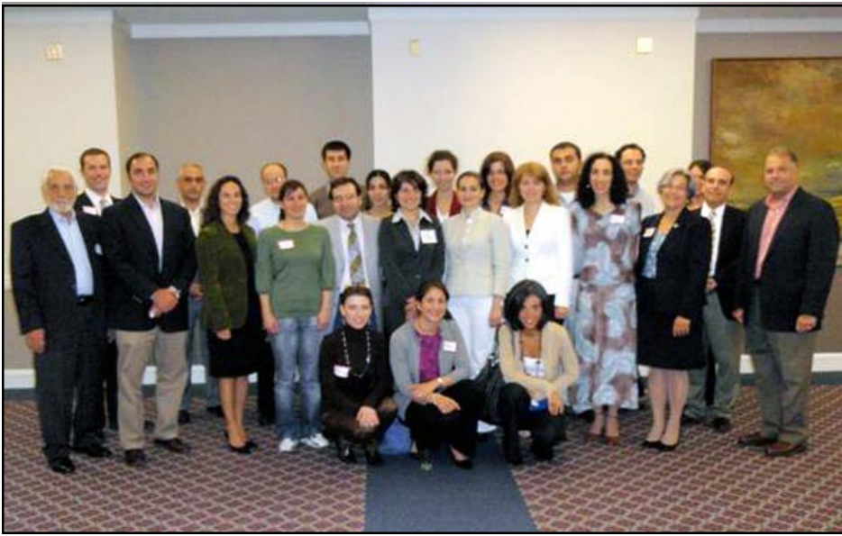
Armenian Bar Association networking reception participants at Suffolk University Law School in Boston