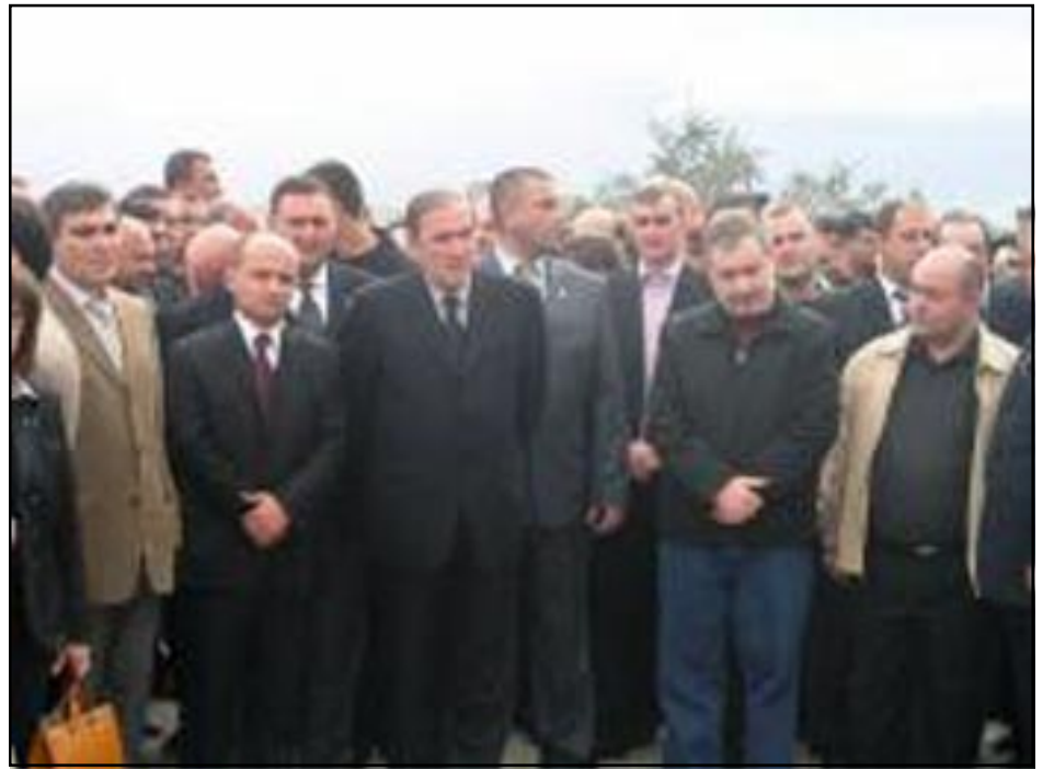
Ընդդիմադրութեան առաջնորդները Եռաբլուր կատարած այցի ընթացքին

«Հոկտեմբերի 27-ն էլ, Մարտի 1-ն էլ այս իշխանութիւնների օրօք չեն բացայայտուի: Այն իշխանութիւնը, որը գործել է այդ յանցագործութիւնները, ինչպէ՞ս պէտք է բացայայտի դրանք», - հարց տուած է առաջին նախագահը՝ աւելցնելով, որ Ստալինի ոճրագործութիւններն ալ բացայայտուեցան միայն անոր մահուանէ ետք: «Քանի դեռ այսպիսի բռնապետութիւն է, իհարկէ, չի բացայայտուի: Այս իշխանութիւնն է