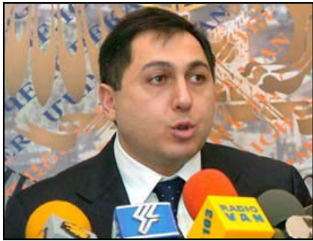
Հայաստանի մարդու իրավունքների պաշտպան Արմեն Յարուժիկենյան

«ԱԶԱՏՈՒԹԻՒՆ ՌԱՏԻՕ»: Հայաստանի մարդու իրավունքների պաշտպան Արմեն Յարուժիկենյանը կարեկոր է համարում ընդդիմադիր քաղաքական ուժերի մասնակցությունը Մարտի 1-ի իրադարձությունները ուսումնասիրելու համար կազմակերպելիք փաստահավաք խմբի աշխատանքին: