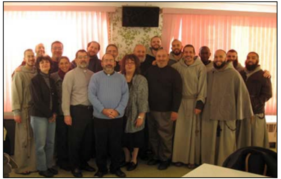
St. Nersess Alumni pose with brothers of the Franciscan Friars of the Renewal at their annual retreat