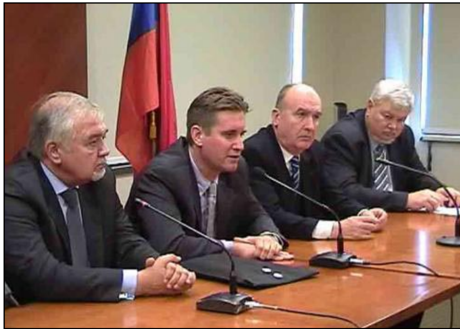
Cochairmen of OSCE Minsk Group speaking at a press conference in Yerevan

Bryza's French and Russian counterparts similarly sounded cautiously optimistic about a future peace plan.