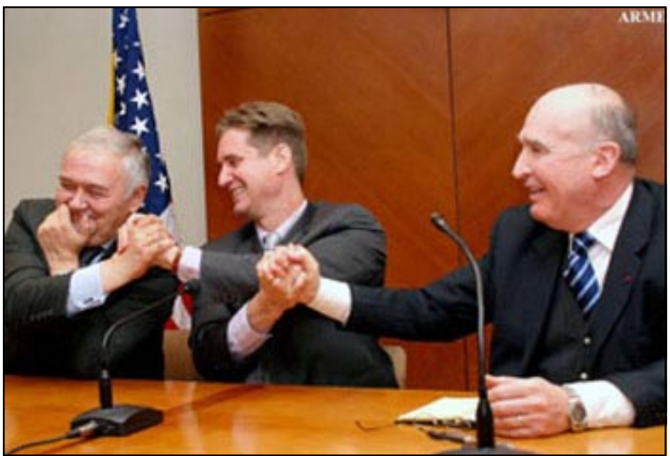
Ձախէն՝ Եւրոպի Մերձկալով, Մեթիւ Պրայզա եւ Պեռնար Ֆասիէ Երեւանի մէջ տեղի ունեցած մամուլի ասուլիսի ընթացքին կը ցուցադրեն իրենց «միասնականութիւնը»

Ֆրանսացի համախաղաղահան Պեռնար Ֆասիէ, իր հերթին յայտնեց, թէ կարեւոր է հասկնալ, որ իրենք այժմ կը գտնուին խաղա-