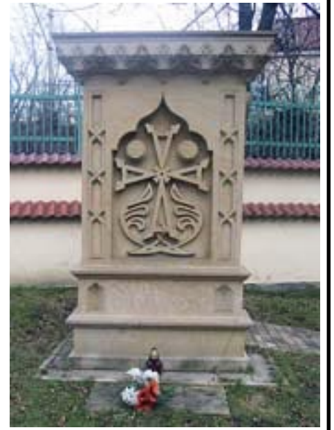
PLACES, THE ARMENIAN CATHOLIC PRIESTS IMPRISONED, KILLED OR TAKEN AWAY TO SIBERIA BY

THE VICTIMS OF THE GENOCIDE EXECUTED ON THE ARMENIANS IN TURKEY IN 1915 THE ARMENIANS AND THE POLES MURDERED BY THE UKRAINIAN NATIONALISTS FROM UPA 19-21 IV 1944 IN KUTY ON THE CZEREMOSZ AND IN OTHER BORDERLAND